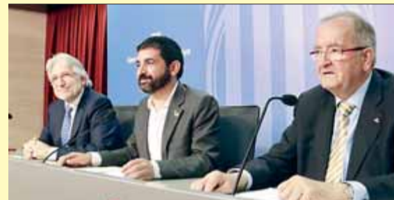
Els presidents de les patronals i el conseller de Treball ■