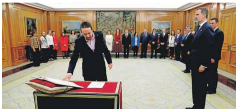
Iglesias prenent possessió del càrrec a La Zarzuela el 13 de gener passat

suport als diputats prevista per dimarts d'Òmnium i ANC, el col·lectiu Urquinaona ho tornarem a fer ha convocat per avui a les dues de la tarda una mobilització de dos dies al parc de la Ciutadella. ■