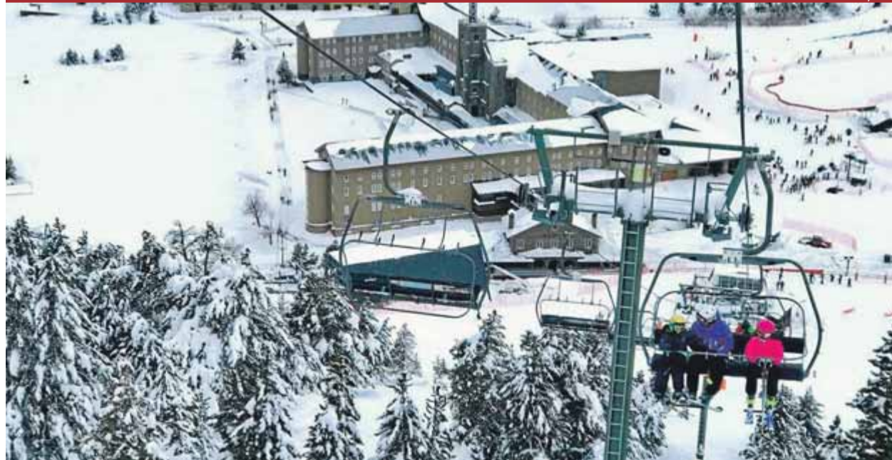
L'estació de Vall de Núria, en una imatge d'ahir al matí