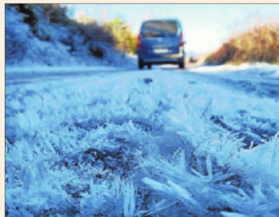
Hivern al Pallars. Aquesta gèlida imatge la va capturar Arnau Soriano a la localitat d'Aulàs, al Pallars Jussà.