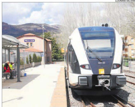
Imatge d'arxiu d'un dels trens de la línia de la Pobla.

Ferrocarrils de la Generalitat preveu la incorporació d'un nou comboi per a finals d'aquest 2020