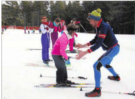
Alumnes de l'escola La Salle de la Seu d'Urgell van participar ahir en la primera sessió d'esquí a l'estació d'Aransa.