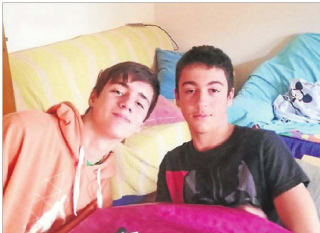
Moltes felicitats per a aquests dos cosins amb motiu del 13è i 14è respectiu aniversari, us estimem.