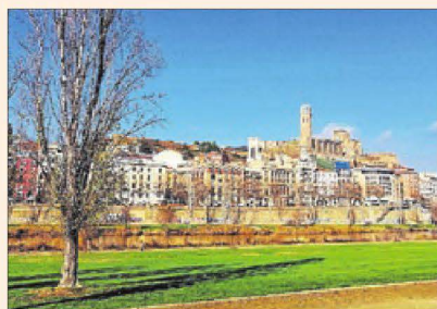
"Després de 15 dies de boira a Lleida, per fi arriba un lluminós dia de sol."