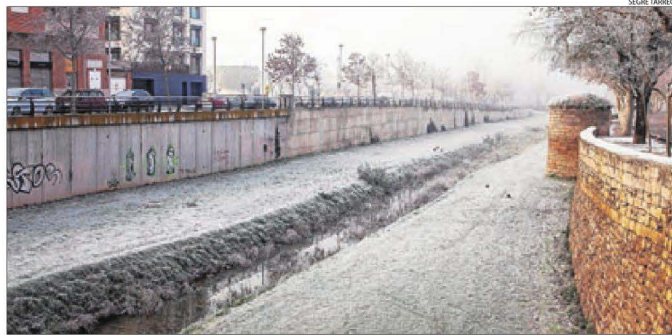
Imatge de Tàrrrega, on ahir es van arribar a registrar 4,9 graus sota zero de mínima.

cipal missió del qual és protegir, amb la seua presència al mar, aquelles persones que intenten arribar fins al continent europeu fugint de conflictes de tipus bèl·lic, de persecucions o de la pobresa.