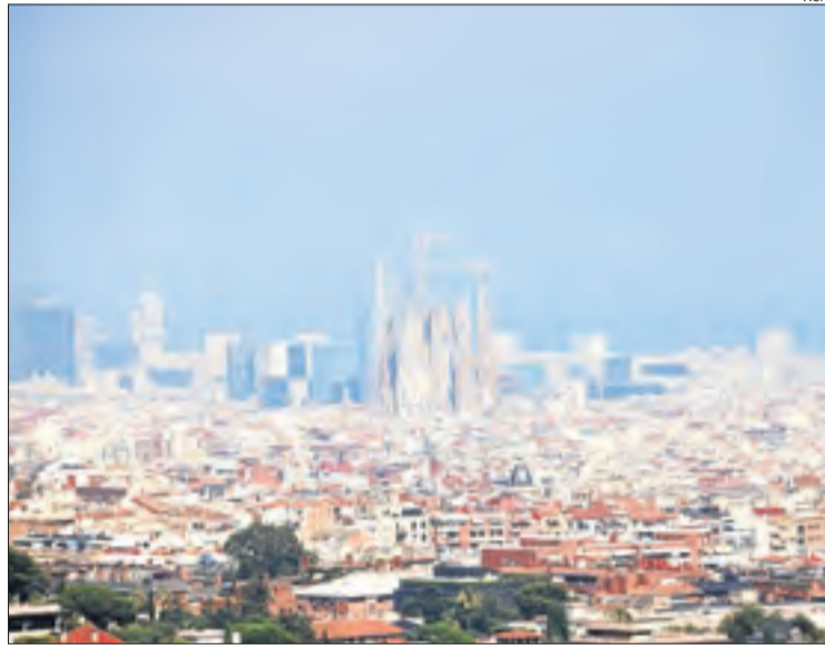
Imatge d'arxiu de pol·lució a Barcelona.

La mesura s'ha pres a causa dels nivells entre moderats i alts de partícules PM10 que estan