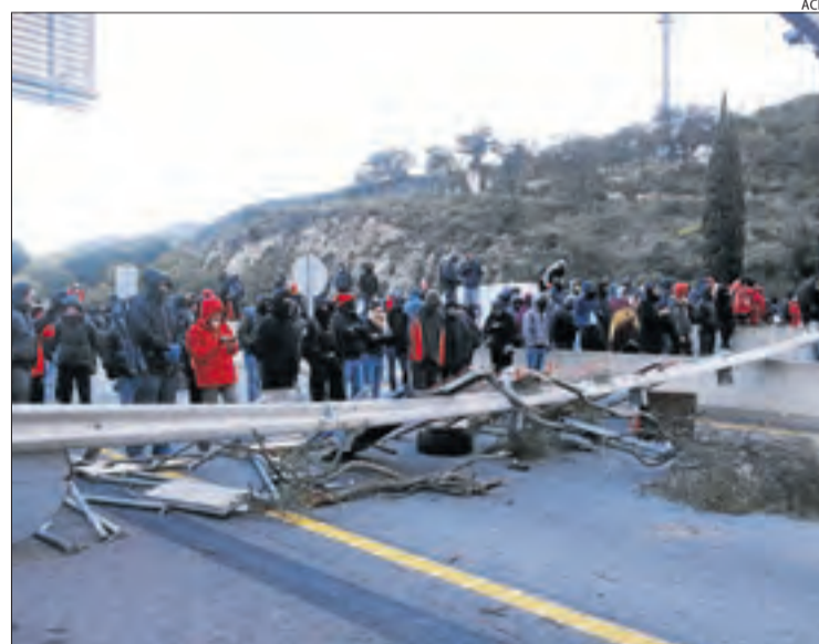
El tall va tenir lloc el novembre passat i va durar 32 hores.

La Guàrdia Civil els investiga pels delictes de desordres, danys i contra la seguretat en el trànsit