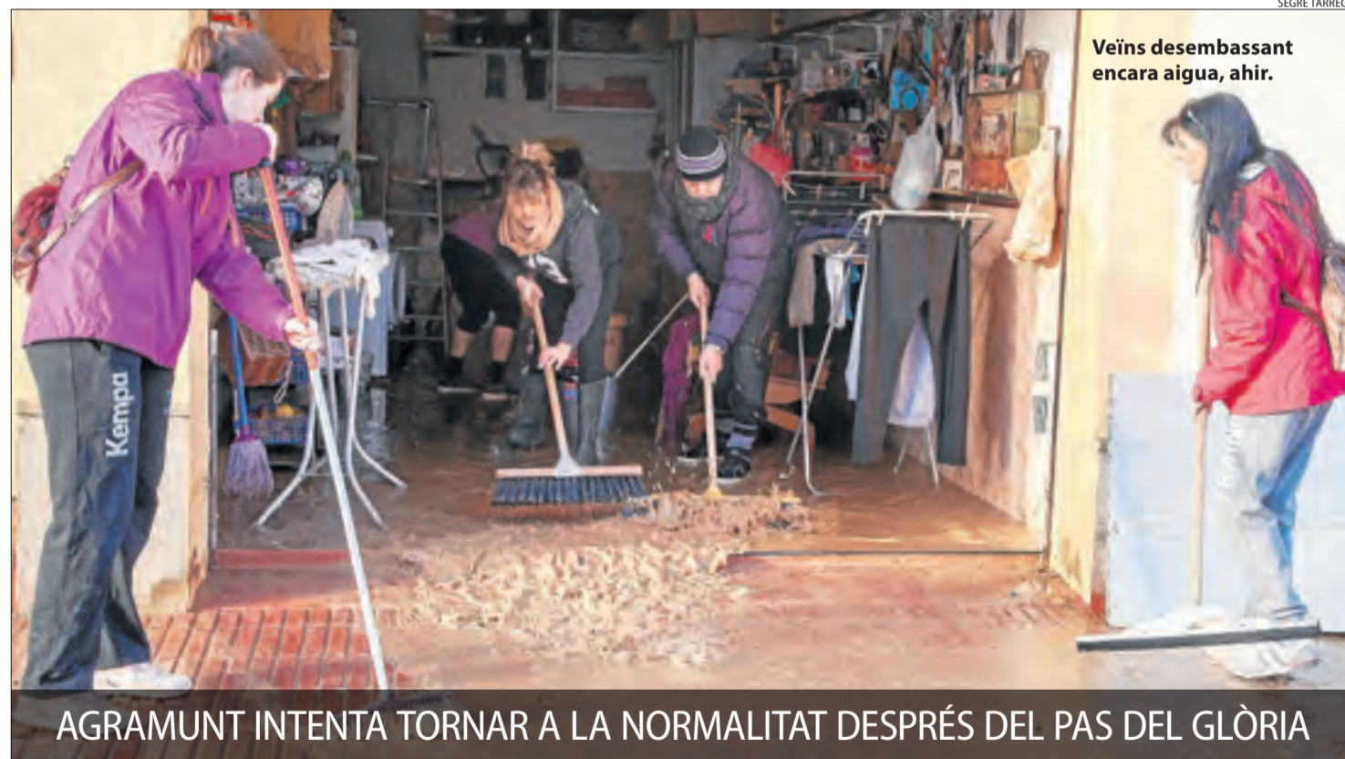
Veïns desembassant encara aigua, ahir.

AGRAMUNT INTENTA TORNAR A LA NORMALITAT DESPRÉS DEL PAS DEL GLÒRIA