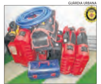
El material recuperat.