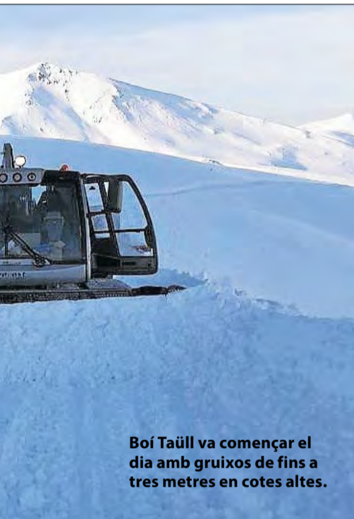
Boí Taüll va començar el dia amb gruixos de fins a tres metres en cotes altes.

■ Tècnics de carreteres de la Generalitat van treballar ahir durant el dia per assegurar un talús de la C-13 a Talarn, després del desprendiment de roques dijous a la nit, que va provocar un accident de trànsit. Un turisme va col·lidir contra una gran roca al punt quilomètric 89, al costat de l'encreuament del municipi de Talarn. La conductora del vehicle no va poder esquivar la pedra encara que va sortir il·lesa de la col·lisió. Els fets van ocórrer al voltant de les deu de la nit i durant més d'una hora es va haver de tallar la circulació a la carretera fins que els operaris i els Bombers de la Generalitat netegessin la calçada de les pedres i es pogués garantir la seguretat.