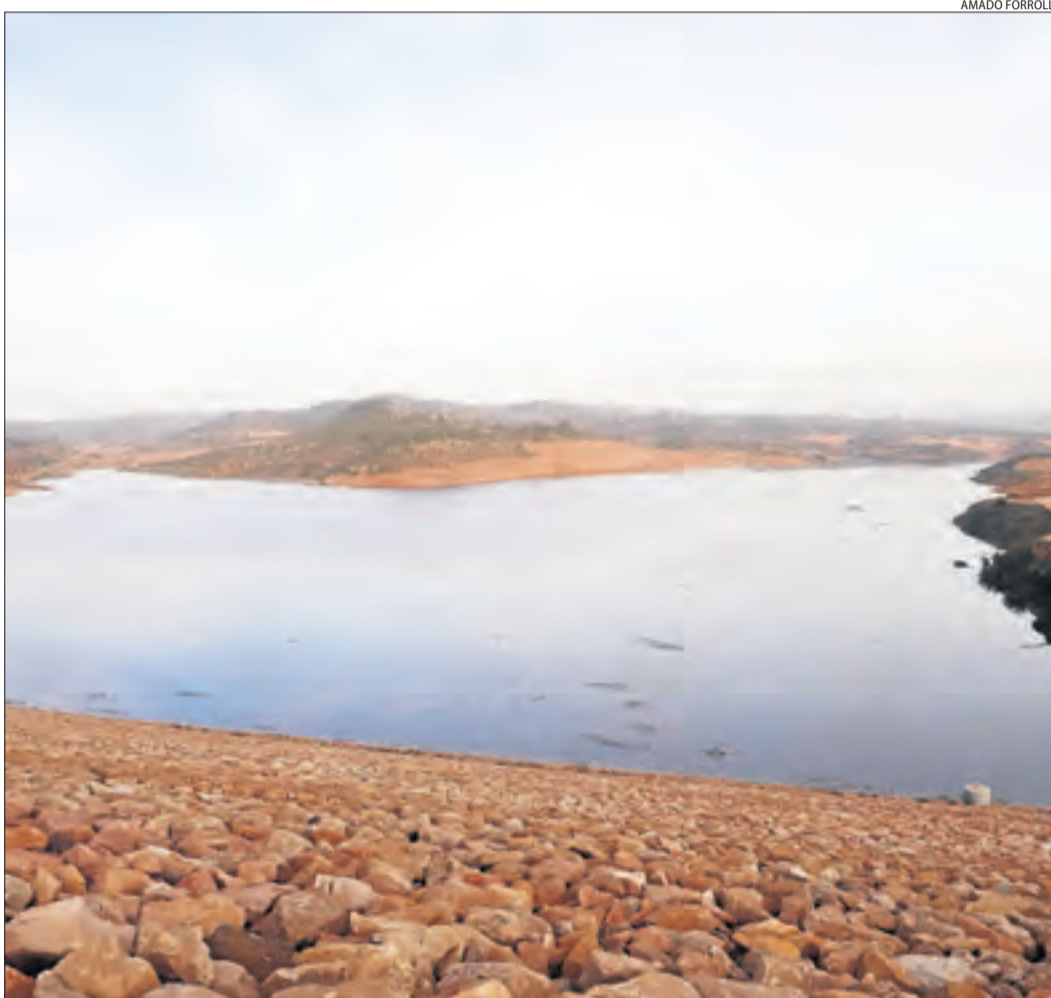
El pantà de l'Albagés ha augmentat les reserves en tres dies procedents del riu Set.