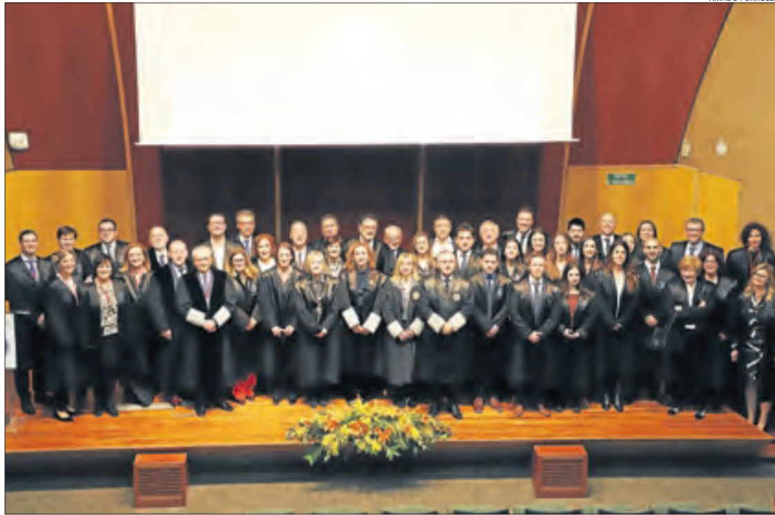
Fotografia de grup amb els nous lletrats, els homenatjats i les autoritats.

L’acte, que es va celebrar al Rectorat de la Universitat de Lleida, va començar amb la im-