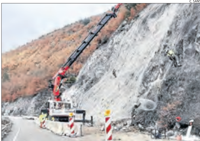
Operaris ahir treballant a l'N-260 al Pont de Bar.

■ La boira va ser protagonista ahir al matí a les comarques del pla. Per a aquest cap de setmana s'espera algun xàfec a Lleida i temperatures a l'alça al Pirineu.