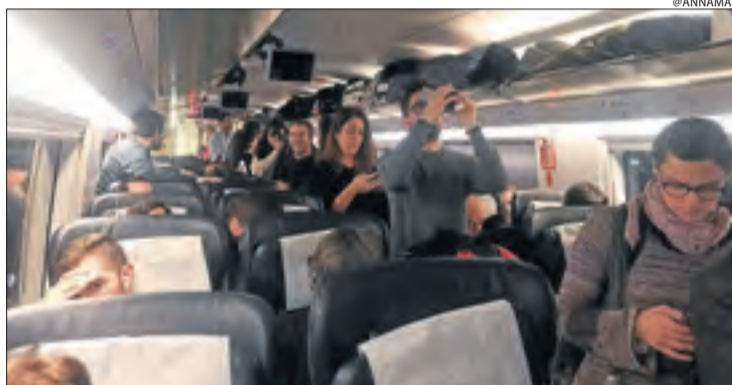
Els passatgers afectats, a peu dret a l'AVE on van ser recol·locats.

Bitllet || La companyia ofereix a aquests clients tornar-los l'import del trajecte, com a la resta de persones perjudicades