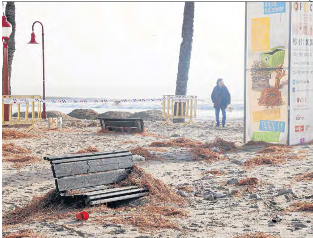
Els desperfectes al passeig Marítim de Cubelles (Barcelona) després del pas del Glòria.