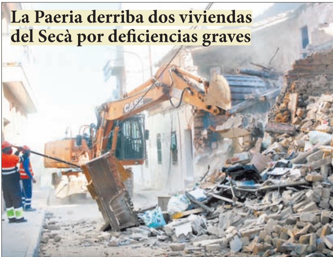
El derribo fue consecuencia de la caída parcial del techo de una de las casas LOCAL | PÁG.7