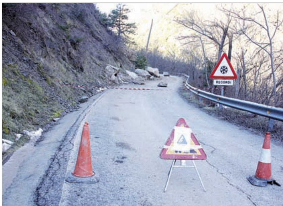
Imatge del punt on van caure diverses roques, que han obligat a tallar la via