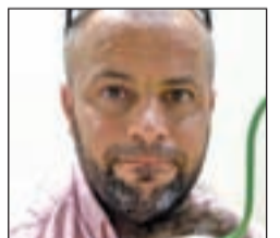
El padre de la niña

El padre pidió ayuda en la Plaça Europa aunque varios coches le esquivaron. La niña ya se encuentra fuera de peligro y el conductor que les llevó se localizó gracias a las redes sociales. LOCAL | PÁG.13