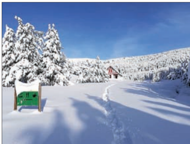
Es preveu reobrir Comes de Rubió el cap de setmana

lització dels punts més conflictius ha estat possible gràcies a la col·laboració d'ajuntaments i ciutadania, mitjançant, sobretot, de l'aplicació de mòbil Alt Pirineu, Deixa't Guiar , impulsada per l'Associació Esportiva Pallars, i el seu apartat per reportar fotoincidències. Es calcula que a mesura que es pugui accedir a cotes més altes, el nombre d'actuacions a realitzar es multiplicarà.