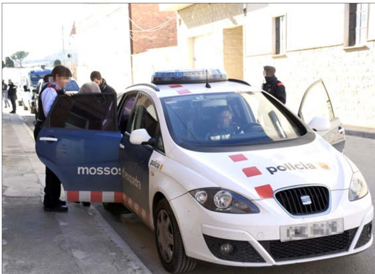
Moment en què la dona detinguda a Rosselló era introduïda al cotxe policial després de ser detinguda pels agents

Per altra banda, segons van indicar fonts properes a la investigació, una de les hipòtesis en les que treballen els investigadors que han portat el cas és que aquesta organització portava a terme tràfic d'immigrants en dues direccions, és a dir, algunes persones entraven a l'Estat espanyol de manera irregular, mentre que altres passaven cap a Europa. De fet, aquesta operació va ser ordenada per un jutjat de Tremp després de que aquests moviments fossin detectats al Pirineu, en zones fronteres. Les mateixes fonts properes al cas van explicar