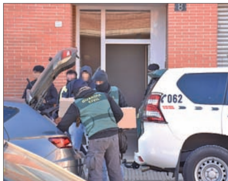
Agents agafant proves per poder analitzar

L'operació de Mossos i Guàrdia Civil es va centrar principalment a Ponent, concretament amb registres a Torrefarrera i Rosselló, llocs on van ser detingudes dues persones. Malgrat tot també es van fer entrades a Mataró, a propietats que alguns detinguts tenien en aquest municipi. Indicar que el seu caràcter internacional es veu reflectit en el fet de les entrades i registres duts a terme a Portugal, tot i que també es podrien fer d'altres en diferents països europeus en posteriors fases d'aquesta operació i un cop estiguin analitzades les connexions que tenien els detinguts d'ahir amb terceres persones possiblement vinculades.