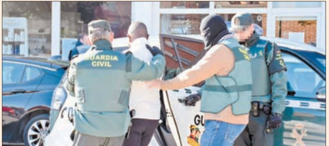
La Guardia Civil con el arrestado en Torrefarrera

Dos arrestos se efectúan en Torrefarrera y Rosselló y la red tiene vínculos con Portugal