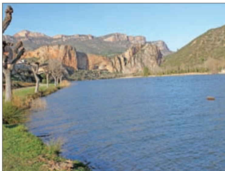
Les darreres pluges han beneficiat la situació