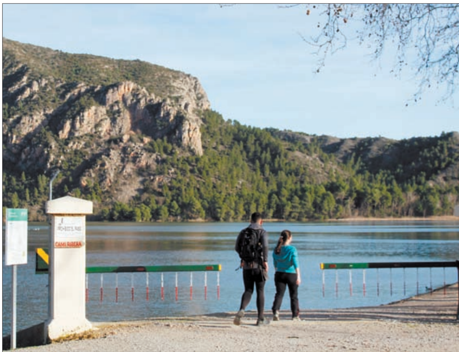
Imatge que ofería ahir el pantà de Sant Llorenç de Montgai, a la Noguera, al 94,6% de la seva capacitat