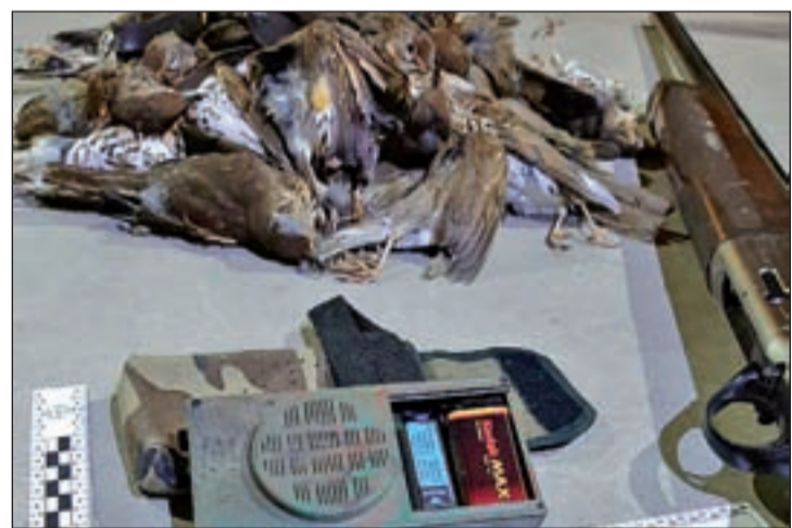
Feien servir reclams electrònics per caçar tords