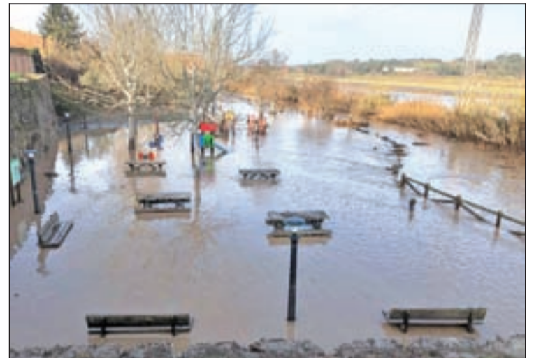
Estat en què va quedar un dels parcs de Montgai

L'Ajuntament de la Sentiu ha demanat aquesta col·laboració, tot i que estan pendents "de la disponibilitat dels joves perquè puguin venir". Encara no tenen cap data prevista però saben que les tasques de neteja s'hauran de fer "a la carretera vella del pont". Aquest no és l'únic poble que ha