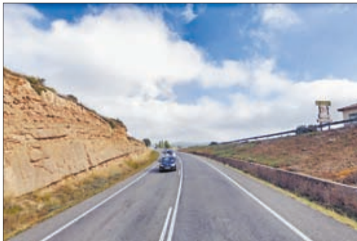
La C-14 al seu pas pel terme de Vilanova de l'Aguda

nes van resultar ferides, un home en estat greu i una dona en estat menys greu. Així, fins al lloc dels fets es van desplaçar Mossos, Bombers i SEM, que va traslladar els ferits al centre hospitalari de la capital del Segrià. Finalment, el jove va morir ahir i al tancament d'aquesta edició encara no havia transcendit la identitat ni el veïnatge. Cal indicar que amb aquesta víctima són 13 les persones que han mort en accident de trànsit aquest any a la xarxa viària interurbana de Catalunya, segons va informar el Servei Català de Trànsit en un comunicat.