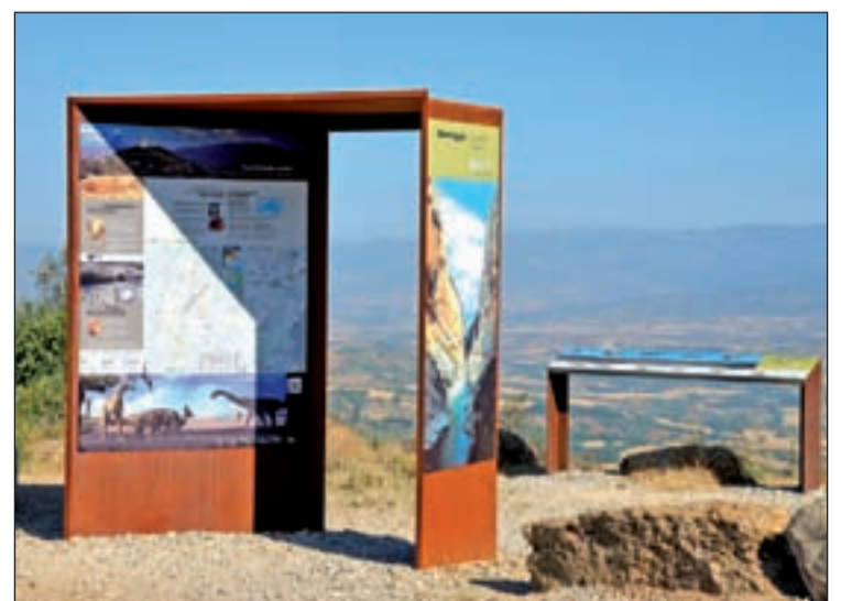
Una porta d'entrada al territori Geoparc

El logotip incorpora un dels trets més significatius del territori, com és la presència de fòssils dels darrers dinosaures que van viure a Europa abans de la seva extinció. La lletra 'O' incorpora l'empremta d'un d'aquests animals, en concret el titanosaure, i s'hi pot distingir la petjada de la pota del darrera, de forma arrodonada, i la del davant.