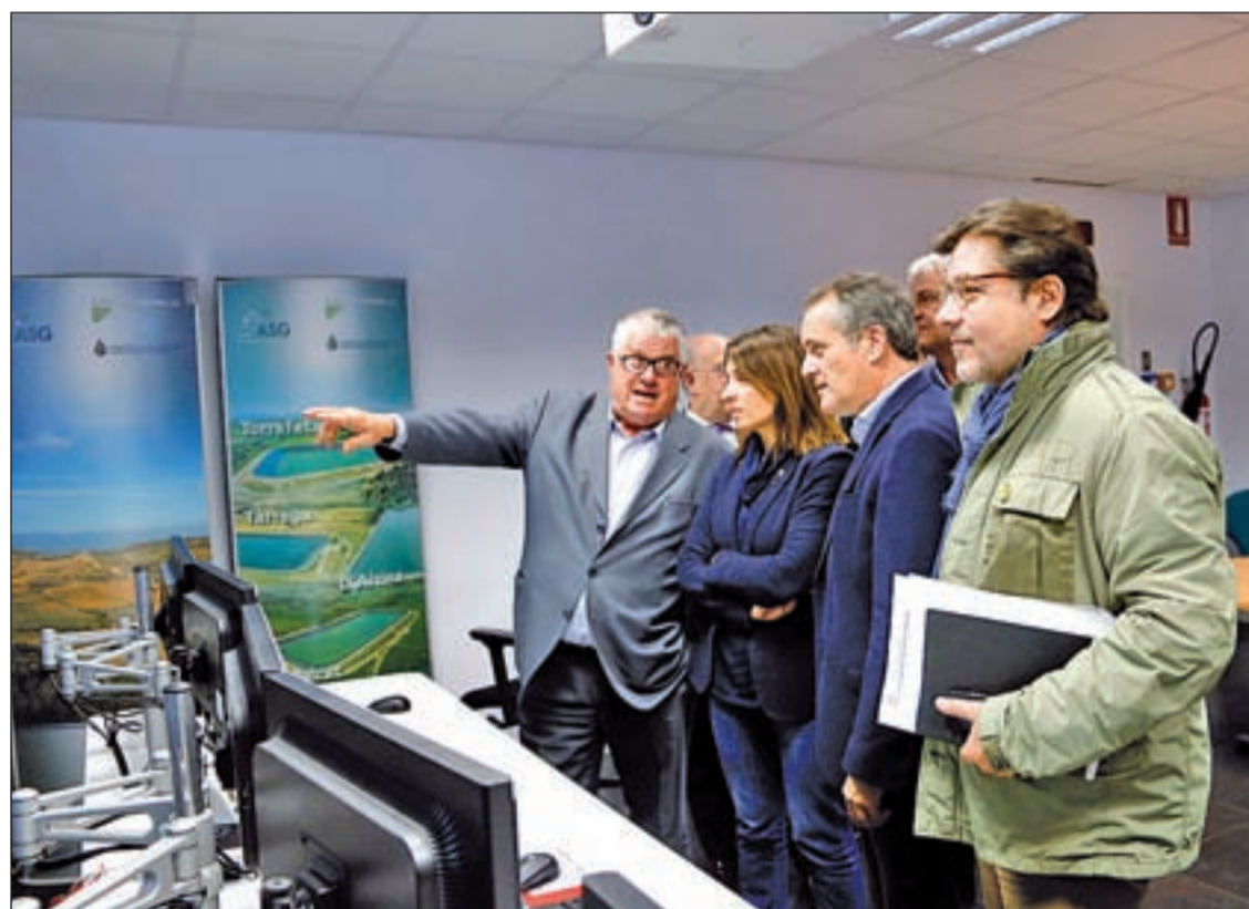
Imatge de la visita de la consellera Meritxell Budó a la seu del canal

D'altra banda, la consellera també es va manifestar al respecte de la taula de diàleg amb el govern espanyol per desencallar el conflicte polític català. En aquest