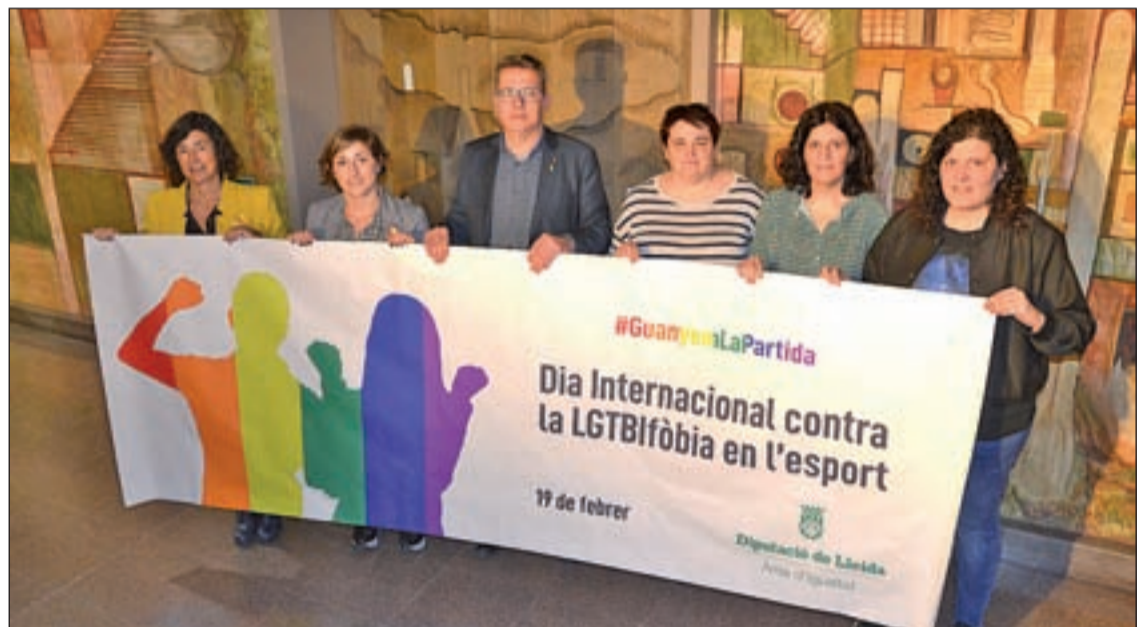
La iniciativa se presentó ayer en la Diputació de Lleida

Los principales clubes de la provincia en cuanto a categoría se adhieren