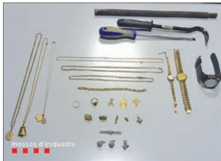
Les joies sostretes en el pis d'Artesa de Segre

Dos turisme van xocar ahir quan circulaven per l'L-200, al terme municipal de Puiggròs, tot i que cal destacar que no van haver-hi ferits. En aquest sentit, els serveis d'emergències va ser alertats del sinistre a les 17.00 hores i fins al lloc es van desplaçar els Mossos, el SEM i els Bombers.