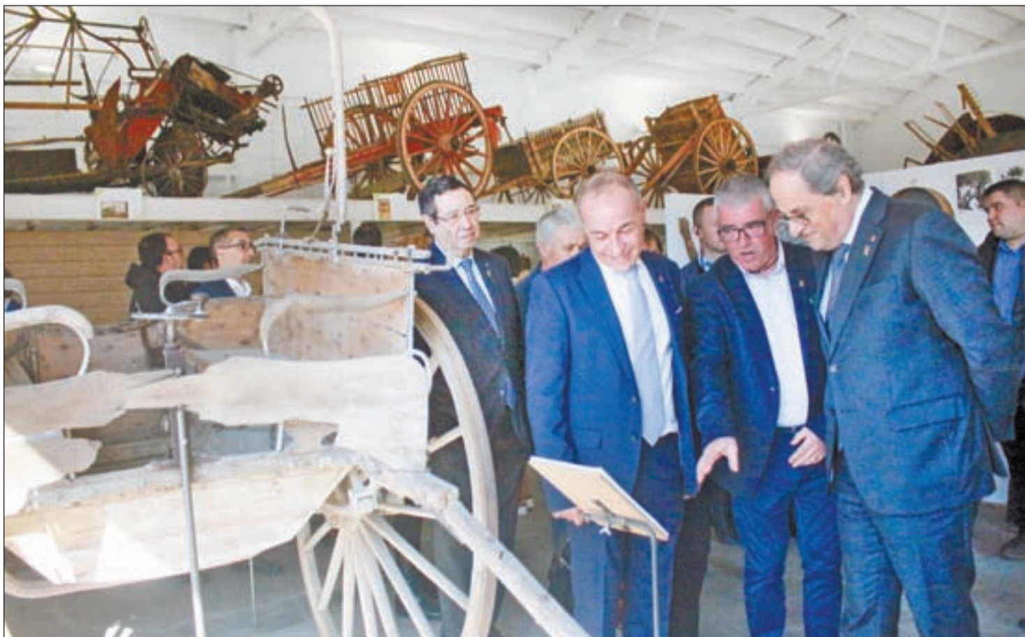
Quim Torra visitó el Centre d'Interpretació del Món Rural en Alcarràs, uno de los municipios impulsores de las reivindicaciones

AÑO: LXXXII · NÚM: 28.002 · Precio: 1,30€