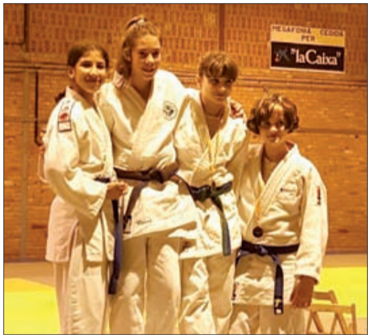
Uno de los podios con presencia leridana

El Dojo Lleida participó con una delegación de 11 judokas en el pasado Campionat de Catalunya Infantil i Cadet que se disputó en Falset, consiguiendo además unos grandes resultados.