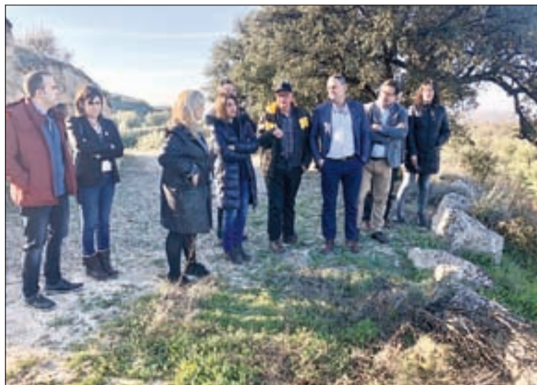
Imatge de la visita de la consellera a les Borges Blanques

Viu'. Segons va exposar Budó, "des de la Generalitat, hem impulsat aquest projecte per permetre el desenvolupament territorial, la lluita contra el despoblament. Per tant, garantir la igualtat d'oportunitats a totes les persones que, visquin on visquin, puguin desenvolupar el seu projecte de vida allà on hagin nascut, si aquesta és la en la seva decisió".