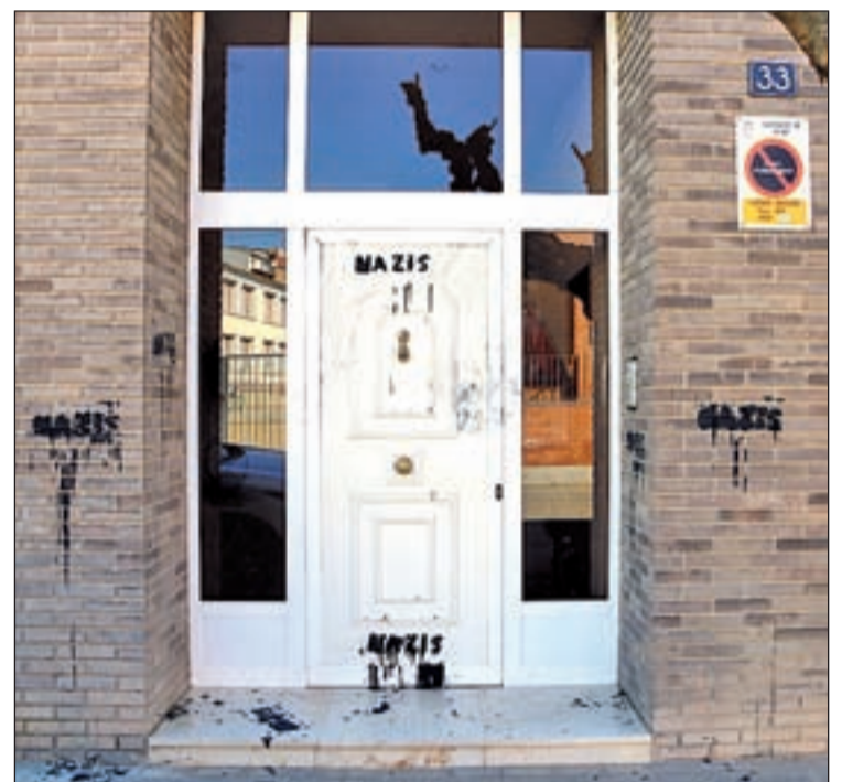
L’alcaldessa es mostra dolguda i preocupada per l’atac

Un cop els de la Científica van analitzar totes les pintades, les van poder netejar de les parets. Ara ja no hi són però el record hi continuarà sent perquè “no és només una pintada”. En desconeix el motiu i confia que només es tracti d’un fet aïllat, “d’algú que volia fer una bretolada” però “si no és així, és greu”.