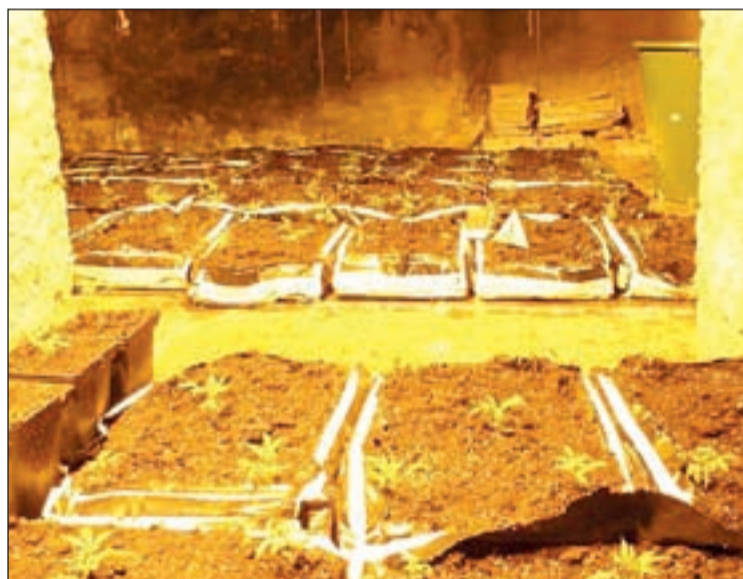
La plantació estava en el soterrani d'una casa

Els Mossos van detenir dimarts un jove de 26 anys com a presumpte autor d'un delictes contra la salut pública i un altre de defraudació de fluid elèctric. El seu arrest és el resultat d'una investigació oberta el 24 de gener passat, després de localitzar una plantació de marihuana al soterrani d'una casa d'Isona i Conca Dellà. En el desnonament judicial es van intervenir 200 plantes.