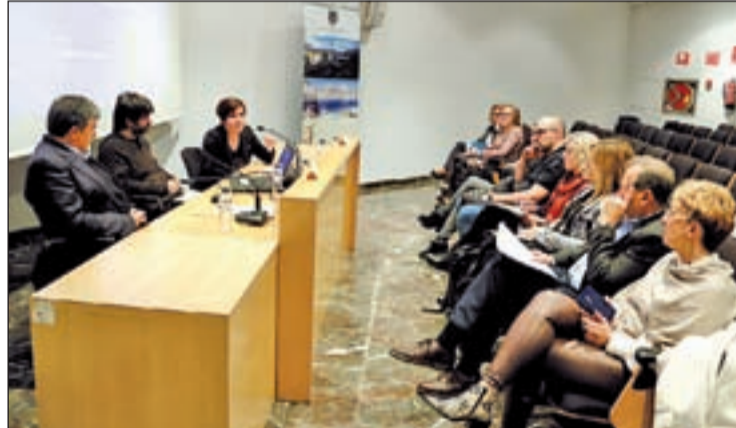
FOTO: / Tremp va acollir ahir l'acte inaugural del Mobile Week Pirineu

Cases va dir que contrasta que parlem de tecnologies tant avançades i alguns pobles del Pirineu