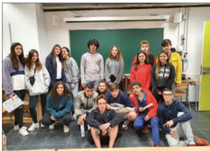
La organización calienta motores para la Flamicell

Ayer, la Pobla acogió la Trobada Comarcal de Mini-atletisme con la participación de 400 esco-