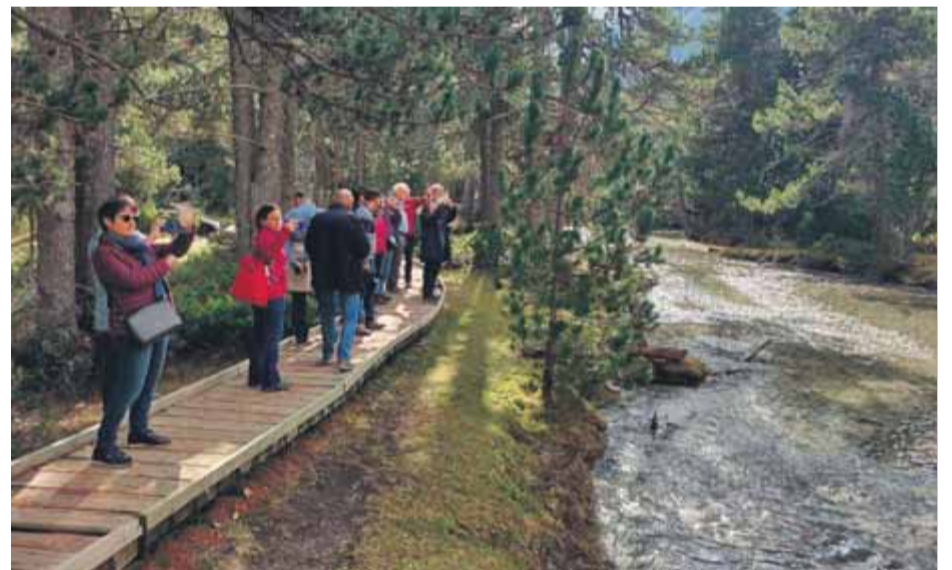
El Parc d'Aigüestortes i Estany de Sant Maurici és un dels atractius del Pirineu

Prenen molta importància les cases del parc com a centres de recepció, gestió de visites i educació ambiental. La casa del Parc d'Espot va rebre 22.478 persones i Boí, 14.572 persones. Així mateix, l'Ecomuseu Els Pastors de la Vall d'Àssua, situat a la localitat de Llesui, amb una exposició sobre la ramaderia als Pirineus, ha assolit les 5.106 visites. Prop de dues mil persones van participar