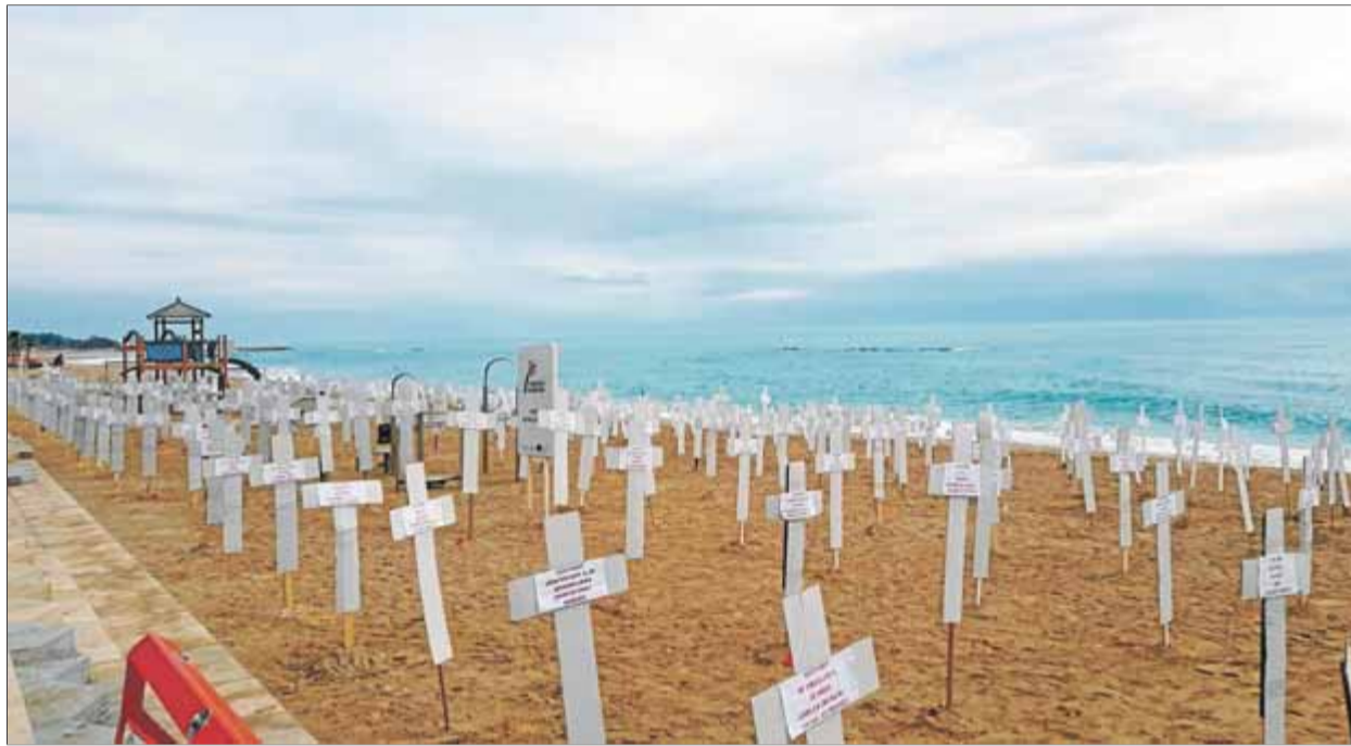
Creus contra la violència masclista a la platja de Vinaròs en una imatge d'arxiu ■ VICENT ROYO

El nombre de dones assassinades no ha deixat d'augmentar en els darrers anys. Paradoxalment, però, aquest increment de víctimes femenines tindria relació amb l'evolució del rol social de la dona, que ara té més presència a la vida pública. Això conclou un estudi de la Universitat Oberta de Catalunya i la Universitat de Lausana en què es recopilen per primera vegada les dades sobre víctimes d'homicidis a l'Estat espanyol, desagregades per gènere, des de 1910 fins al 2014. En l'anàlisi es detecta una tendència a l'alça de la mortalitat femenina als anys seixanta i que no deixa d'augmentar. Concretament, als anys quaranta, per cada 10 homes assassinats una dona moria en aquestes condicions, mentre que actualment la proporció és d'una dona víctima d'homicidi per cada dos homes. És per això que l'estudi vincula l'increment dels homicidis en-