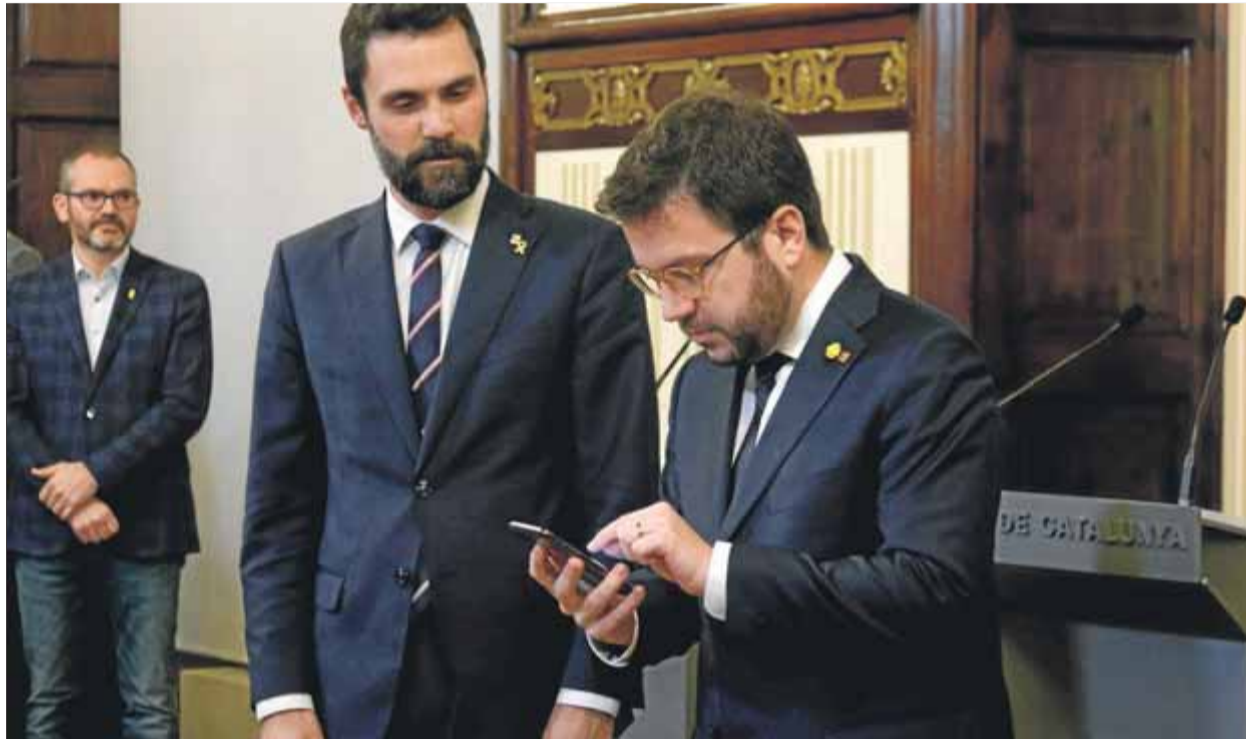
El president Torra i el vicepresident Aragonès (ERC) van presentar la setmana passada la proposta de pressupost