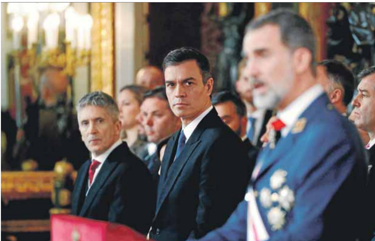
El rei Felip VI, durant el seu parlament a Madrid el 6 de gener