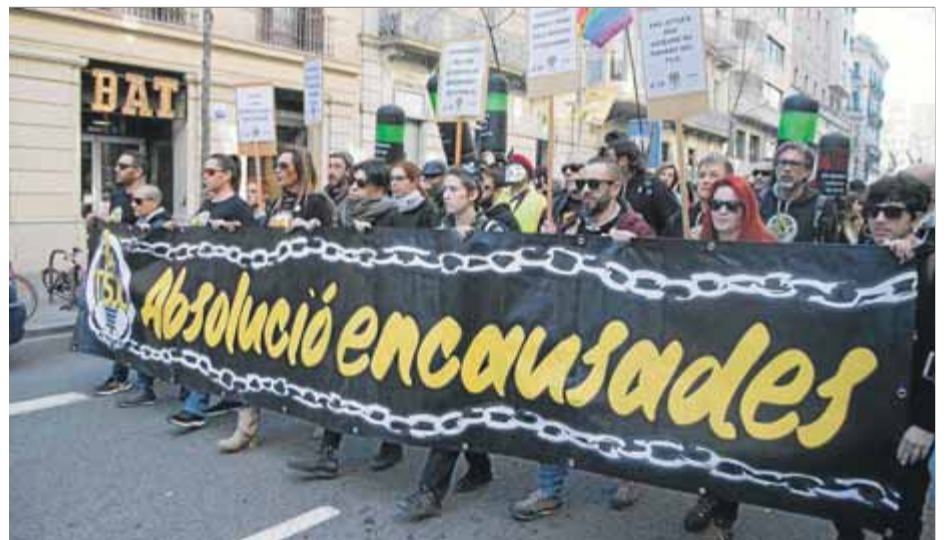
Els manifestants avançant pel carrer Jonqueres, cap a Arc de Triomf

En la manifestació d'ahir també es va reclamar justícia per a altres independentistes que han estat represaliats. ■