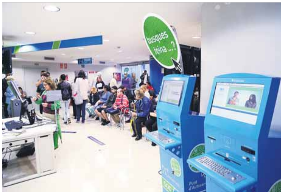
La tramitació dels ajuts de la renda que es fan a les oficines de treball