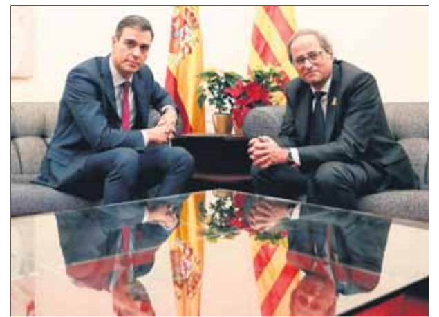
Sánchez i Torra, el desembre del 2018, en la reunió que van mantenir al Palau de Pedralbes i que es repetirà dijous

D'altra banda, la defensa de Traperó va renunciar ahir a cinc testimonis: l'exvicepresident Oriol Junqueras, l'exlíder de l'ANC Jordi Sánchez, l'expresident Artur Mas, els exconsellers d'Interior Quim Forn i Jordi Jané, que sí que haurà d'anar a la vista perquè també és testimoni de la defensa de Puig. Avui continua el judici amb la declaració del secretari dels atestats. ■