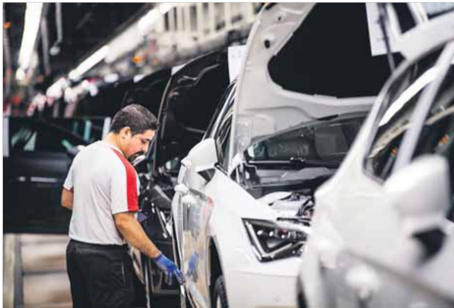
Un treballador d'una empresa automobilística, en una imatge d'arxiu

Sobre política fiscal, CCOO reconeixia "un marc fiscal més progressiu i just", tot i que lamentava que "els ingressos continuen tenint, en comparació amb altres països europeus i comunitats autònomes, un recorregut significatiu" i reclamava "una política fiscal que persegueixi la competència a la baixa entre comunitats autònomes pel que fa a l'Estat, i que penalitzi, amb els recursos necessaris, el frau, l'evasió i l'elusió fiscals". Però per Foment del Treball "l'increment fiscal a persones, empreses i autònoms, en relació amb altres comunitats, és confiscatori i perjudica la compe-