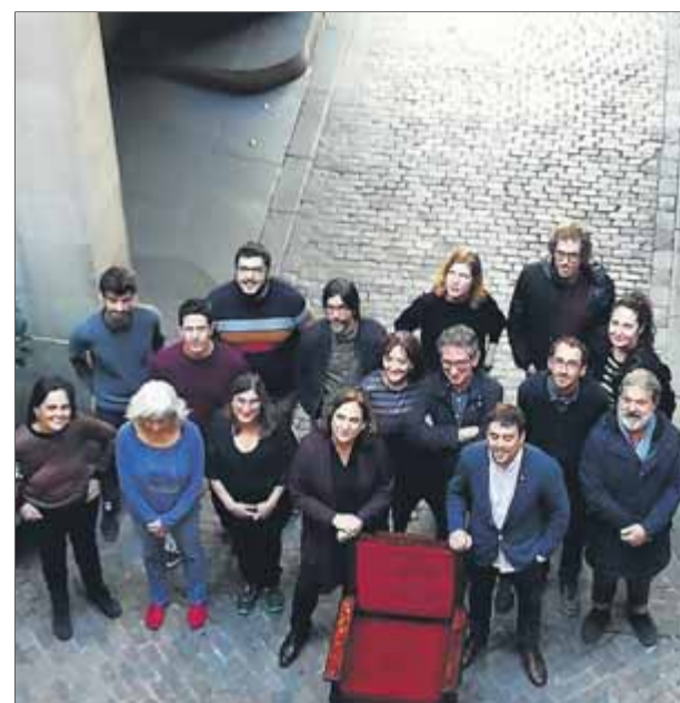
Colau amb el regidor Serra i l'equip que ha participat en la preparació de la campanya participativa

També destaca l'increment en recerca, que creix un 18% respecte a l'últim exercici, passant de 44 a 52 milions d'euros. ■