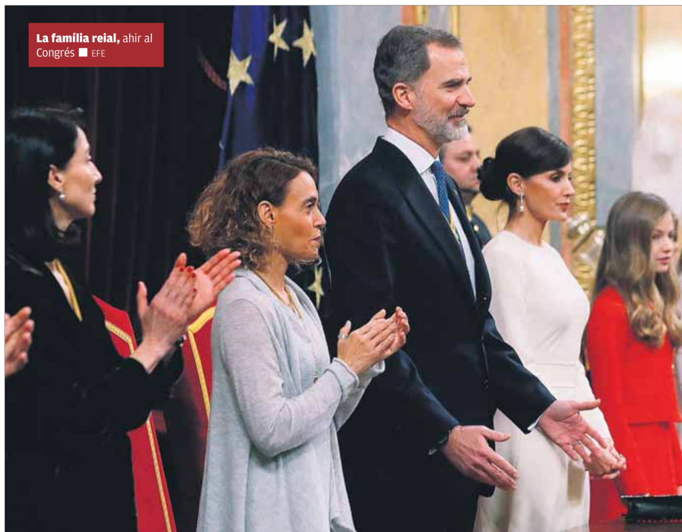
La família reial, ahir al Congrés

El discurs bel·ligerant del monarca contra l’independentisme l’octubre del 2017 –que només va defensar la posició dels poders de l’Estat obviat tota