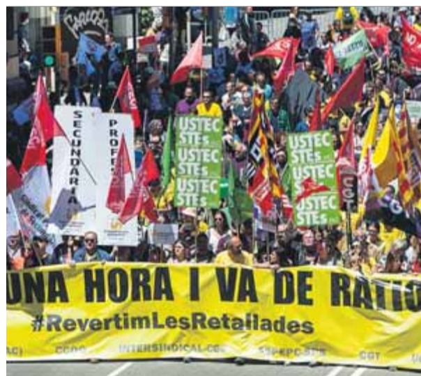
Reivindicacions en l'última vaga d'ensenyament