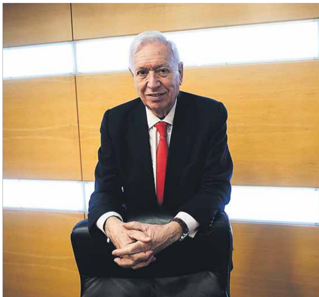
L'exministre José Manuel García-Margallo, ahir, abans de la presentació del seu llibre de memòries

L'error inicial és quan Maragall planteja una reforma de l'Estatut que ningú havia demanat.