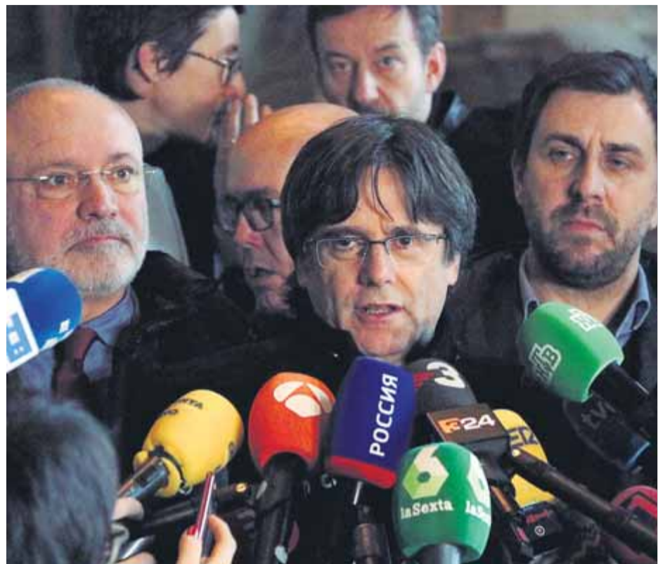
Puigdemont, Comín i Puig, el 16 de desembre després de comparèixer davant del jutge

El magistrat del Suprem Pablo Llarena va emetre aquesta petició junt amb la de Comín. Així, esperen que l'exconseller de Cultura també se'n pugui veure “beneficiat” si s'anul·la per a tots. En cas contrari, ja té programada una vista el 24 de febrer per tractar el seu cas. ■