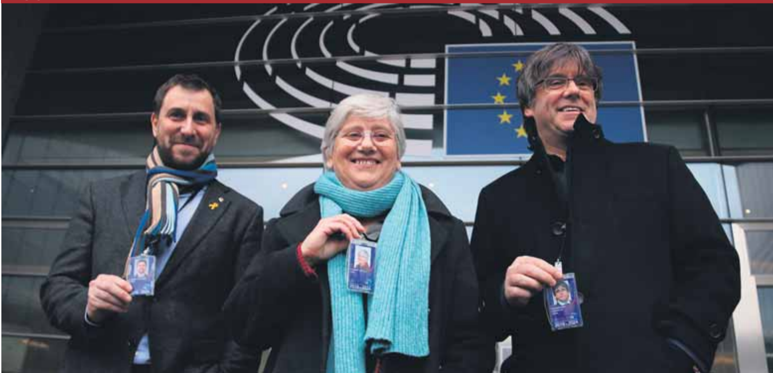
Toni Comín, Clara Ponsatí i Carles Puigdemont, ahir al matí davant de la seu del Parlament Europeu, a Brussel·les