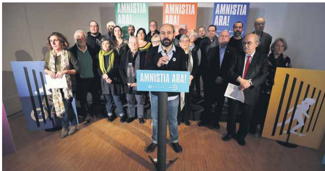
La presentació del manifest, amb la presència d'alguns dels signants, es va fer ahir al centre Arts Santa Mònica