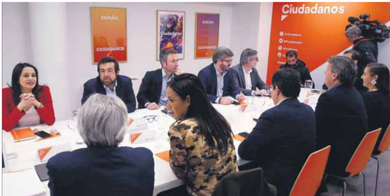
La portaveu al Congrés, Inés Arrimadas, a l'esquerra, durant la sessió de la gestora del partit, ahir, a Madrid

Els mals resultats –i els pitjors pronòstics– de Ciutadans a les urnes han fet que finalment cristal·litzi la possible unió amb altres forces polítiques. Tot i que de totes les maneres possibles des de Cs s'havia rebutjat la possibilitat plantejada fa temps pel PP d'unir forces en territoris com Catalunya, ara és el partit taronja qui ho promou. La gestora que dirigeix el partit després de la marxa d'Albert Rivera va beneir ahir la proposta d'Inés Arrimadas d'explorar vies d'entesa amb el PSOE i, sobretot, el PP per presentar-se junts a Catalunya, el País Basc i Galícia. L'explicació oficial és intentar frenar l'auge dels nacionalistes a tots tres llocs, però en el fons el que s'intenta és frenar la sangria de representació del partit, que en les últimes eleccions generals tan sols va obtenir deu diputats a