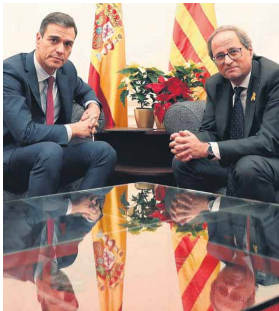
Sánchez i Torra, en la cimera de Pedralbes del desembre del 2018

Política Territorial, la canària Carolina Darias, que viatjarà amb Sánchez a Barcelona tot i que no entrarà a la reunió, veu la cita amb Torra al Palau com “una oportunitat per a l'entesa”. Qui entrava en contradicció amb la tesi de La Moncloa de no avançar el calendari de la mesa entre governs era José Luis Ábalos, ministre de Transports, que va apostar per posar-hi data avui perquè “l'important és que es posi