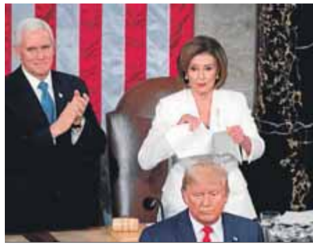
Pelosi esparraca el discurs de Trump

Fa un discurs de la nació triomfalista en un ambient de molta tensió amb l'oposició