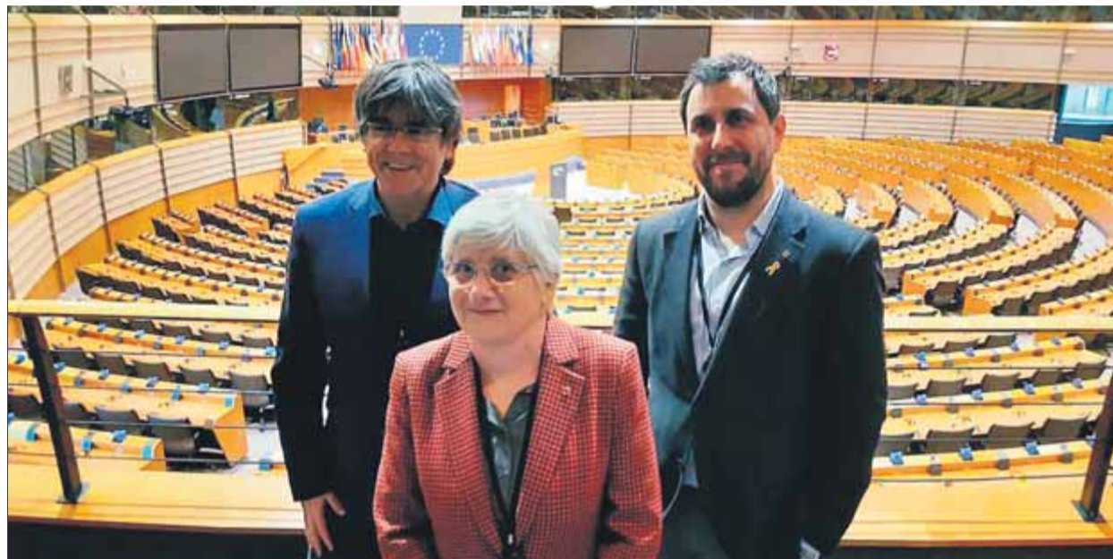
Els tres eurodiputats de JxCAT, Carles Puigdemont, Clara Ponsatí i Toni Comín, ahir al Parlament Europeu

Un cop recollida la desitjada acreditació blava, Ponsatí va comparèixer davant dels mitjans acompanyada dels seus companys i "molt contenta" de