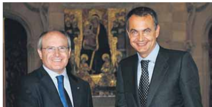
El 7 de maig del 2004 Maragall rebia el president Zapatero al Palau. Tres anys després ho faria Montilla