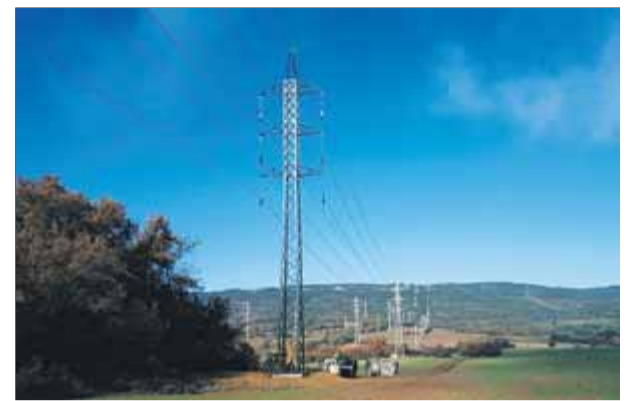
La nova xarxa dona servei a 16.000 clients ■ ENDESA