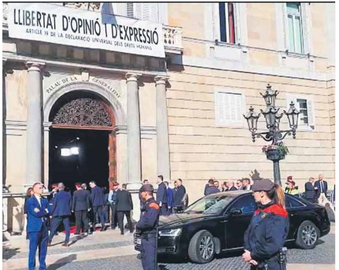
Els presidents Sánchez i Torra pujant l'escala noble del Palau de la Generalitat. Al costat, l'entrada del mandatari espanyol sota la pancarta