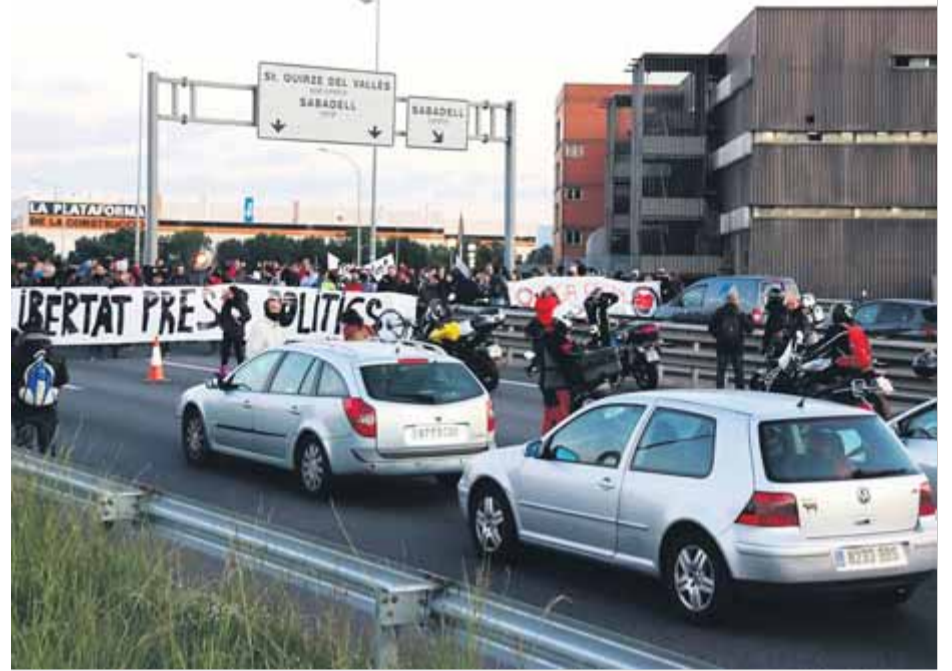
Tall de la C-58 a l'altura de Sabadell, durant la vaga general convocada per la Intersindical el 8 de novembre del 2017

tomba un altre aspecte del recurs de Foment del Treball, segons el qual el sindicat independentista convocant no tenia prou legitimitat perquè només ostentava una representació del 0,48% al territori. El Su-