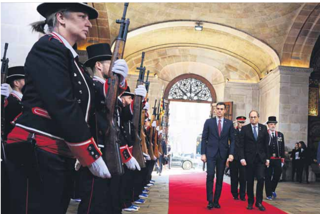
Torra i Sánchez entren al Palau de la Generalitat davant d'una formació de la guàrdia d'honor dels Mossos d'Esquadra

HONOR • Torra rep Sánchez al Palau amb honors de cap d'estat un any després de la Declaració de Pedralbes