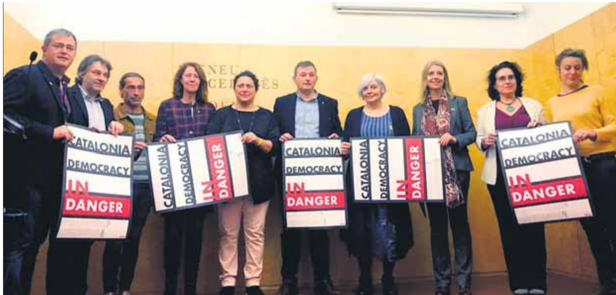
Els participants en la presentació que es va fer ahir al matí a Barcelona

Per aconseguir-ho, l'Associació de Municipis per la Independència i l'Assemblea de Càrrecs Electes han sumat esforços, i ahir van donar el tret de sortida a dues campanyes en paral·lel amb les quals es vol entrar en contacte amb altres regidors i alcaldes tant de la resta d'Espanya com de l'àmbit internacional per explicar-los, un cop més, la situació política que es viu a Catalunya i reclamar la seva presa de posició favorable a una solució que passa per