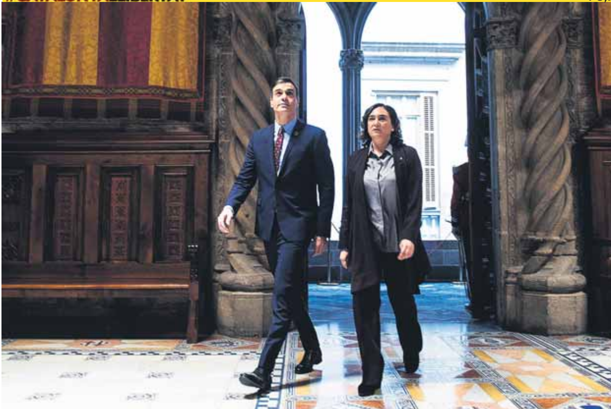
Pedro Sánchez mira el sostre del Saló de Cent, on entra acompanyat de l'alcaldesa, Ada Colau