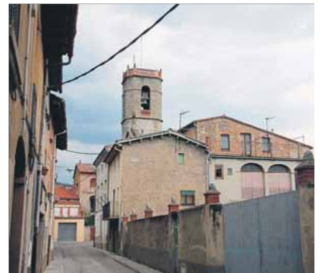
Una vista de Montesquiu en una imatge d'arxiu