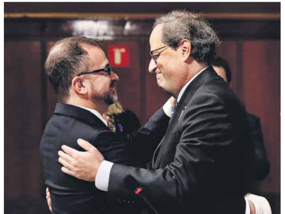
Quim Torra i Alfred Bosch, durant la presa de possessió del conseller, el 2018

■ El president i el conseller Bosch discrepen en públic sobre la urgència de convocar la comissió bilateral Generalitat-Estat