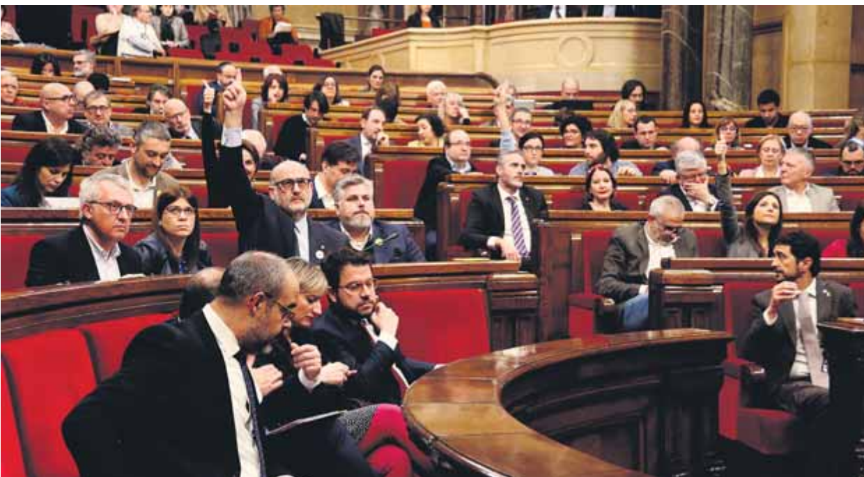
Una imatge dels diputats i membres del govern durant les votacions del ple del Parlament sobre corrupció