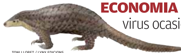
TONI LLOBET / LYNX EDICIONS

ORIGEN • Científics apunten al pangolí com a pont de la malaltia