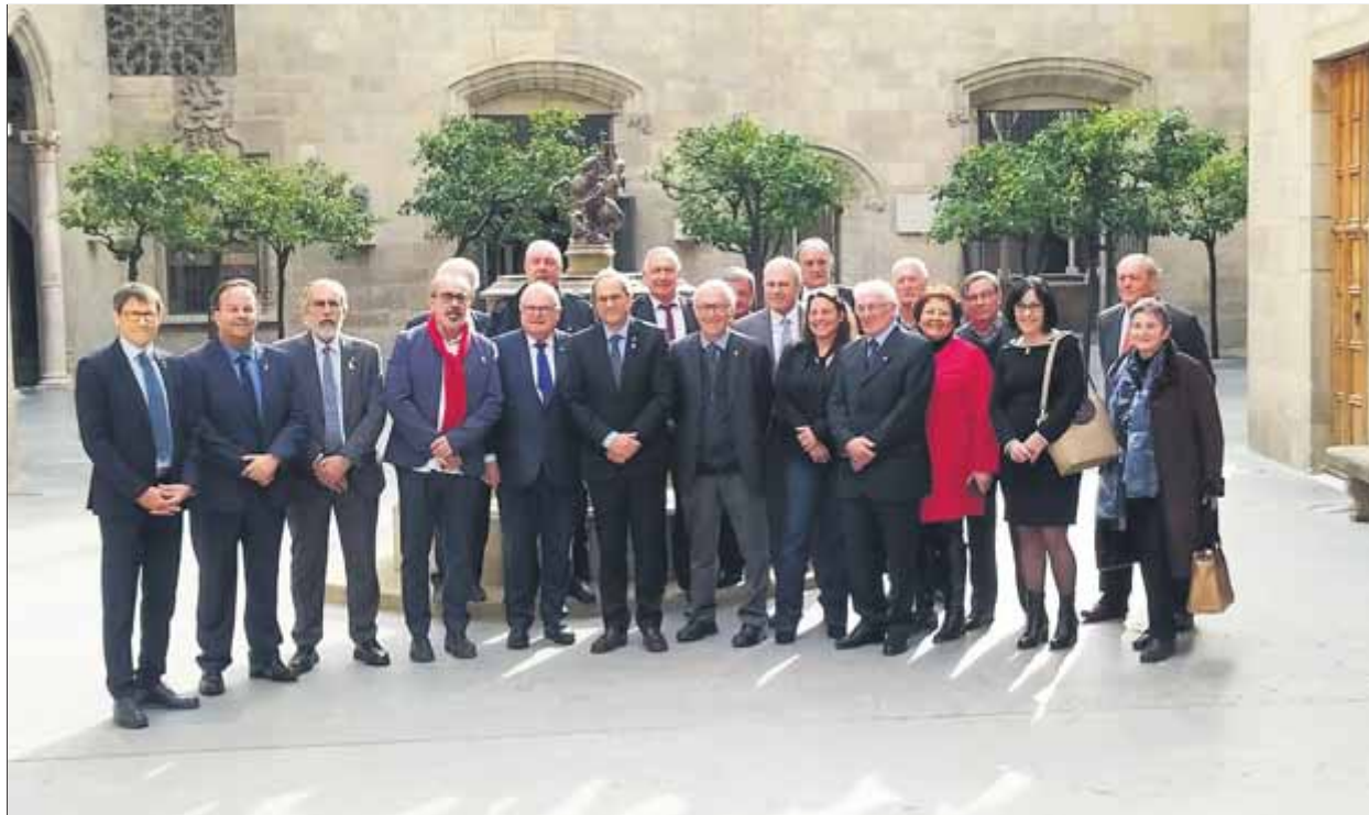
El president Torra amb la delegació d'electes de la Catalunya del Nord, ahir al pati dels Tarongers de la Generalitat

Torra va assegurar que l'aprovació de la moció a la cambra "ara és d'obligat compliment per a nosaltres" i, per aquest motiu, va anunciar que la setmana vinent convocarà la taula d'entitats i partits independentistes una altra ve-