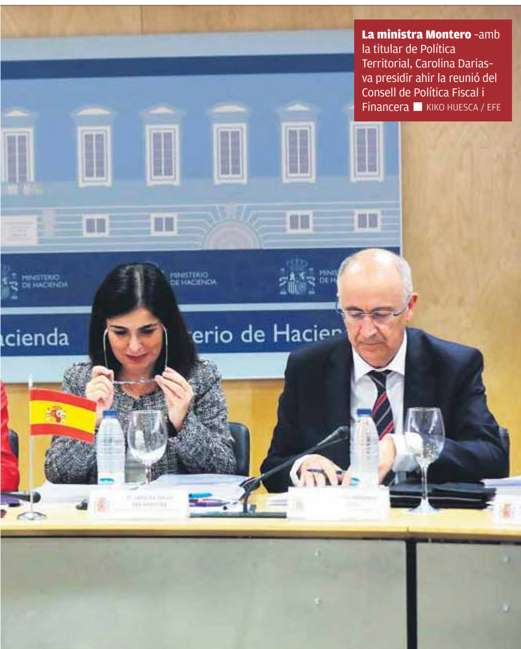
La ministra Montero -amb la titular de Política Territorial, Carolina Darias- va presidir ahir la reunió del Consell de Política Fiscal i Financera

hi ha qüestions de fons en incompliments d'ingressos i alguns venen de llarg, en l'àmbit de la dependència, en el desplegament dels Mossos i en la disposició addicional tercera, i el que exigim és que s'acabin aquests incompliments", va reivindicar Mas.