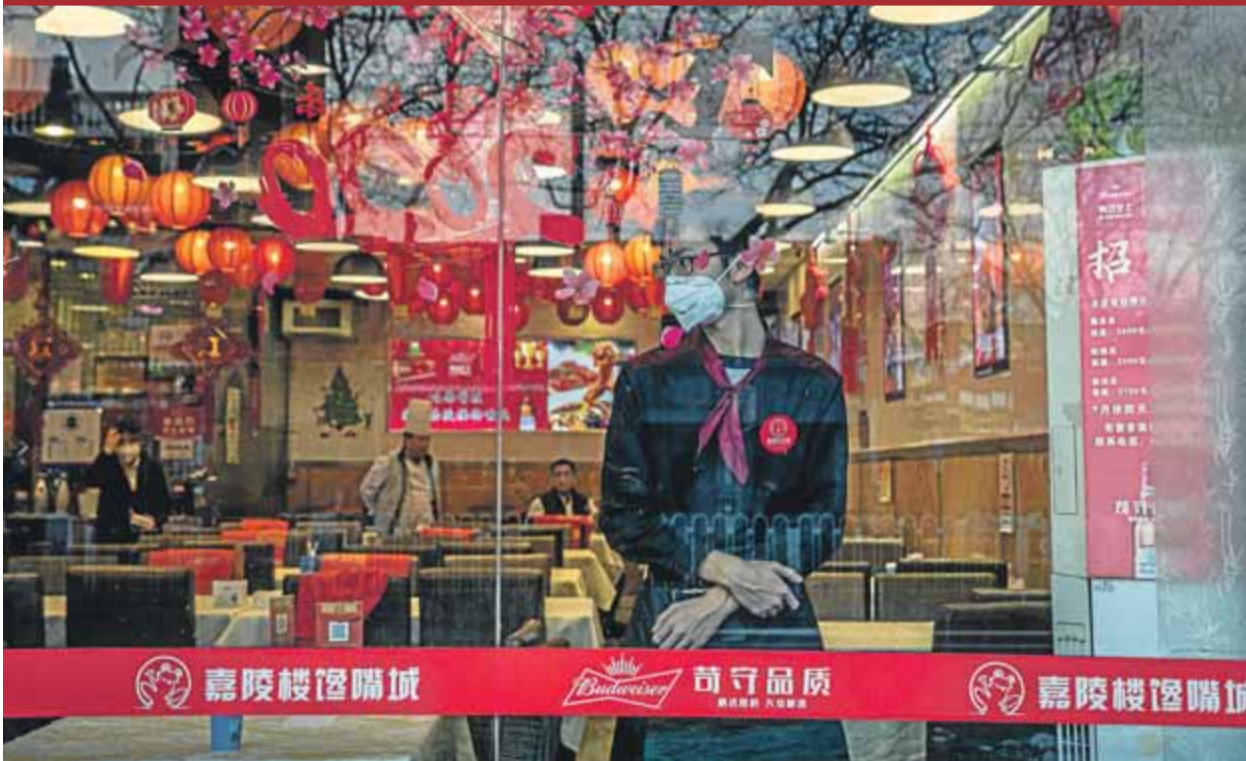
El cambrer i els cuiners d'un restaurant de Pequín totalment buit de clients per evitar contagis pel coronavirus