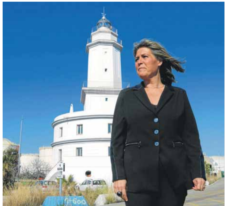
La presidenta de la Diputació de Barcelona, amb el far del Llobregat el 6 de febrer