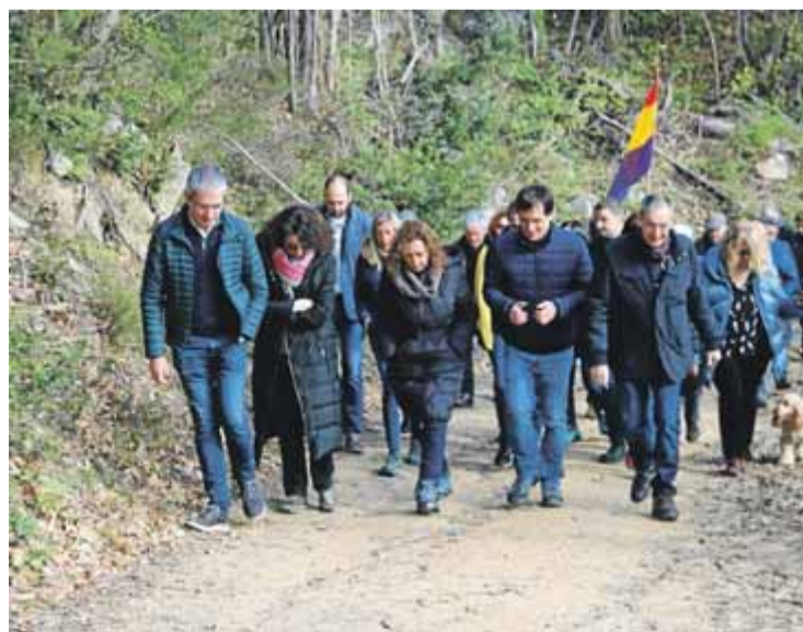
La consellera de Justícia i altres membres de la comitiva, ahir, durant l'homenatge als exiliats i deportats de la Guerra Civil