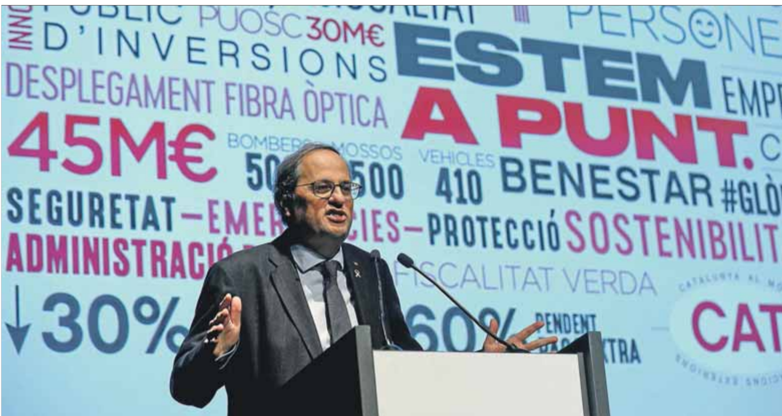
El president Torra, ahir, al Born, en l'arrencada de la campanya de Junts per Catalunya amb el lema 'Estem a punt'