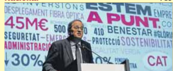
Quim Torra en el míting de JxCat al Born ■ J. RAMOS

L'epidèmia suma 700 morts mentre el líder Xi Jinping continua absent