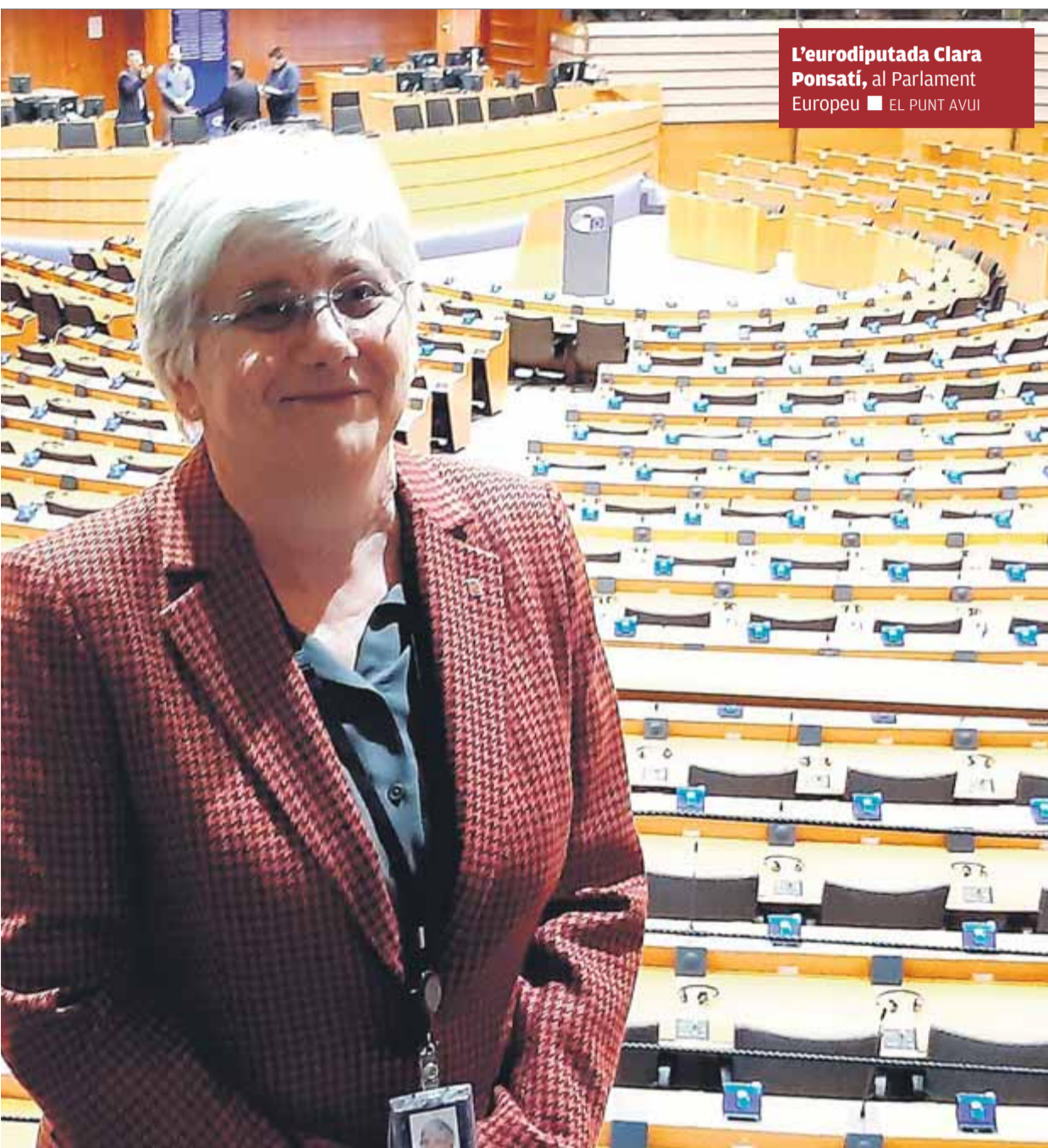
L'eurodiputada Clara Ponsatí, al Parlament Europeu