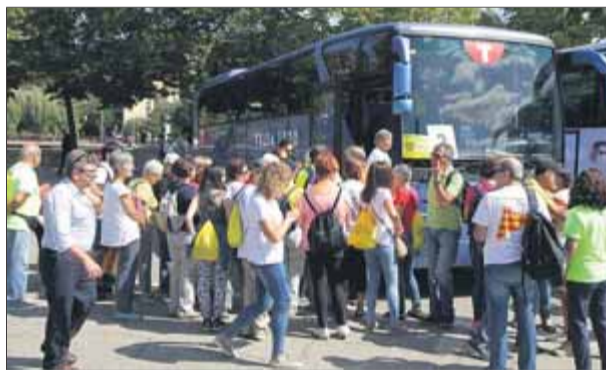
Un grup de participants en la Diada del 2017, amb els autocars que es van organitzar des de Girona

Quan encara falten dues setmanes per a l'acte que el Consell per la República celebrarà a Perpinyà sota el títol La República, al centre (del món) , unes 200 assemblees territorials de l'ANC ja han omplert més de 400 autocars per desplaçar-se el dia 29 de febrer a la Catalunya del Nord. Segons l'entitat, el ritme d'inscrits continua creixent dia a dia i, per fer