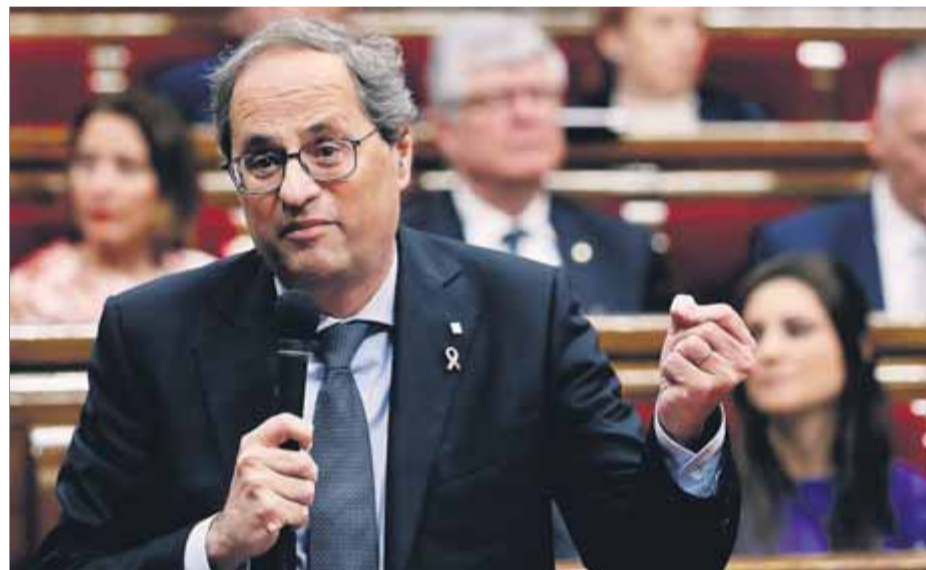
El president de la Generalitat, dimecres durant la sessió de control

En qualsevol cas, el fiscal, Pedro J. Ariche, sosté que la situació denunciada pel PP “no té res a veure” amb un delictes d'usurpació de funcions, que “es reserva per a qui, sent aliè a la funció pública, se l'atribueix falsament per obte-