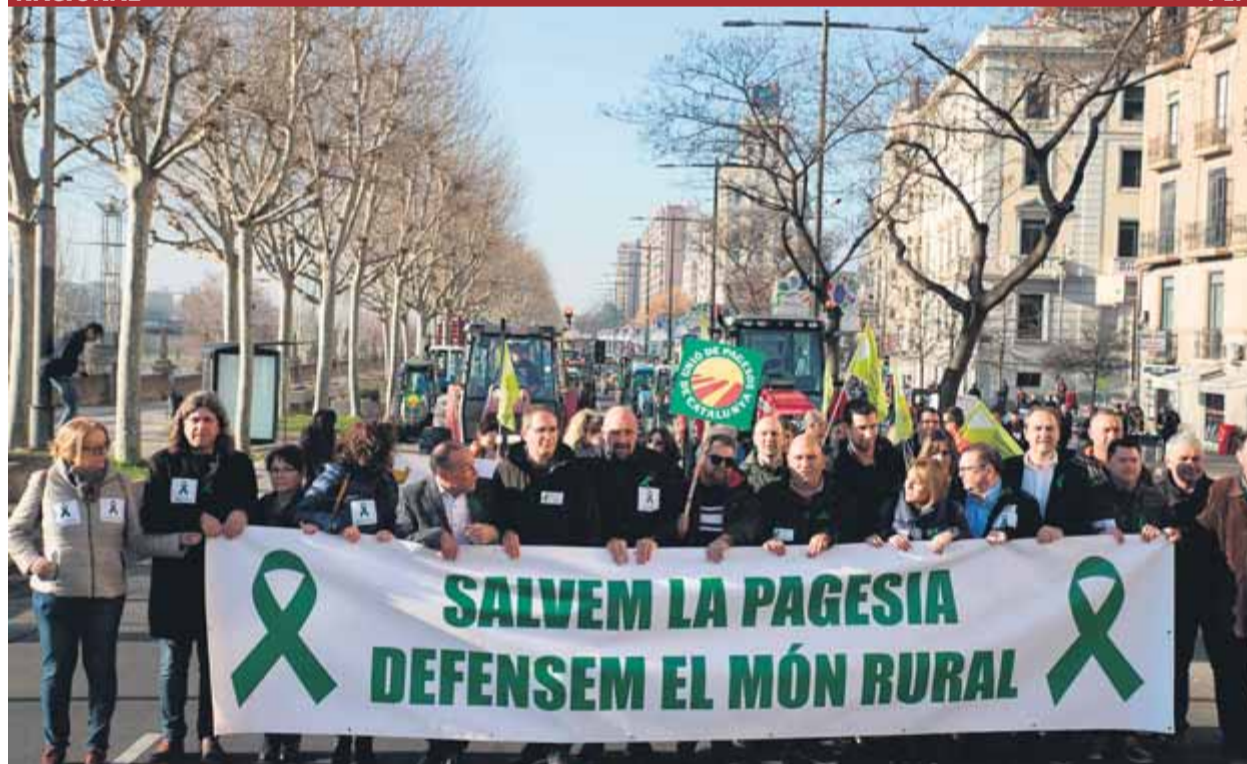
La capçalera de la marxa d'ahir a Lleida, en què van participar centenars de tractors

TEMPS • El temporal fa aparèixer restes de tres persones desaparegudes fa temps i el cos d'un home assassinat ESPERA • La identificació dels cossos podria trigar vuit mesos, pendent de les proves d'ADN