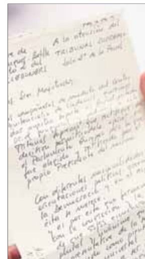
Part de la carta que els presos han tramès

cràcia; és per això que signem tots amb la convicció i l'esperança que escoltaran aquesta veu plural i unànime que considerem representativa de la societat que, pensi com pensi, creu en el sufragi universal i en el dret del poble a ser representat", conclou el manifest, que ha estat tramès a l'ACN. ■