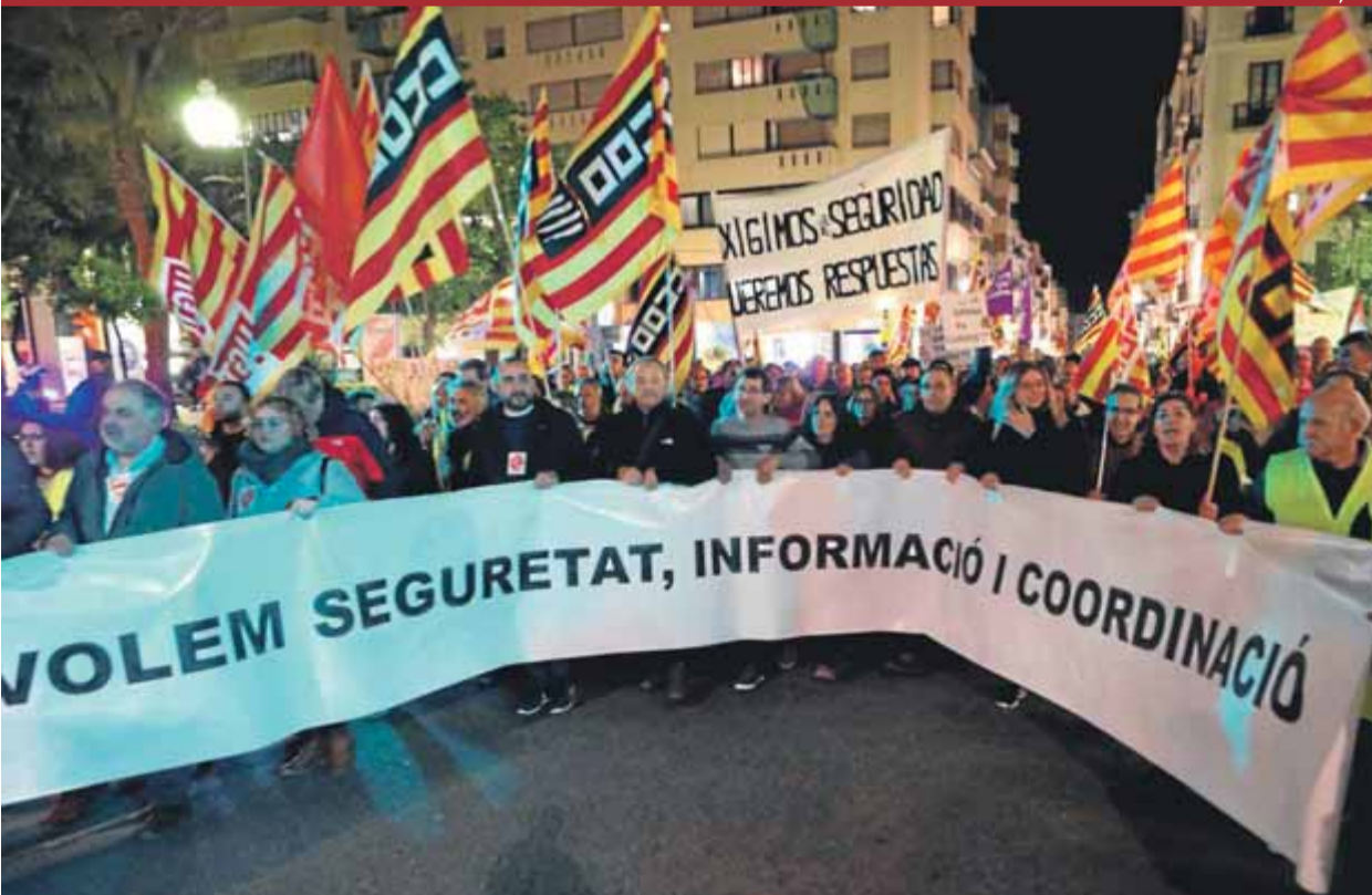
Unes tres mil persones van sortir al carrer ahir al vespre a Tarragona