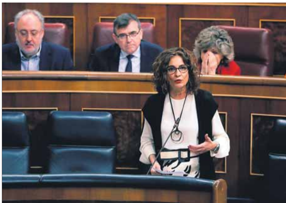
La ministra María Jesús Montero, ahir al Congrés, en el control al govern

Malgrat coincidir en la tria del front econòmic per fiscalitzar el govern de Sánchez, el to del republicà Joan Capdevila amb la ministra Maroto i el de Ferran Bel (JxCat) amb Montero diferien. Capdevila, en aquest cas en el torn a la sessió de control, va fer notar a la titular d'Indústria que el termini actual de pagament de 169 dies que tenen les firmes de l'Íbex amb les pimes –el límit legal és de 60 dies– ofega les empreses no cotitzades i la morosi-