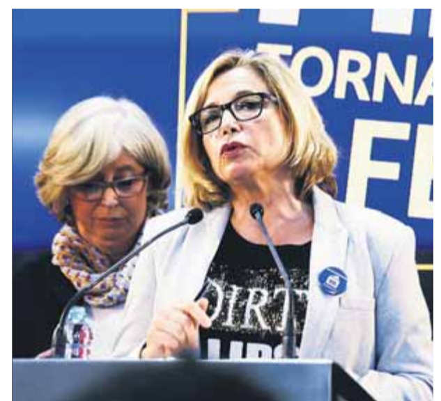
Joana Ortega, en saber la condemna del 9-N, el 2017

En l'interrogatori, la vicepresidenta també va haver de donar compte que l'octubre passat va ser elegida secretària general de l'Associació Catalana de Municipis (ACM), càrrec que la fiscalia també man-