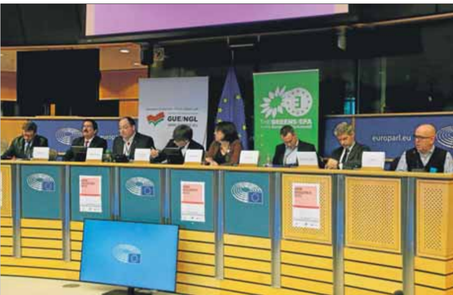
Carles Puigdemont, ahir, en un acte a l'eurocambra amb un grup d'advocats