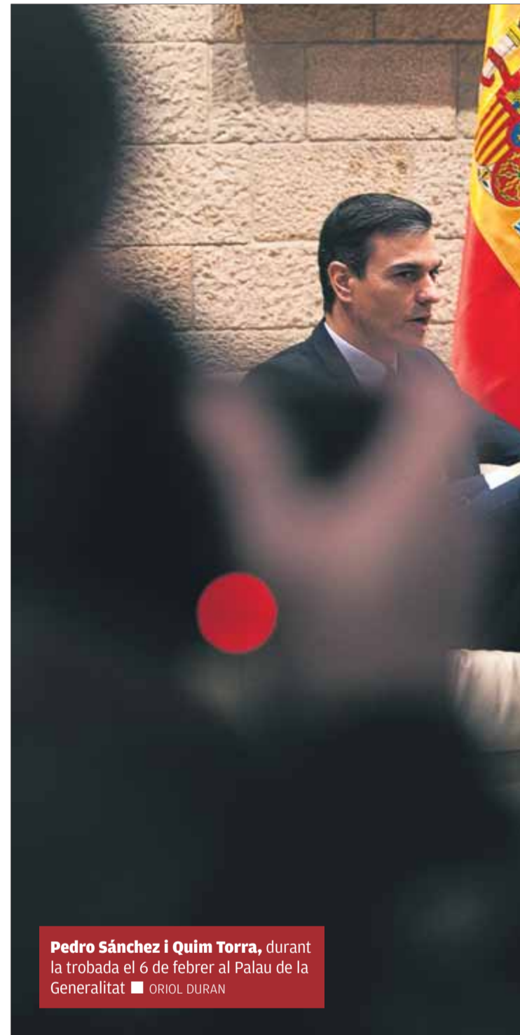
Pedro Sánchez i Quim Torra, durant la trobada el 6 de febrer al Palau de la Generalitat

Els únics dies que apareixien buits en l'agenda de Pedro Sánchez eren el dilluns 24 i el dijous 27, ja que els dimarts es fa ara el Consell de Ministres i dimecres hi ha sessió de control i ple al Congrés i avui el president espanyol viatja a Brussel·les per assistir al Consell Europeu extraordinari. ERC també ha tingut molt present la data del míting de Puigdemont a Perpinyà i entenien que la data del 24 li anava bé a Torra i a JxCat, tot i els escarafalls en públic, perquè necessitaria un cert esponjament del calendari entre una cita que busca explorar la via del pragmatisme institucional i un míting ple d'emotivitat amb Puigdemont trepitjant territori català i enarborant el legitimisme