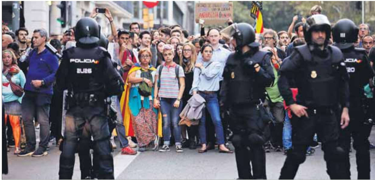
Concentració a la plaça Urquinaona de Barcelona, contra la sentència del Suprem, l'octubre passat

Les mobilitzacions van ser convocades a través de