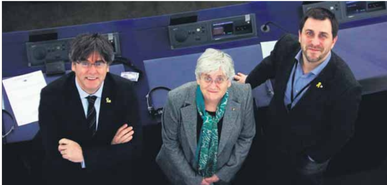
Els eurodiputats Carles Puigdemont, Clara Ponsatí i Toni Comín, firmants de la carta, en una imatge d'arxiu