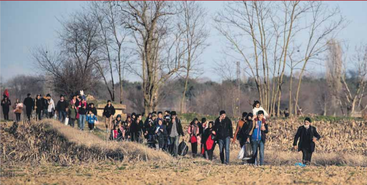
Un grup de refugiats sirians caminen enmig dels camps prop de la ciutat turca d'Edirne, a tocar de la frontera grega