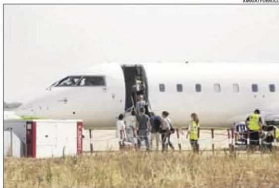
Passatgers embarcant en un vol d'Air Nostrum a Alguaire.

dels turistes de Mallorca que vulguin visitar Lleida. A partir d'ara els vols des de Palma amb destinació a Alguaire s'enlairaran els divendres a les 13.50