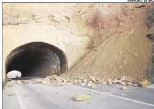
Imatge del desprendiment al túnel de l'N-II que dona accés a Fraga i, a la dreta, l'esllavissada de les Valls de Valira.