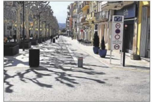
Imatge d'arxiu de les pilones de la rambla Doctor Pearson.