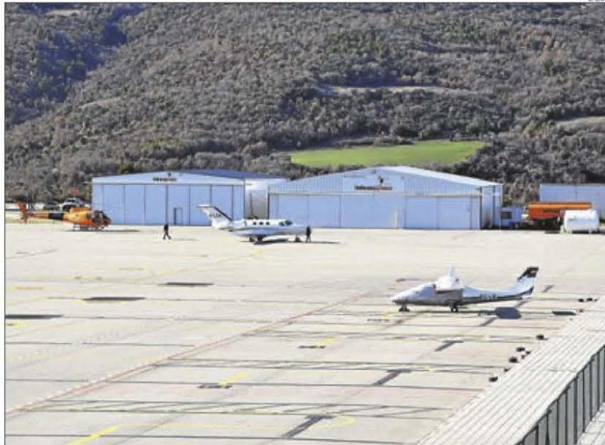
Amb aquest sistema s'espera incrementar entre un 10 i un 15% els dies de l'any operables des de la Seu.