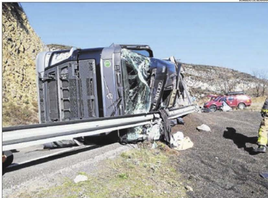
Imatge del camió que va bolcar ahir a l'N-230 al seu pas pel pantà d'Escales.