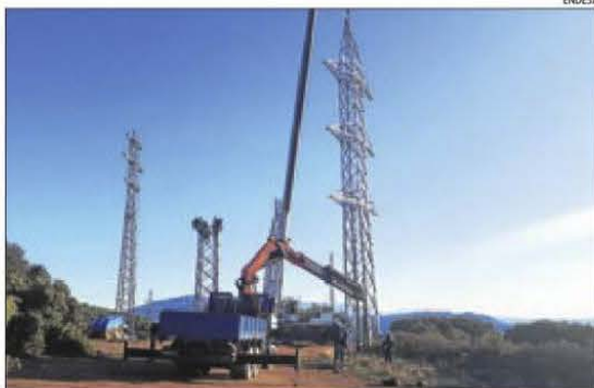
Els operaris treballen en el desmuntatge d'antigues torres.

L'origen de la línia era a la central de la Torre de Capdella i estava destinada a la central tèrmica de Sant Adrià de Besòs. Avui està previst, amb l'ajuda d'una gran grua, el des-