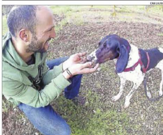
El centre ja ha format més de vint ensinistradors en dos anys.