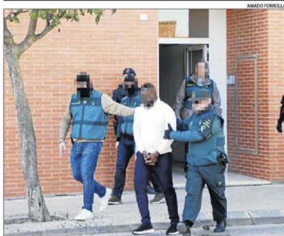
Imatge d'un dels detinguts a Torrefarrera.