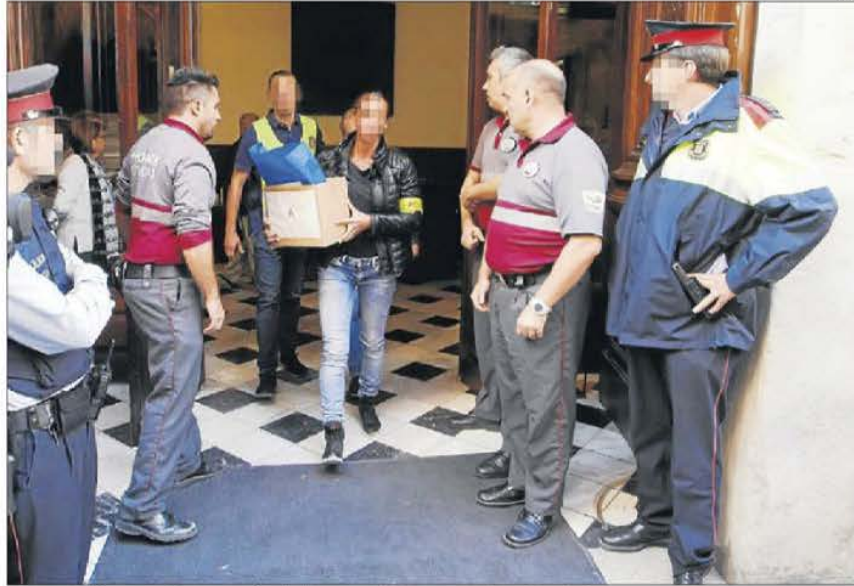
Imatge de l'escorcoll que van fer els Mossos a la Diputació l'octubre del 2018.

Considera que no hi ha cap indici de prevaricació i malversació, en una peça separada del 'cas Boreas' || Va declarar com a investigat el juliol de l'any passat