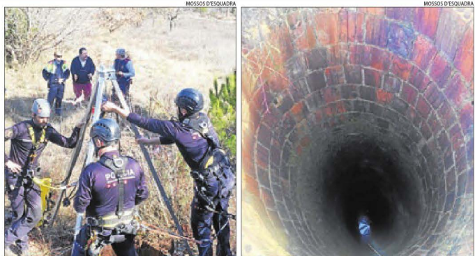
Els especialistes dels Mossos van inspeccionar el pou abans de segellar-lo.