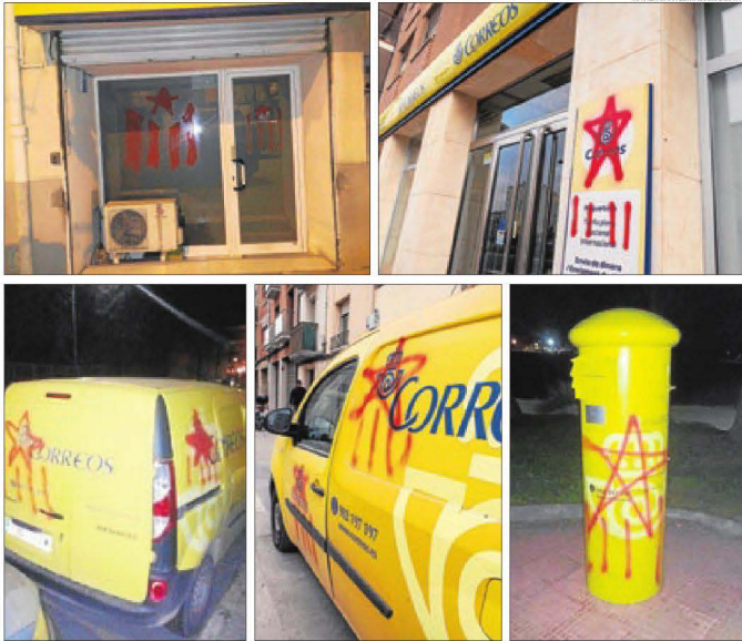
Oficines de Juneda i Cervera, furgonetes de Lleida i Guissona i bústia de Bellpuig.

LLEIDA | Les oficines i altres elements de Correus en set localitats de Lleida van patir ahir a la matinada actes vandàlics que va reivindicar un grup independentista anomenat L'Estaca, que el mes de desembre passat ja va fer una altra acció similar amb vint-i-cinc radars de les comarques de Lleida. Aquest grup va publicar ahir un missatge a Telegram amb les imatges de l'acció que va portar a terme a Balaguer, Bellpuig, les Borges Blanques, Cervera, Guissona, Juneda i Lleida amb el missatge "Aquesta matinada la companyia estatal Grupo Correos ha repartit cartes per la Independència arreu de Catalunya. N'hem llegit una. Diu: Malgrat tot, avancem!! Independència!! Salut i República @L'Estaca." Concretament van pintar estelades a les oficines, furgonetes de repartiment i bústies. A Bell-