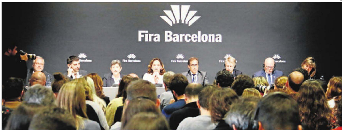
Autoritats durant la roda de premsa d’ahir per explicar els motius de la cancel·lació de la catorzena edició del Mobile World Congress de Barcelona.

Conjura entre organitzadors, Govern, Generalitat i els ajuntaments de Barcelona i l’Hospitalet per celebrar el congrés l’any que ve || GSMA atribueix la cancel·lació a una “força major”