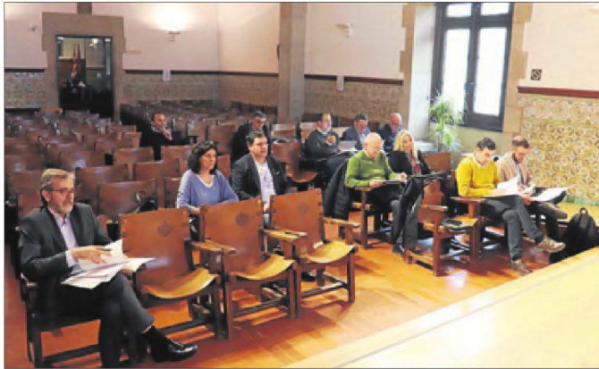
L'Aula Magna de l'Institut d'Estudis Ilerdencs va acollir ahir la junta rectora de la institució cultural.

L'augment més important en el pressupost, un 51,33 per cent, es dona en l'apartat de transferències corrents, que se situa en 2.820.000 d'euros, per dotar amb el màxim de recursos els ens locals i també les entitats. La remuneració del personal presenta un increment del 9,61 per cent, per poder cobrir diferents places. La partida de despeses corrents també creix (7,22 per cent) i se situa en 1.229.200