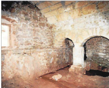
L'interior d'una de les sales de les adoberies de Trep.