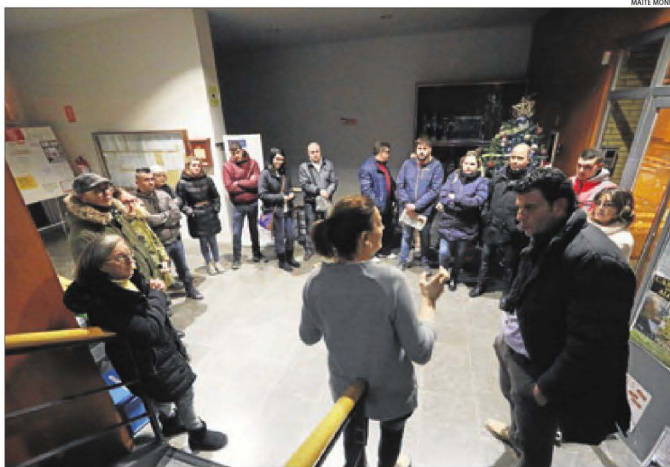
Les famílies del bloc d'Alcoletge el dia que es van reunir amb la Generalitat, a finals de desembre.