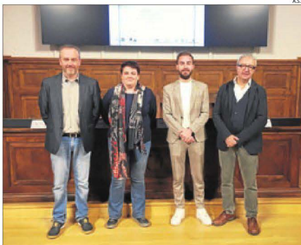
El concert 'Glòria' de Vivaldi es va presentar ahir a l'IEI.

LLEIDA | L'Orquestra simfònica Victòria dels Àngels i l'Orfeo Lleidatà portaran el concert Glòria de Vivaldi, una de les obres més reconegudes del compositor venecià, per tota la província de Lleida. L'espectacle, dirigit pel lleidatà Pedro Pardo, farà la primera parada d'aquesta gira de quatre concerts al convent de Sant Domènec de Balaguer el 28 de març (19.00 h); continuarà a la sala Sant Domènec de la Seu d'Urgell el 29 de març (18.00 h); seguirà a l'església Verge de la Ribera de la Pobla de Segur el 4 d'abril (18.00 h), i s'acomiadarà a la Seu Vella de Lleida el