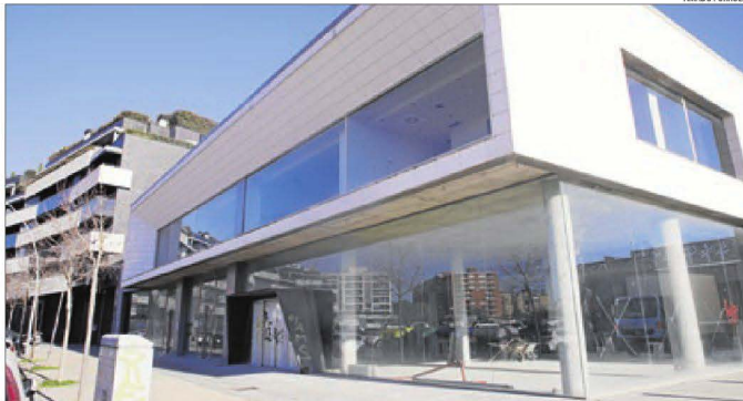
Immoble en el qual s'instal·larà el 2021 l'oficina de l'atur de Lleida, al carrer Pere de Cabrera.

En paral·lel, el SOC també ha adjudicat recentment els contractes de lloguer de les seues