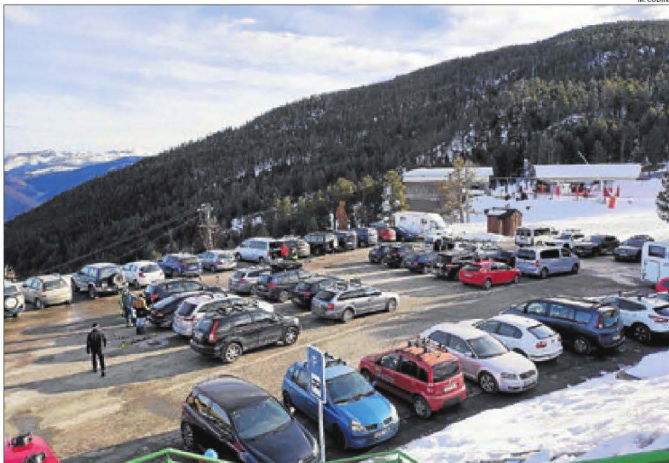
Imatge del pàrquing de l'estació d'esquí de Port Ainé el mes de novembre passat.