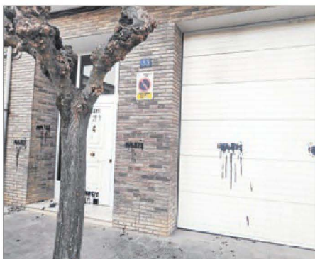
Imatge de la façana de l'habitatge de Pilar Cases a Trepmp.

La comissió va examinar també projectes per a granges i construccions agrícoles a l'Alt Urgell i els Pallars.