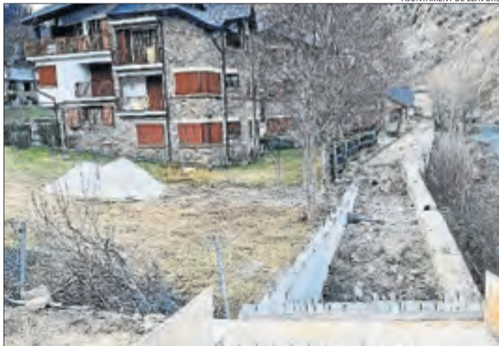
AJUNTAMENT DE LLAVORSÍ

En l'actualitat, el passeig Vora Riu presenta una discontinuïtat en el recorregut. S'inicia a l'encreuament entre el riu Noguera de Cardós i la Noguera Pallaresa, segueix aigües amunt pel marge dret i es talla quan arriba a la zona d'un parc infantil. Els terrenys