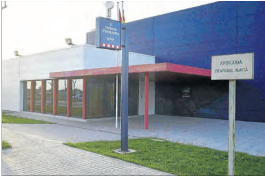
Vista de la comissaria dels Mossos d'Esquadra a Cervera, que investiga els fets.

La víctima es va enfrontar a l'assaltant mentre la nena va poder sortir del cotxe i refugiar-se en una botiga