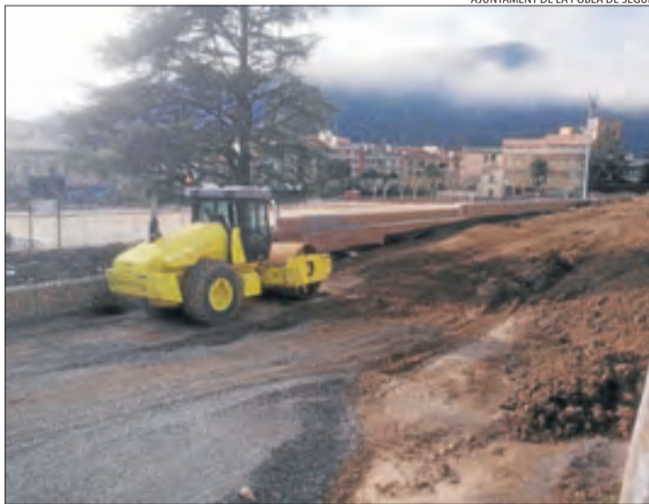
AJUNTAMENT DE LA POBLA DE SEGUR

Baró va explicar que l'ordenança preveu també sancions i treballs a la comunitat. "Més que la sanció o la multa, busquem responsabilitat, tant dels joves com dels pares", va dir. Segons el primer edil, "els pares també són responsables dels actes dels seus fills, i per això, la sanció econòmica entenem que recaurà en els pares, però els treballs a la comunitat als fills". Les xarrades a