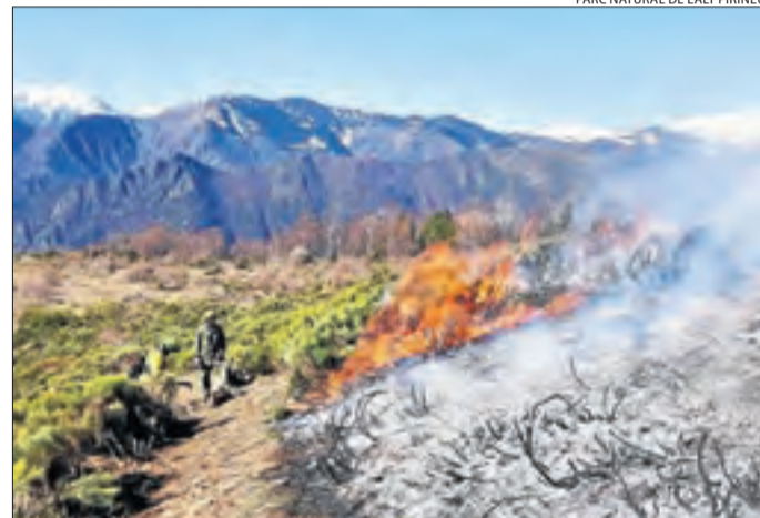
PARC NATURAL DE L'ALT PIRINEU

Els treballs d'aquesta setmana a càrrec dels Agents Rurals.