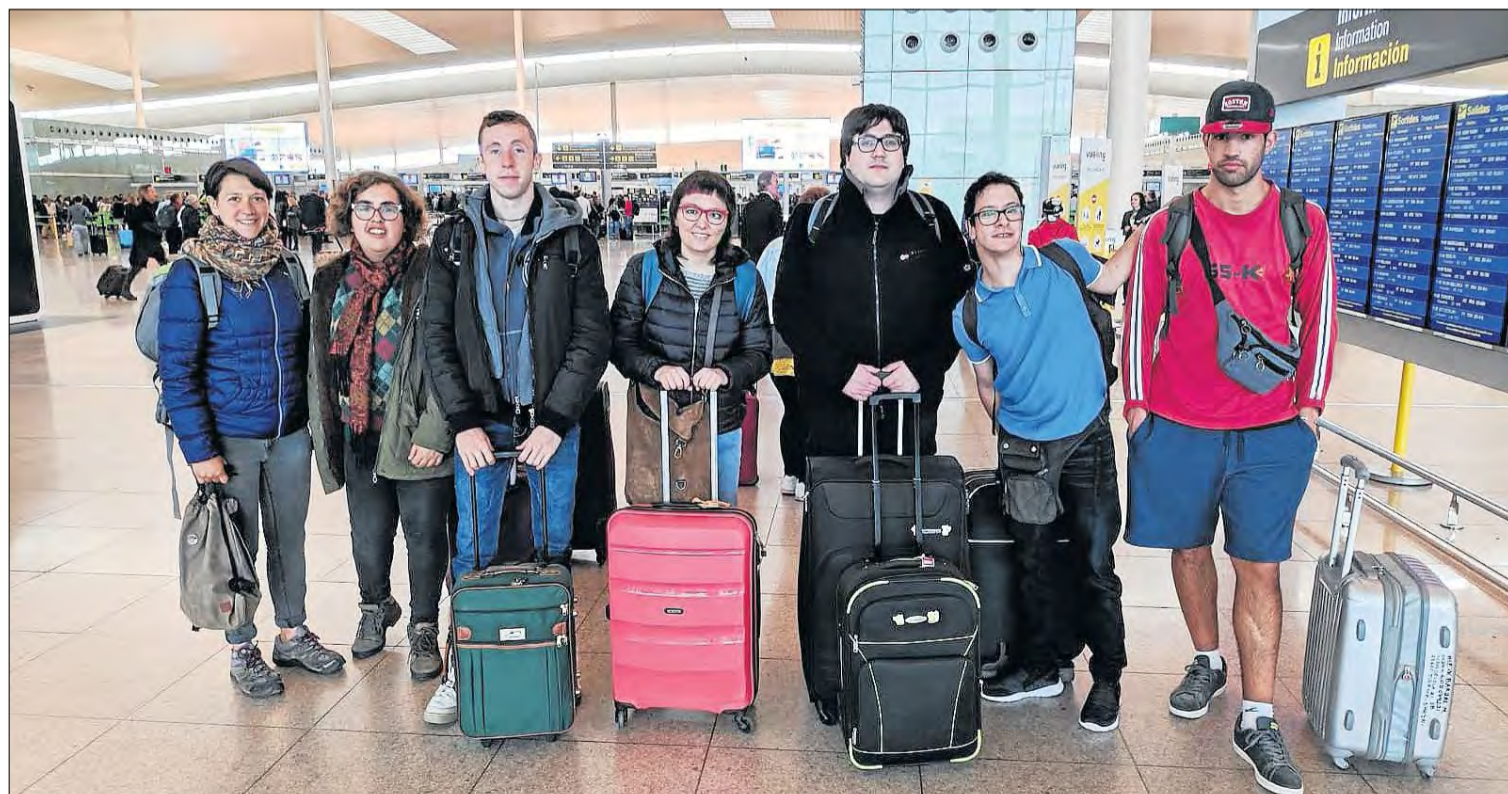
L'any passat aquest grup de joves de Tremp, Tàrrrega, Lleida i Barcelona va viatjar a Wernigerode (Alemanya).

L'any passat, dels 28 participants del programa, 24 van trobar feina al cap de poc de tornar