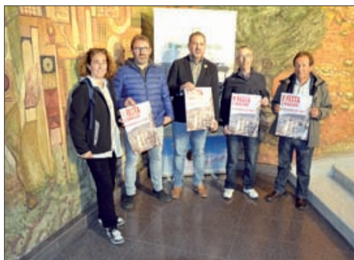
FOTO: La festa es va presentar ahir a la Diputació de Lleida

conservació dels hàbitats i del paisatge. Així, per exemple, s'ha adaptat la nova xarxa de camins a la ja existent, s'ha establert una franja ambiental a banda i banda dels camins, el tall de les finques s'ha fet coincidir -en la mesura del possible- amb els límits amb marges existents o camins, els drenatges existents s'han mantingut oberts, i els trams nous creats també són oberts.