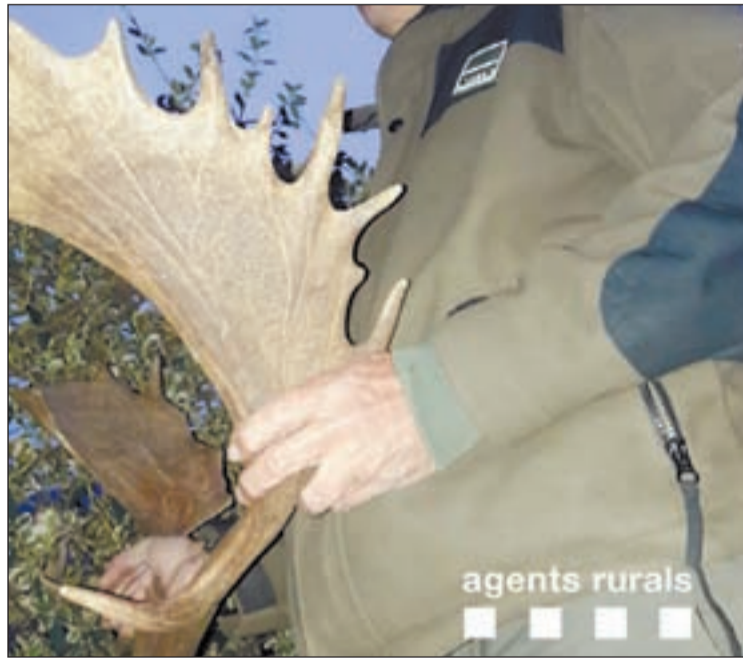
Imatge de la cornamenta d'un dels exemplars abatuts