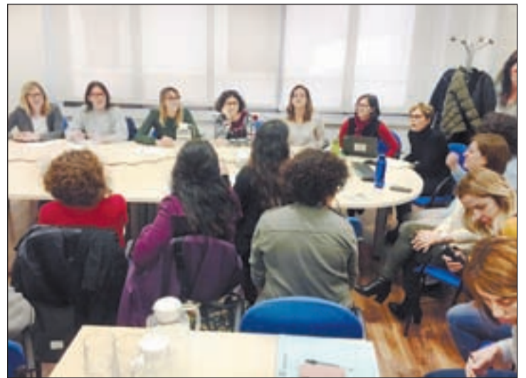
Moment de la presentació a l'Alt Pirineu i Aran

ça i tampoc les zones de seguretat, ja que els trets es van fer des de vies de comunicació i en llocs propers a nuclis urbans i cases aïllades.