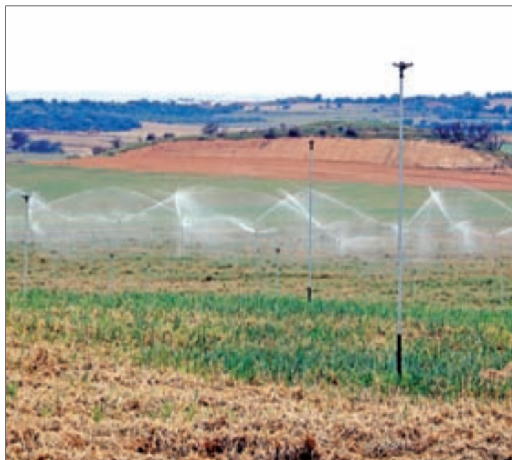
Una finca que ja rega del Canal Algerri-Balaguer

Les actuacions incloses en aquesta fase de concentració que ara s'inicia, bàsicament l'execució de camins i de mesures correctores de l'impacte ambiental, començaran de manera efectiva aquest mes de març i es preveu que finalitzin al desembre, segons Agricultura. Prèviament, s'han dut a terme treballs de geo-