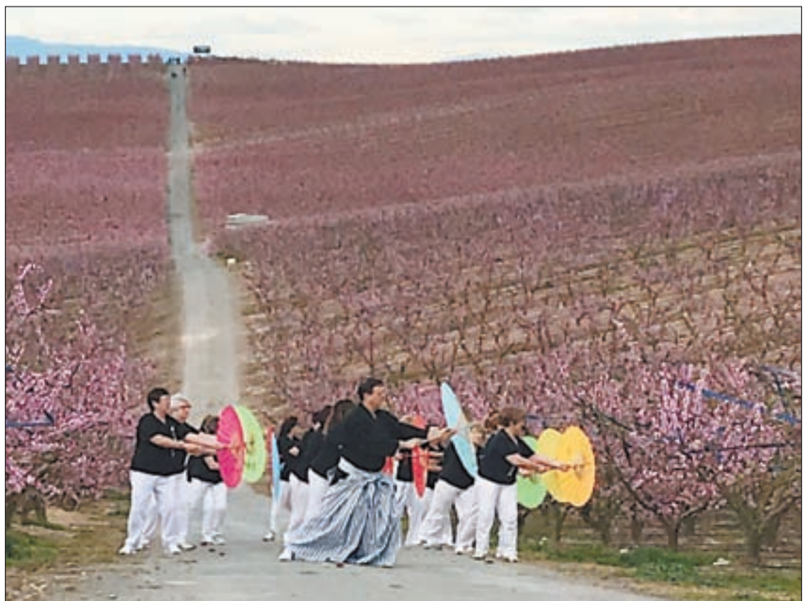
Un grup de visitants aquest cap de setmana als camps florits d'Aitona

20.000 visitants de l'any passat. Entre les diferents propostes que han gaudit els milers de visitants que s'han desplaçat a Aitona durant els darrers dies hi havia una original 'Hanami Bridal Party' pròpia del Japó. A aquesta activitat s'hi sumat, a més, la celebració de la IX Caminada Popular d'Aitona.