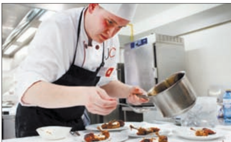
Uno de los concursantes, ayer en la Escola d'Hoteleria i Turisme