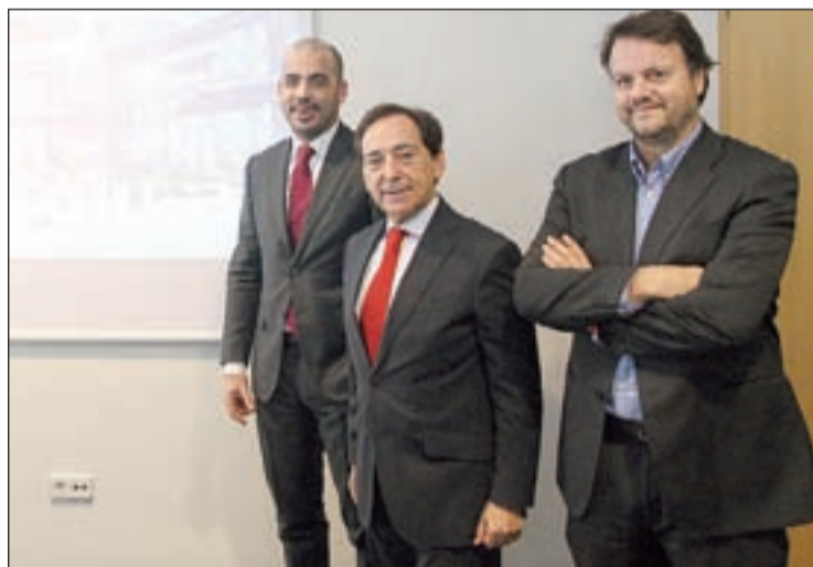
Eurofund presentó Go Lleida el 25 de noviembre

Projecte Lleida dijo que se trata de "una situación jurídica similar" al proyecto de parque comercial y de ocio de Torre Salses, donde la Paeria sí aprobó la modificación puntual del plan parcial de Torre Salses, sector SUR 42, el 5 de octubre de 2019, dos meses antes que Eurofund adquiriera las parcelas el 12 de diciembre