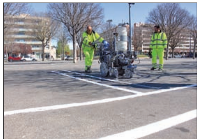
Tareas de repintado de las líneas del Mercat

Los operarios continuaron ayer los trabajos de repintado de las líneas que delimitan los puestos del Mercat del Barris Nord, una tarea que se ha demorado a causa de las condiciones climáticas adversas de los últimos días. Mientras duren las obras encargadas por la Paeria, el aparcamiento gratuito en la zona continuará cerrado.