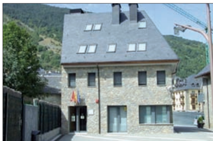
Imatge de la façana dels jutjats de Vielha, a la Val d'Aran

l'oficina de Tremp, ja en seran 18 a tot Catalunya Per fer front a aquest canvi, el Jutjat de Vielha incorpora un nou funcionari del cos de tramitació processal per tal de repartir millor la feina dels jutjats. En total, treballaran al Jutjat de Vielha 8 funcionaris, dependents del Departament de Justícia: tres funcionaris de gestió (un d'ells, al Registre Civil); tres de tramitació, i dos auxiliars judicials. El Jutjat compta amb una jutgessa i una lletrada que depenen del Consell General del Poder Judicial (CGPJ) i del Ministeri de Justícia, respectivament.