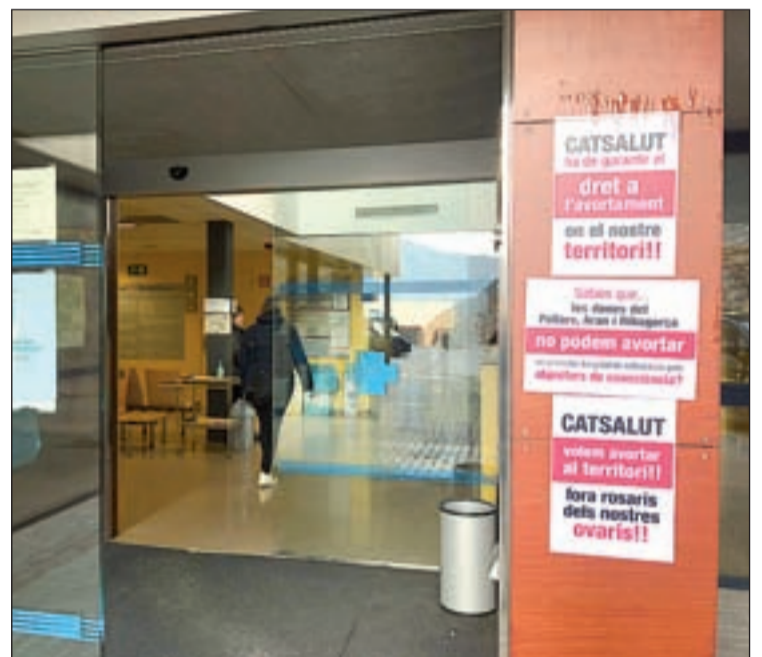
FOTO: ACN/ Imatge dels cartells que empegats a l'Hospital del Pallars

Les dones pallareses que formen part del col·lectiu que ha