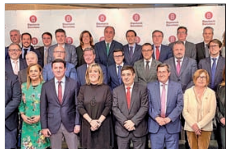
Ho va dir a la reunió de Diputacions, Cabildos i Consells