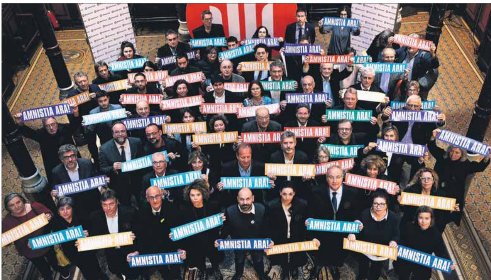
Advocats, amb el vicepresident d'Òmnium, ahir després de la lectura del manifest, al Col·legi d'Advocats de Barcelona