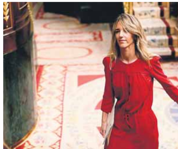
Cayetana Álvarez de Toledo ha registrat com a portaveu del PP al Congrés el rescat del Codi Penal d'Aznar

Que el resultat electoral i la dependència d'ERC per a la investidura ha fet que Sánchez oblidí la promesa és obvi, però Cayetana Álvarez de Toledo vol burxar el PSOE amb la