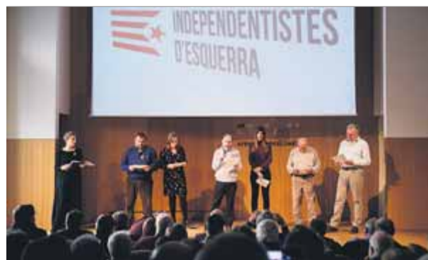
El nou col·lectiu es va presentar al febrer a Barcelona ■ O.D.

nova legalitat republicana, i que impulsi la formació d'un Bloc Republicà d'Alliberament Nacional, un ens permanent que treballi per la unitat estratègica i la consecució de la independència. Aquests són els trets principals de l'esborrany de ponència política que la plataforma va penjar ahir al seu web, junt