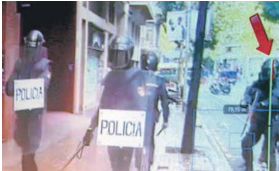
Agents de la policia espanyola, al carrer Sardenya, l'1-0 del 2017