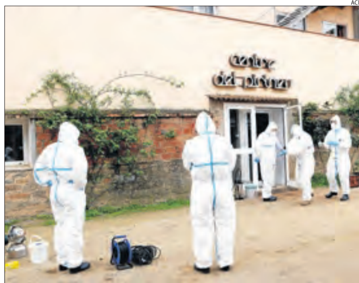
L'Exèrcit va desinfectar aquesta residència de la Pobla al març.

19 residències a Catalunya i 86 a tot l'Estat