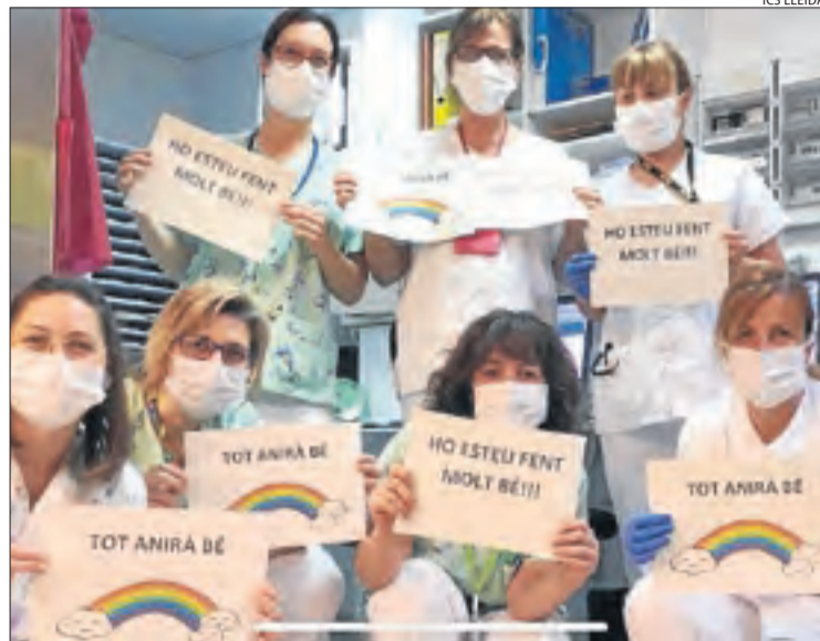
Foto de família de personal sanitari de Lleida.

Malgrat el trist balanç d'ahir, el nombre d'infeccions greus pel coronavirus va a la baixa des de fa uns dies i els hospitals tenen menys pressió assistencial després d'haver suportat el pic d'ingressos entre finals de març i principis d'abril. Tot i que la nova estadística de Salut no ofereix les dades concretes d'hospitalitzats en cada centre i a les UCI, el nombre de paci-