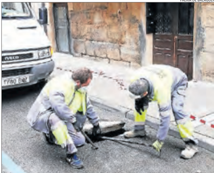
Tècnics abans d'inspeccionar la séquia al carrer Miracle.