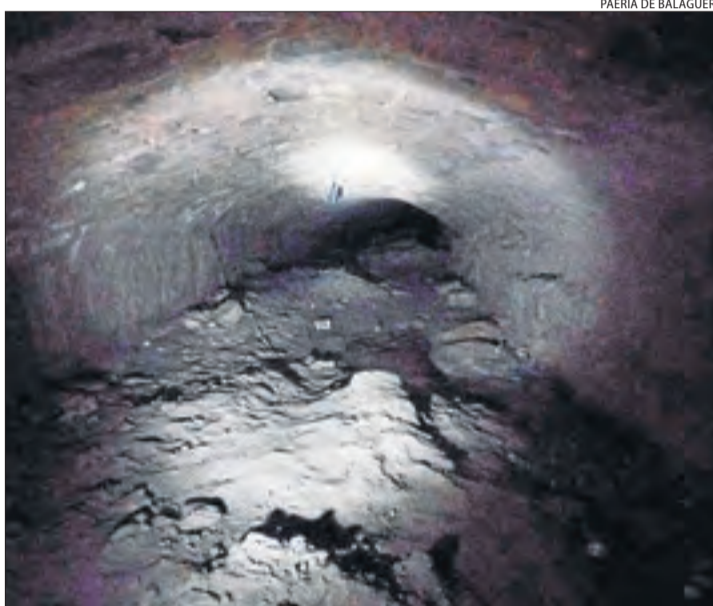
L'estat actual de l'interior de la séquia del Cup.

En un altre ordre de coses, pròximament es reprendran les obres del projecte de la reobertura al públic del jardí arqueològic del Castell Formós, paralitzades per l'estat d'alarma pel coronavirus.