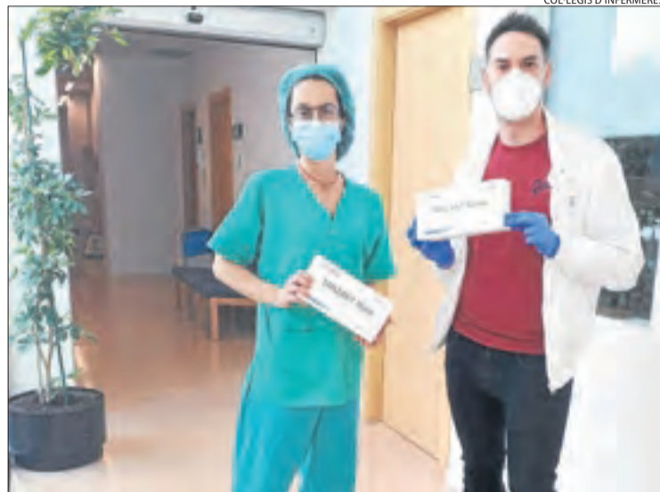
Protecció per al personal del Santa Maria. El Col·legi d'Infermeres va entregar 400 mascaretes FFP2 homologades a l'Hospital Santa Maria.

L'Hotel Segle XX de Tremp també continuarà reservat per derivar-hi pacients amb coronavirus, malgrat que actualment gairebé està en desús ja que dijous acollia només dos persones que estaven a punt de ser enviades a casa. Havia arribat a tenir una desena de pacients. L'Hotel Alegret de la capital del Pallars Jussà, per la seua part,