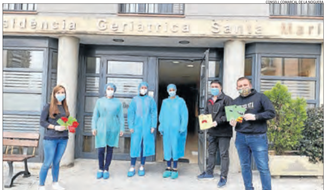
Joves migrants de la Noguera van repartir cartes i roses per Sant Jordi a residències de Balaguer.

Desinfecta les residències Comtes d'Urgell i Santa Maria i fa proves a usuaris i treballadors