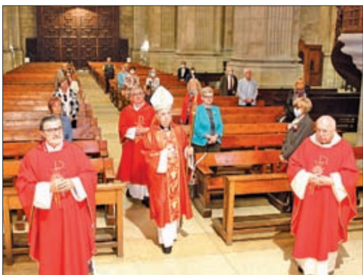
La Catedral, durante la misa de Sant Anastasi

✓ Mascarillas de Castelló de Farfanya ayudarán a los refugiados