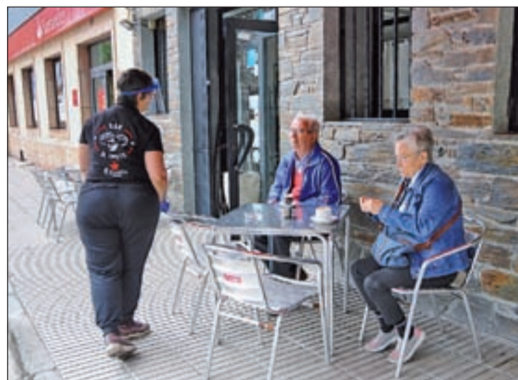
Una parella en una terrassa de la capital del Pallars Sobirà