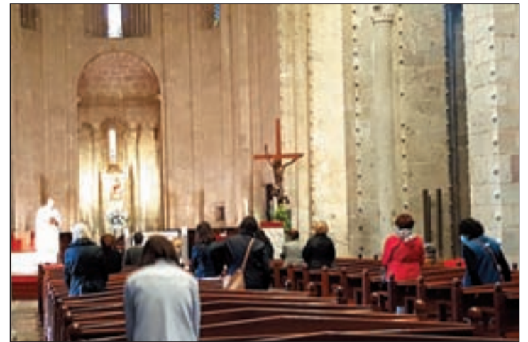
Diversos fidels van acudir ahir a les parròquies

El Bisbat d'Urgell van reprendre ahir les misses als municipis que van passar a la fase 1 de desconfinament i que, per tant, poden tornar a celebrar l'eucaristia amb fidels, gairebé dos mesos després que haguessin de tancar portes per la crisi del coronavirus. En concret, a la Val d'Aran han tornat a obrir portes les esglésies de Vielha, Bossòst i Les, al Pallars Jussà han reprès les misses a Tremp, Isona i la