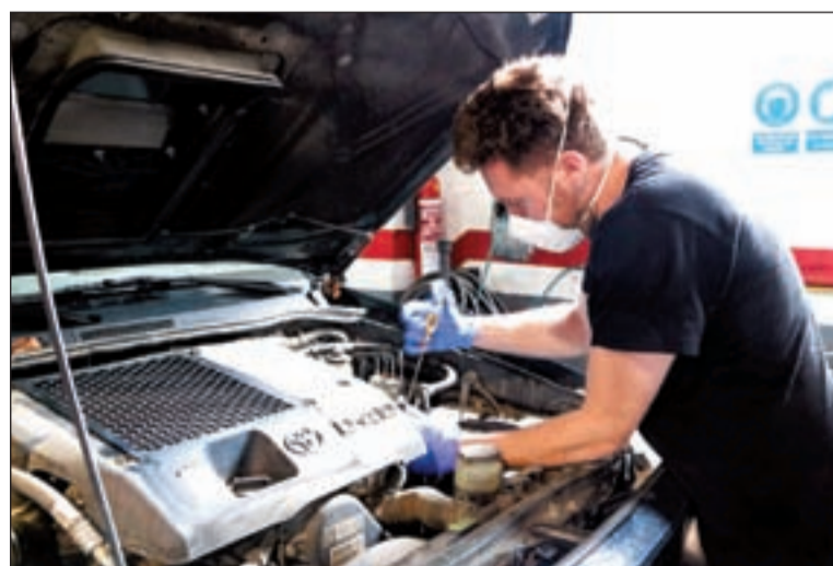
Un operari en un taller de Sort amb guants i mascareta

són les mesures de seguretat i higiene. Tots els mecànics treballen amb guants i mascareta. Quan han de moure un vehicle hi posen les proteccions adients al seient, volant, canvi de marxes i fre de mà. Les mesures d'higiene s'intensifiquen de manera especial també en la neteja de les claus dels vehicles i