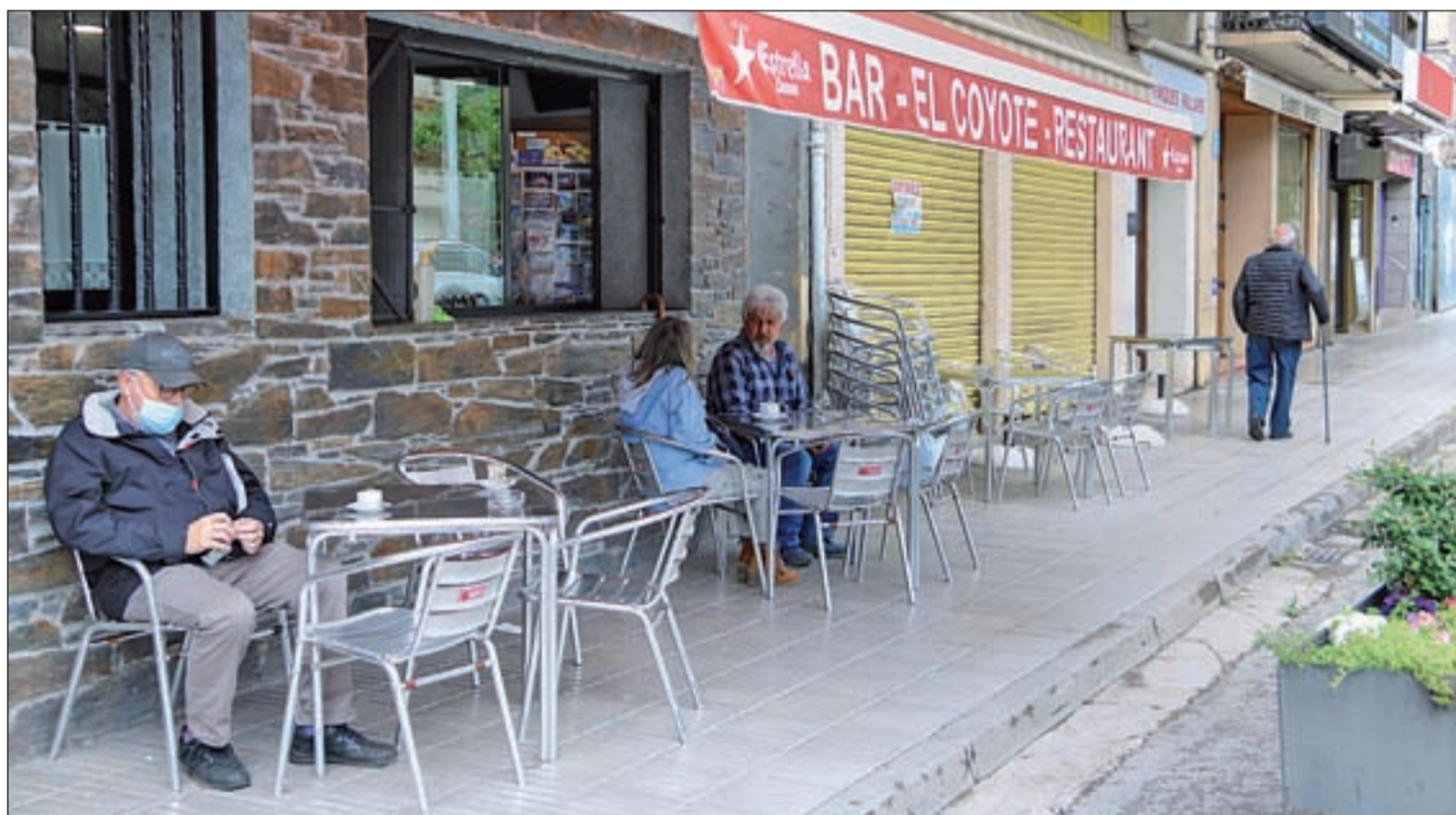
Diversos veïns van fer el primer cafè en gairebé dos mesos a les terrasses de Sort, que ahir va assolir la fase 1 del desconfinament