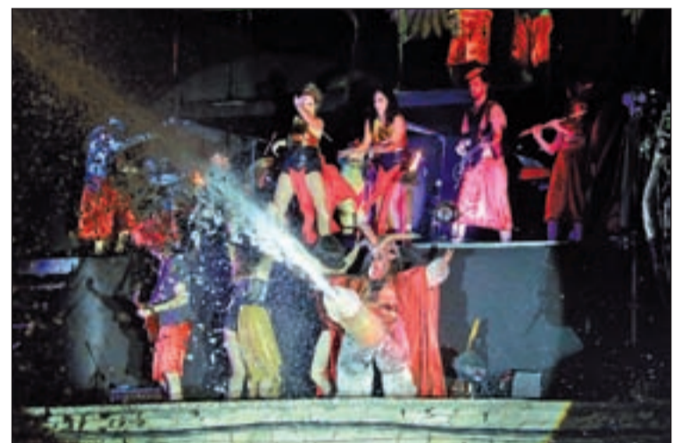
L'escorreguda del Mascle Cabró l'any passat

Així, s'està treballant en organitzar un Aquelarre “en clau més cerverina que mai” i adaptant-se