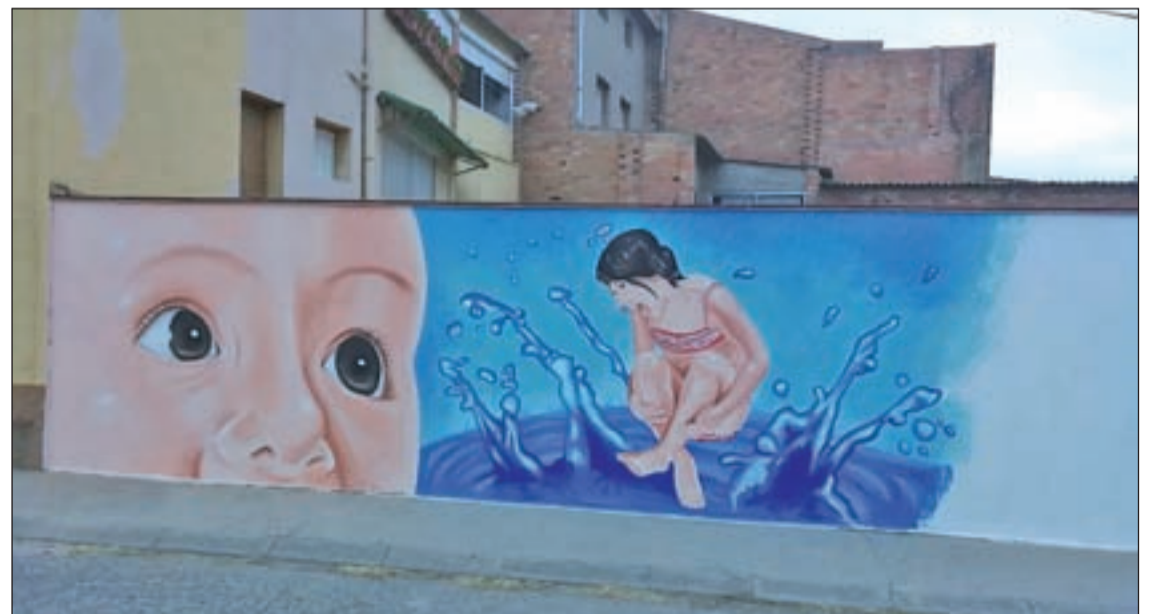
El mural de grans dimensions és obra de l'artista Jonhatan Arraràs

Així doncs des de l'Ajuntament de la capital de la Segarra asseguren que totes les decisions relacionades amb la celebració de la festa es prendran de manera consensuada amb les autoritats sanitàries i el Comitè d'Emergències Municipal.