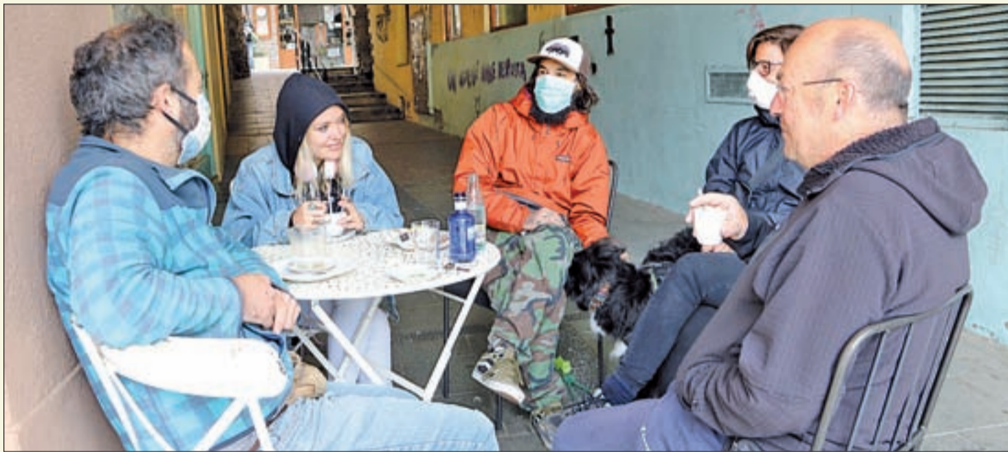
Algunos clientes aprovecharon por tomar la primera consumición en una terraza, como en el caso de Sort

✓ El comercio de l'Alt Pirineu es el sector en el que más se nota la fase 1