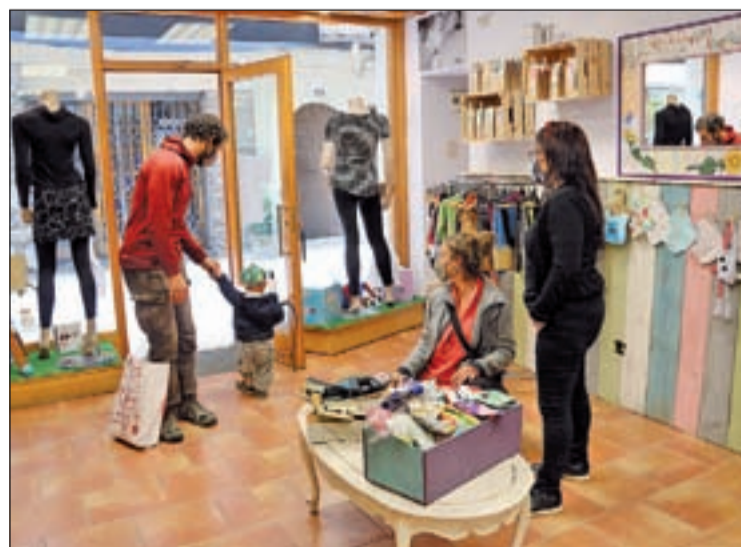
Una botiga de roba de Sort, ahir amb els primers clients

la botiga de roba de nens i mares Vida Làctea de Sort, va explicar que el canvi de talla de molts nens durant aquests dos mesos ha portat a moltes mares durant aquests dies a interessar-se pel