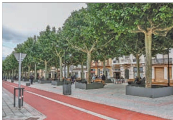
També s'ha millorat el paviment dels carrils

transport de viatgers per ferrocarril, el proper 14 de desembre. Fonts d'Air Nostrum van informar que el projecte serà un dels tres majors operadors privats a Europa, connectarà en una primera fase Madrid amb Alacant, Barcelona, Còrdova, Màlaga, Sevilla, València i Saragossa, i posteriorment ampliarà la seva xarxa de destinacions a mesura que es vagin obrint noves rutes d'Alta Velocitat a tot Espanya.