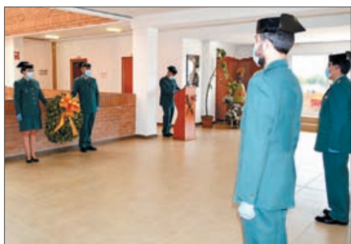
Moment de l'homenatge que es va realitzar ahir

Esquerra d'Alfarràs va denunciar vetos per part de l'equip de govern a l'hora de fer ús de l'eBando Municipal i va avisar que a partir d'ara deixarà d'usar aquest servei. Els republicans consideren que tots els grups municipals haurien de tenir els mateixos drets amb l'eBando.