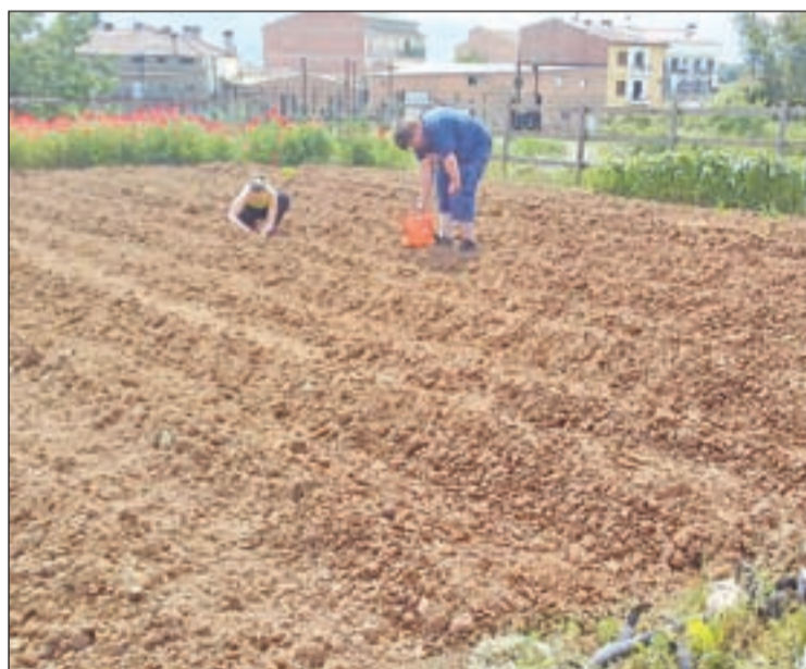
Imatge d'arxiu de les activitats que fa l'associació

És per aquesta raó per la que des del mes de gener de 2020 l'Associació Alba a la comarca del Pallars Jussà en col·laboració amb el Consell Comarcal del Pallars Jussà i el suport econòmic de