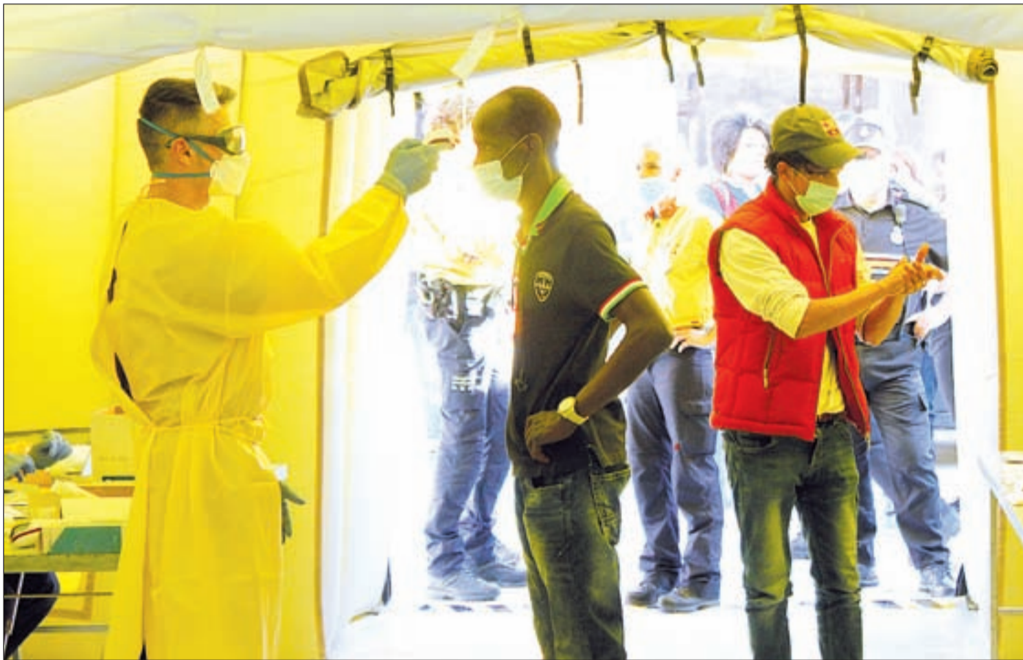
Salut hizo ayer pruebas de coronavirus en una carpa en la Plaça del Dipòsit a los temporeros que duermen en la calle