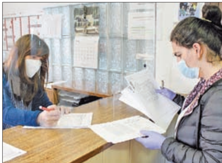
Los trámites, con mascarilla y guantes