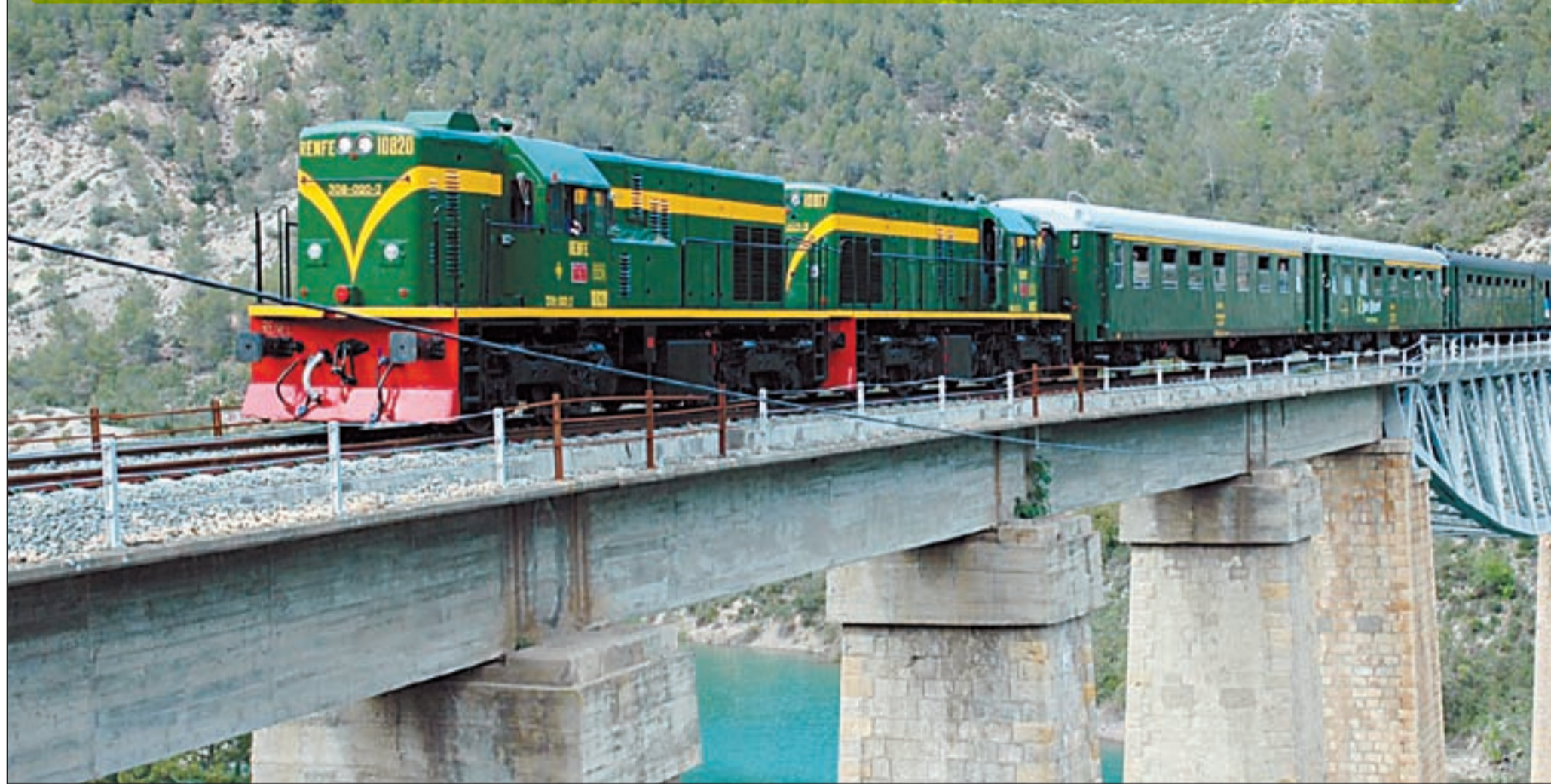
La Ruta dels Llacs entre Sant Llorenç de Montgai i Cellers és aconsellable fer-la amb tren perquè aquest tram presenta una orografia força complicada