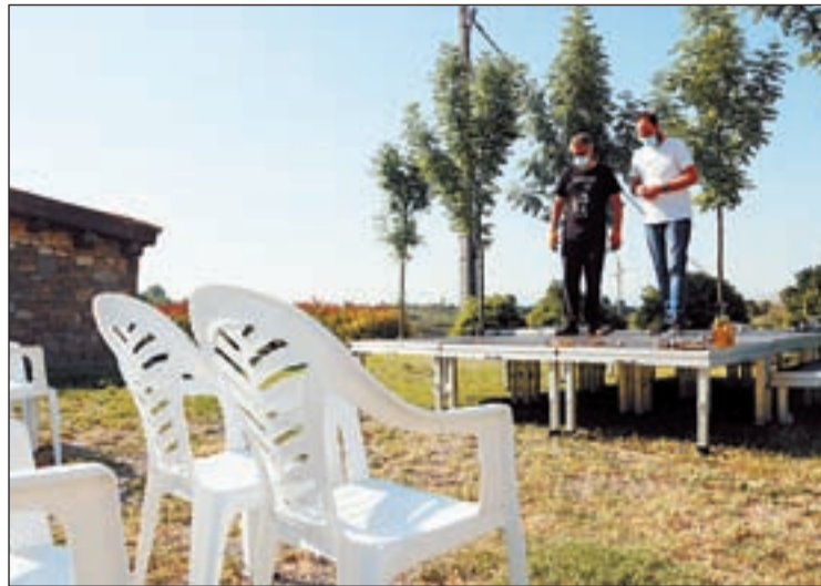
El Desescal-ART es va centrar en les arts escèniques

El Consell Comarcal del Pallars Jussà ha presentat aquesta setmana fins a 5 accions de dinamització de diferents sectors econòmics, a través del projecte "Treball a les 7 comarques". Aquestes accions se centraran en els sectors dels serveis socials, primari i turístic, donant continuïtat a la feina realitzada en anys anteriors, seguint les línies de treball del Pla estratègic de desenvolupament econòmic i social de la comarca. En l'àmbit dels serveis socials, l'acció té com a objectiu oferir noves oportunitats per a les persones amb necessitats de suport, des de la promoció de l'ocupabilitat de les persones amb discapacitat i de les persones en risc d'exclusió i l'accés a una atenció integrada per a les persones en situació de cronicitat.