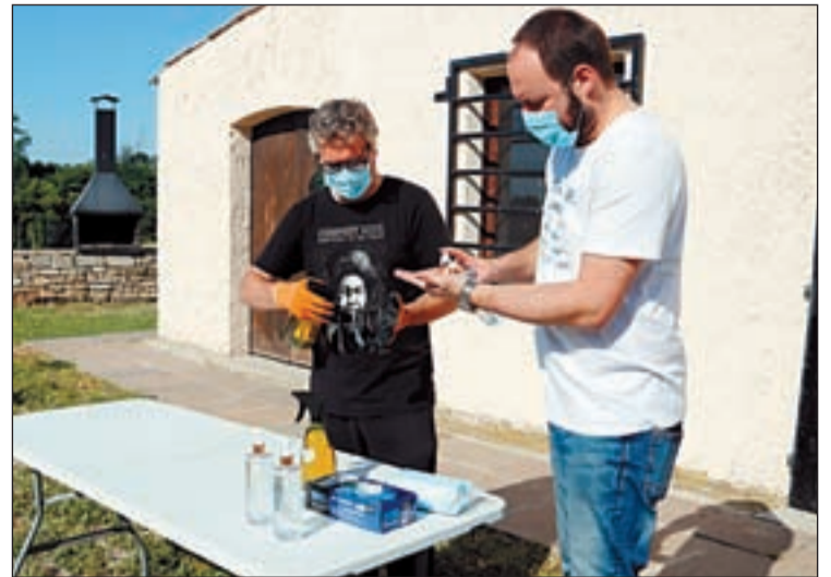
El festival es va celebrar amb totes les mesures sanitàries