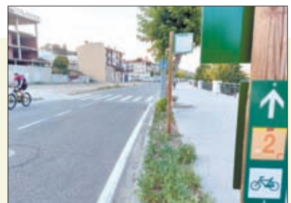
La Ruta dels Llacs al seu pas per un dels carrers de la ciutat de Balaguer

xions interurbanes. D'altra banda, també són susceptibles de rebre subvenció les vies ciclistes en àmbits d'interès natural o cultural destinades principalment a un ús turístic.