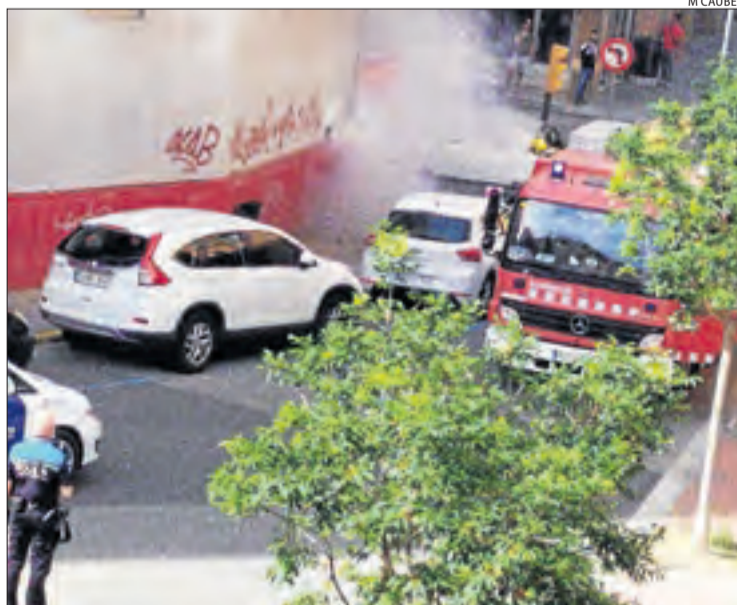
Imatge del foc d'ahir a la tarda a la ciutat de Lleida.

FRAGA | La protectora d'animals Amigos Peludos Bajo Cinca va denunciar ahir l'abandó de tres cadells a Fraga. Els animals van ser trobats al camí de Torrent de Cinca al costat del riu. La protectora s'ha fet càrrec dels tres gossos, que provisionalment han estat acollits per un membre de la protectora. Les protectoras denuncien abandonaments continus de mascotes a Ponent.