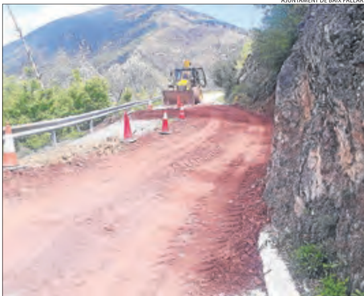
L'accés a Peramea s'ha anivellat provisionalment amb terra.

"És una carretera que, a més de ser intercomarcal i connectar un gran nombre de pobles, granges i el freqüentat estany de Montcortès, també suporta