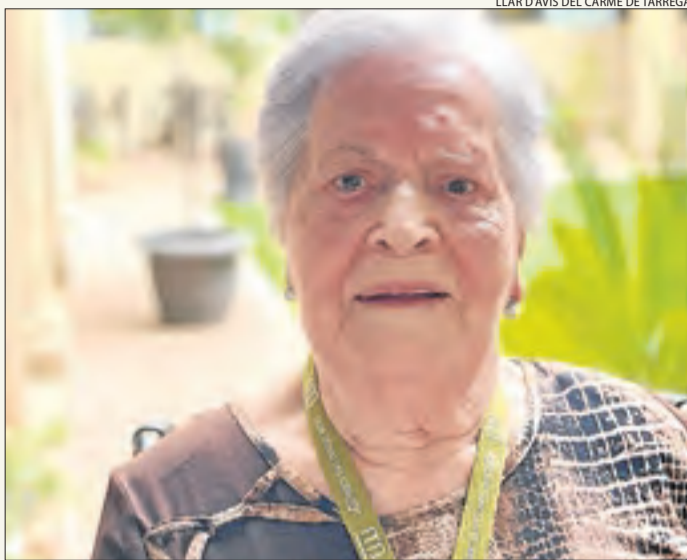
LLAR D'AVIS DEL CARME DE TÀRREGA

«Els aplaudiments de les vuit em donen força»