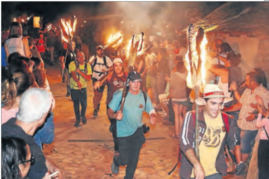
Imatge d'arxiu de la baixada de falles a Boí l'any 2017.

Fins ahir hi havien participat 183 persones, encara que el termini es prolongarà fins a l'11 de maig. Davant de la pregunta de si s'haurien de suspendre les falles aquest any, un 80% dels participants opina que encara és massa aviat per prendre aquesta decisió i que és preferible esperar a veure com avança la situació en les properes setmanes. Sobre la possibilitat de celebrar-les en les mateixes dates de cada any i restringir la participació només a residents de cada poble, un 70% dels enquestats opinen que seria la millor opció, ja que d'aquesta manera s'evitarien aglomeracions i no es perdria la tradició. El qüestionari també planteja si, en cas