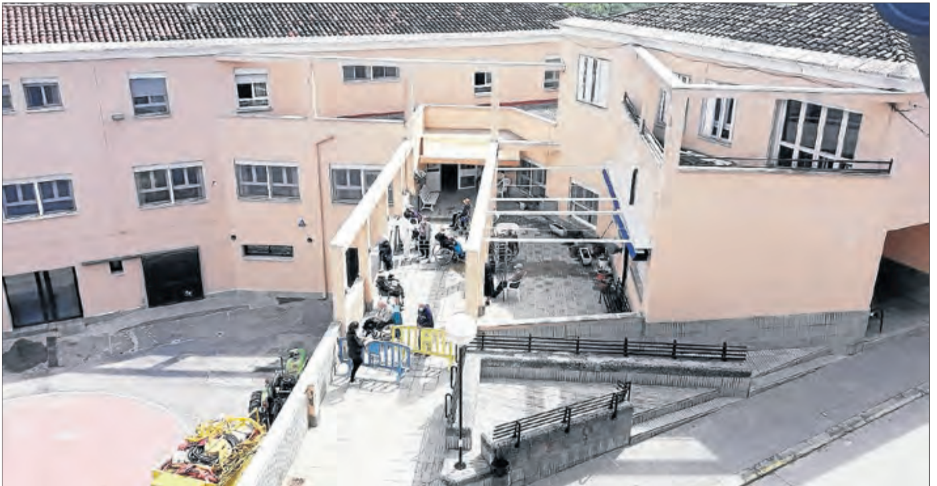
La residència d'Àger, una de les primeres i més afectades pel coronavirus, on els usuaris han començat a sortir al carrer aquesta setmana.

Salut ha portat a terme 1.783 tests en 14 dels 20 centres afectats i el 44% dels usuaris ha donat positiu || Els sindicats denuncien que el sector està precaritzat i és la 'ventafocs' del benestar