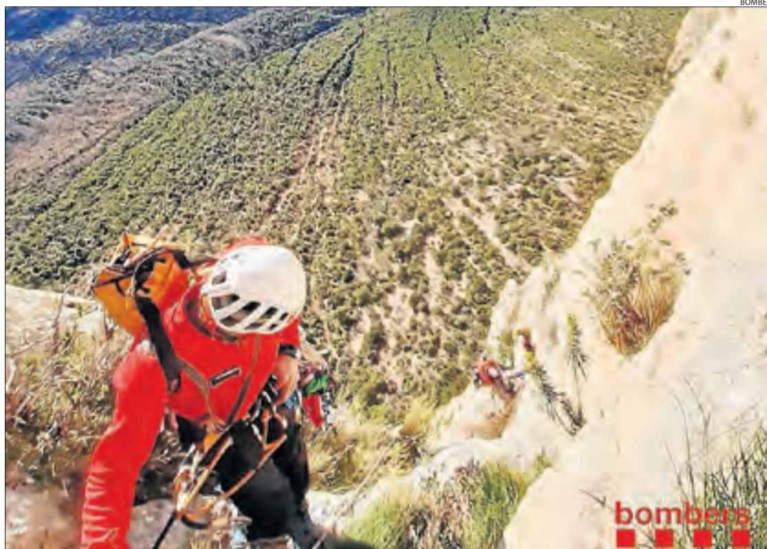
Imatge del rescat el març passat d'un escalador ferit a Sant Esteve de la Sarga.

Durant l'any passat, els Bombers de la Generalitat van dur a terme un total de 285 intervencions al medi natural a les comarques lleidatanes, la qual cosa suposa un 13% menys que el 2018. La majoria dels rescats van ser de muntanya, amb 198 assistències a la província de Lleida, seguits de la recerca de persones perdudes, amb 76 rescats, així com onze assistències al medi fluvial. En els últims sis anys han estat unes 6.000 intervencions.