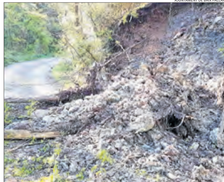
El camí d'Enseu després del despreniment.

D'altra banda, a primera hora d'ahir va succeir un despreniment de pedres i terra al