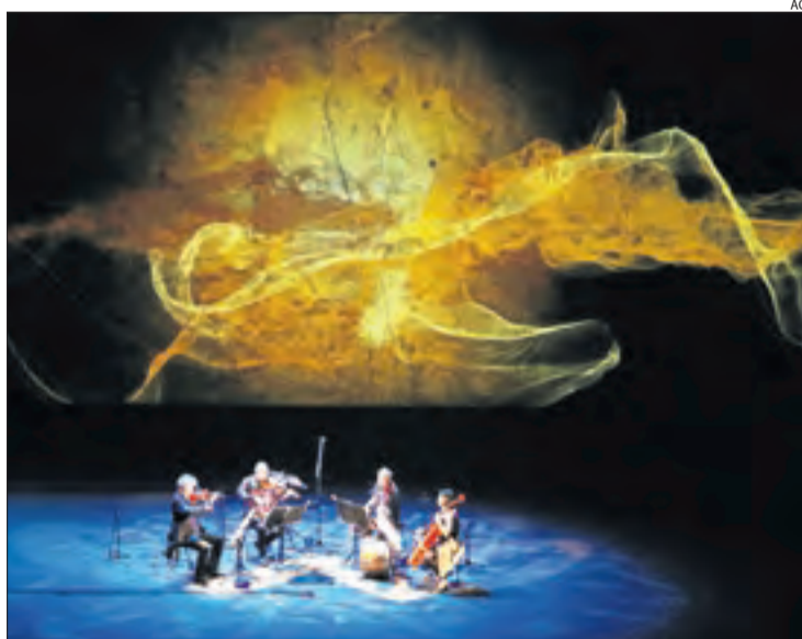
Concert inaugural l'any passat al Teatre Grec de Barcelona.

El Festival Cruïlla s'ajorna al 2021 però es crea un Cruïlla XXS amb espectacles diaris de petit format