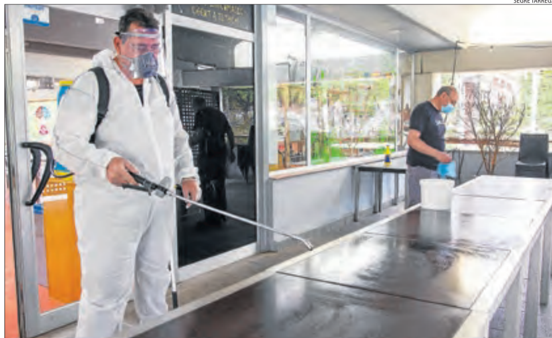
El personal treballava ahir en la desinfecció del local per reobrir dilluns.

i també oferirà servei de take away i bufet lliure, en el qual hi haurà una persona que servirà els plats que triïn els clients i que podran veure rere una mampara. Els clients hauran d'esperar mantenint la distàncies senyalit-