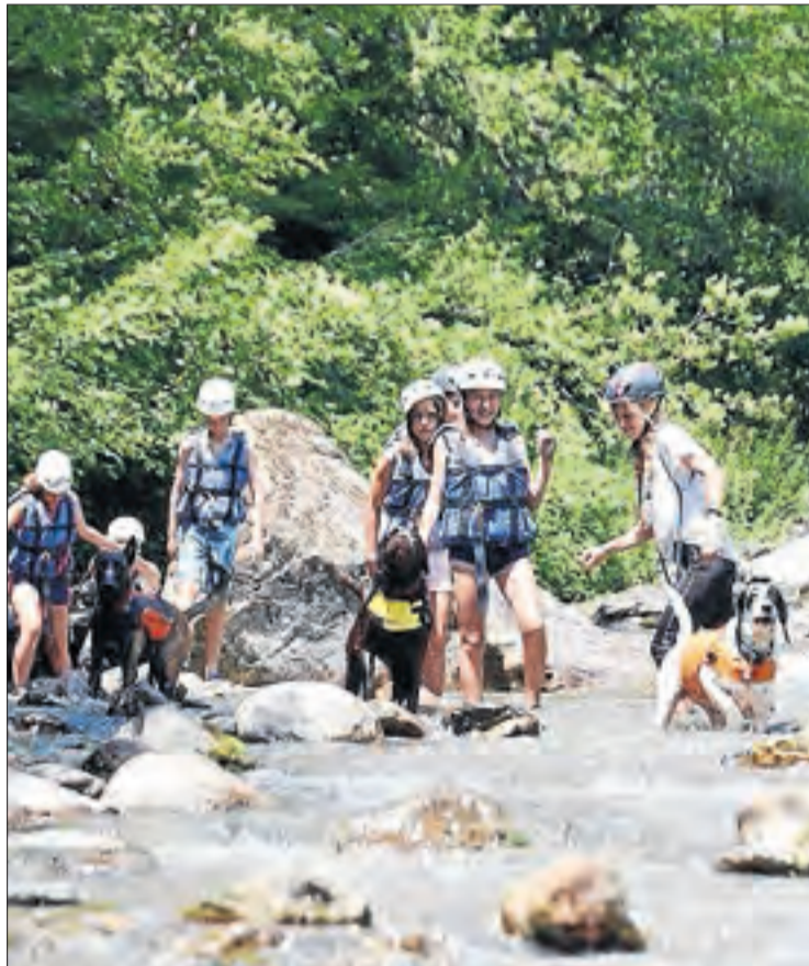
Imatge d'arxiu d'unes colònies a Salàs de Pallars.

Entitats i Generalitat confien tenir una nova proposta la setmana vinent perquè hi hagi temps a adaptar les mesures. Val a recordar que l'AECC va cancel·lar les colònies a Aran pel fet de ser per a menors vulnerables al virus.