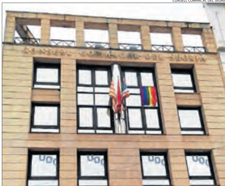
La façana del consell del Segrià amb la bandera multicolor.

maig, el Banc de Llet Materna torna a recollir llet de les mares donants, que s'havia interromput amb l'estat d'alarma, i ara les donants han d'extremar les mesures d'higiene, fent ús de la màscara i rentant els pots de llet amb alcohol. Actualment, les reserves són baixes, encara que hi ha llet processada per garantir l'alimentació dels prematurs durant el mes de maig, per la qual cosa s'anima a la donació.