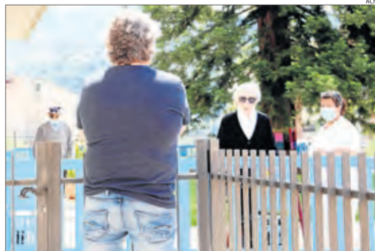
Un usuari parlant amb el seu familiar a més de 2 m de distància.

Aquesta residència de la Pobla és una de les dotze de la regió sanitària del Pirineu i Aran que estan catalogades