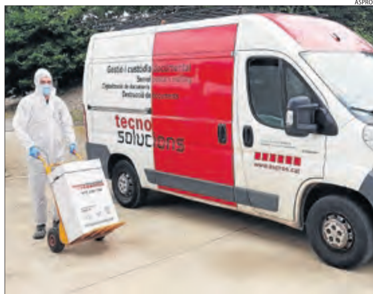
Un treballador recollint una caps de cartró amb residus d'EPI.

Des de dijous treballa amb empreses i centres comercials de Tarragona, Lleida i tot Catalunya