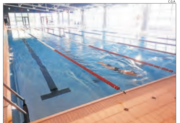
Les instal·lacions de les piscines del Palai de Gèu.

vendres ho faran el centre Sort i La Claror de la Seu d'Urgell. La resta de residències ho faran quan disposin dels protocols de visites i seguretat i rebin l'aprovació de Salut.