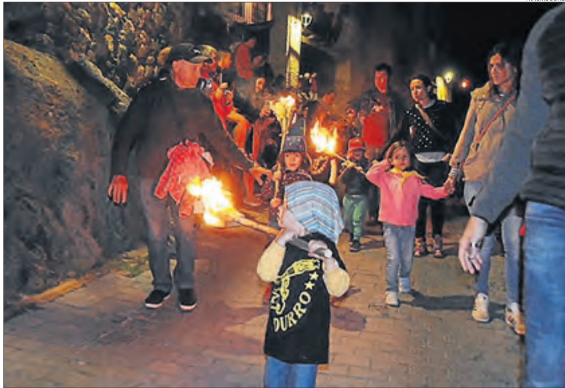
Imatge d'arxiu de la baixada infantil de falles a Durro.

Localitats com Vilaller opten per celebrar un acte simbòlic per mantenir viva la tradició