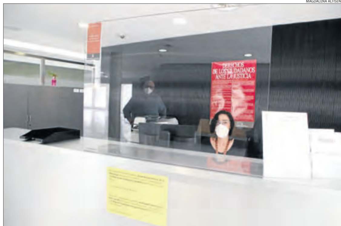
Mampara de seguretat que s'ha col·locat al servei d'atenció al ciutadà del Canyeret.

perada serà el 4 de juny (dijous vinent), quan s'aixequi la suspensió dels terminis processals, la qual cosa representarà començar a celebrar judicis, com els que ja s'havien assenyalat abans de l'estat d'alarma.