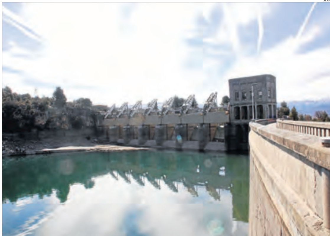
Imatge de la presa de Sant Antoni, al Pallaresa, que actualment gestiona Endesa.

LLADORRE | Una sentència de l'Audiència Nacional que avala el traspàs de preses i embassaments a l'Estat una vegada expira la concessió ha revifat reivindicacions al Pirineu. La resolució judicial, del mes de febrer passat, desatén un recurs de la concessionària de la central de Lafortunada, a Osca, davant la decisió del Govern espanyol d'exigir el traspàs. Això ha motivat preguntes parlamentàries sobre els terminis de reversió d'altres instal·lacions, mentre que els municipis amb hidroelèctriques reclamen conservar els ingressos derivats de taxes, impostos i cànon, sigui qui sigui el titular. L'Associació de Municipis Afectats per Centrals Hidroelèctriques i Embassaments de Lleida, que reuneix 35 municipis, exigeix que si l'Estat assumeix centrals, aboni impostos com IBI, BICES i IAE, així com taxes i cànon que ara paguen les empreses hidroelèctriques. El president