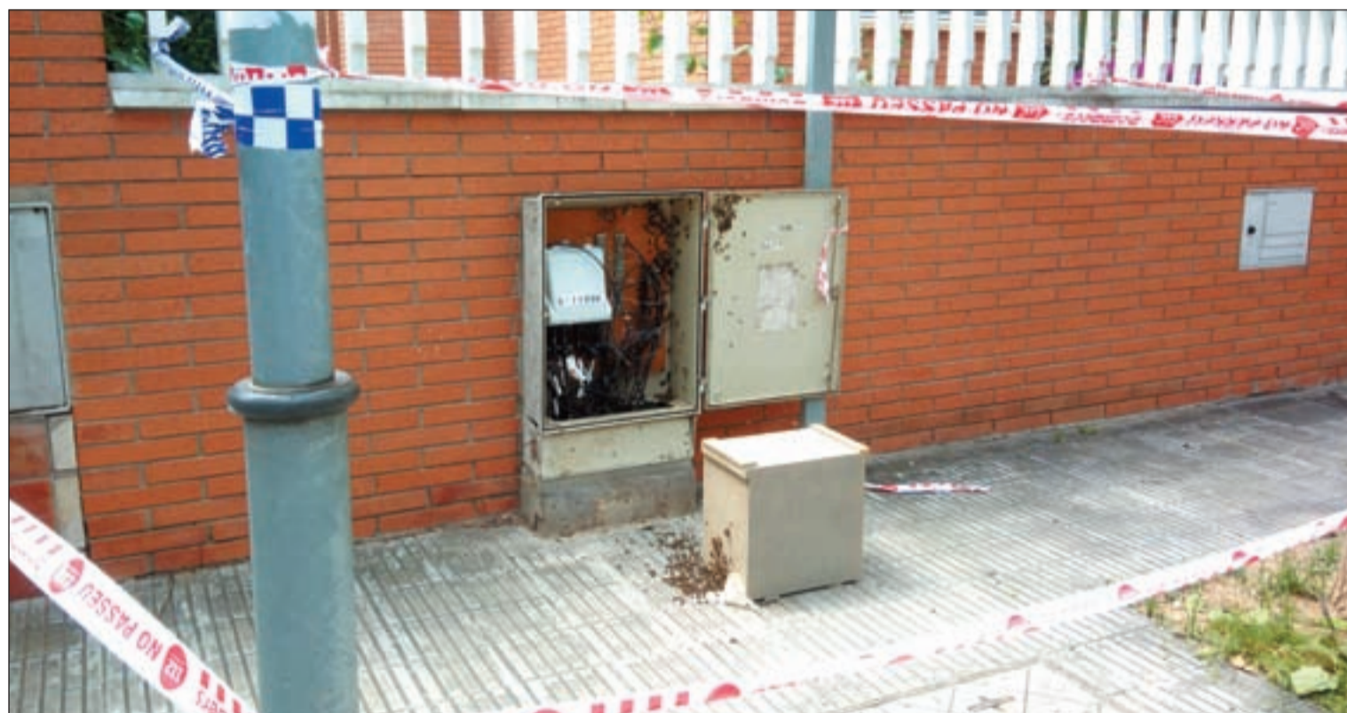
Els Bombers de la Generalitat van retirar recentment un eixam d'abelles al carrer Sant Ramon del barri de la Bordeta de Lleida

Davant d'això, Roura explica que "s'ha de diferenciar si estem davant d'un eixam d'abelles o un niu de vespes". Així, els eixams "estan de pas, ja que busquen un lloc on ubicar la seva 'casa' que sigui fosc, tranquil i on fer una colònia més gran". Per aquesta raó, es poden trobar prop de cases, escoles, en arbres o fanals. A més, cal tenir en compte que "tenim al cap males imatges de les abelles, que ens hem de deslliurar. Elles defensen casa seva i no ataquen si no les molestem o els hi tirem pedres o pals. De fet, abans de picar xoquen amb tu per alertar-te, ja que són conscients que si piquen moren. Així mateix, són vegetarianes". Per contra, "les