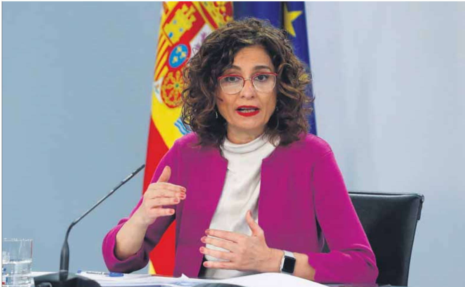
La ministra portaveu, María Jesús Montero, en la compareixença d'ahir a La Moncloa per informar del consell de ministres

El president i el portaveu d'ERC al Congrés, Gabriel Rufián, actualitzen, avui, el minut i resultat de la relació en la sessió de control i la pregunta del republicà és tan oberta que tant pot elevar la tensió com calmar les aigües: “Considera que cal prendre mesures per acabar amb la impunitat de què gaudeixen algunes institucions de l'Estat?”, exigirà Rufián a Sánchez. I això abans que ERC s'ar-