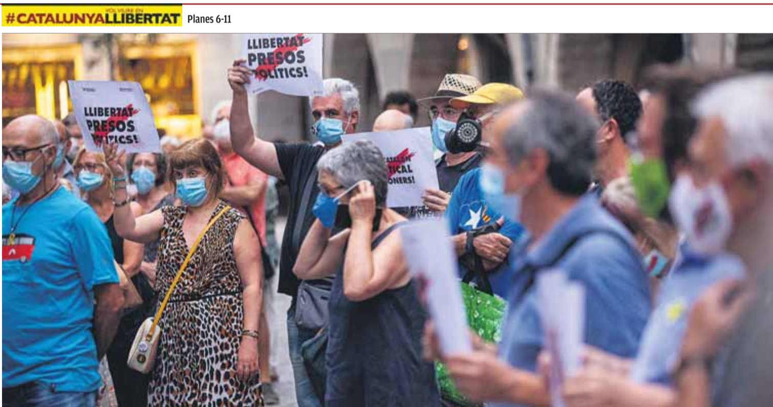
L'acte de cada dilluns a la plaça del Vi de Girona es va centrar ahir en el judici de dos nois empresonats per les protestes contra la sentència ■ QUIM PUIG

Inici el 14 de setembre amb grups estables, sense distància ni mascareta El govern, que rep crítiques de pares i sindicats, hi destinarà 370 milions