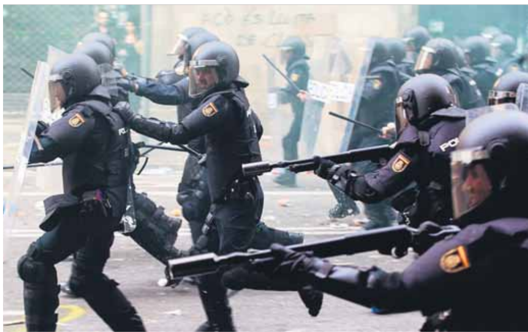
Manifestants dispersats per antiavalots dels Mossos a l'aeroport del Prat, el 14 d'octubre passat. I escopeters de la policia espanyola en una actuació per aldarulls a Via Laietana