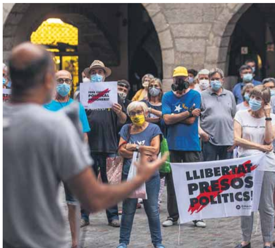
La concentració es va fer a la plaça del Vi de Girona ■ QUIM PUIG

"Volem destacar que es tracta d'uns fets absolutament sobredimensionats i molt poc provats", van dir ahir els representants del grup de suport als dos joves. Van denunciar també que el govern espanyol, el més progressista de la història, "continua enviant instruccions perquè els fiscals es dediquin a allargar al màxim el marc tecnològic del Codi Penal i demanin la pena d'un homicidi (9 anys de presó) a cadascun dels joves". En el decurs de l'acte van demanar a la Generalitat, que actua com a acusació particular, que avui i demà no es presenti al judici i "deixi el seient buit". ■