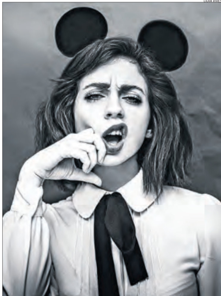
'Mad Mouse', premiada amb la Medalla d'Or als MIFA.

contactes. La fotografia premiada amb la Medalla d'Or q la categoria Fine Art-Portrait es titula Mad Mouse , un autoretrat en blanc i negre en el qual l'artista apareix amb les orelles del famós personatge de dibuixos animats Mickey Mouse. "Pensem en aquest personatge com una icona de la infantesa i, per tant, innocent, però amb l'expressió i el treball en blanc i negre es descontextualitza i es converteix en un símbol rebel",