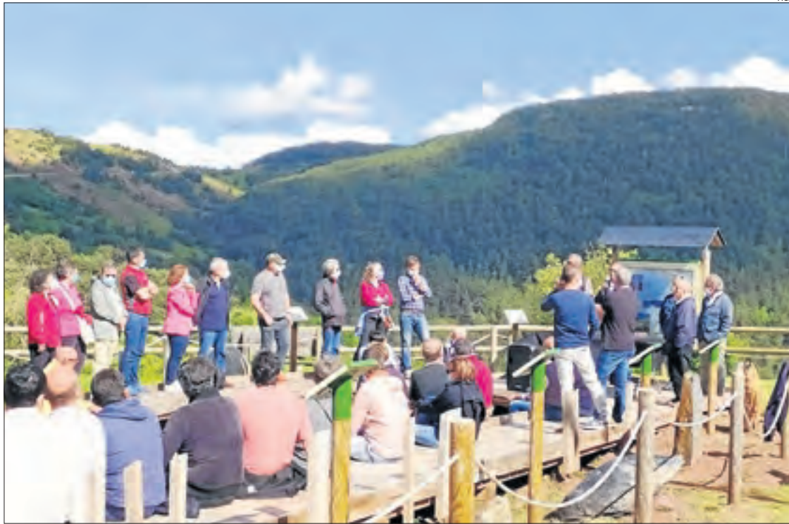
L'oposició a l'Agència va impulsar la creació dissabte d'una plataforma a Rubió.