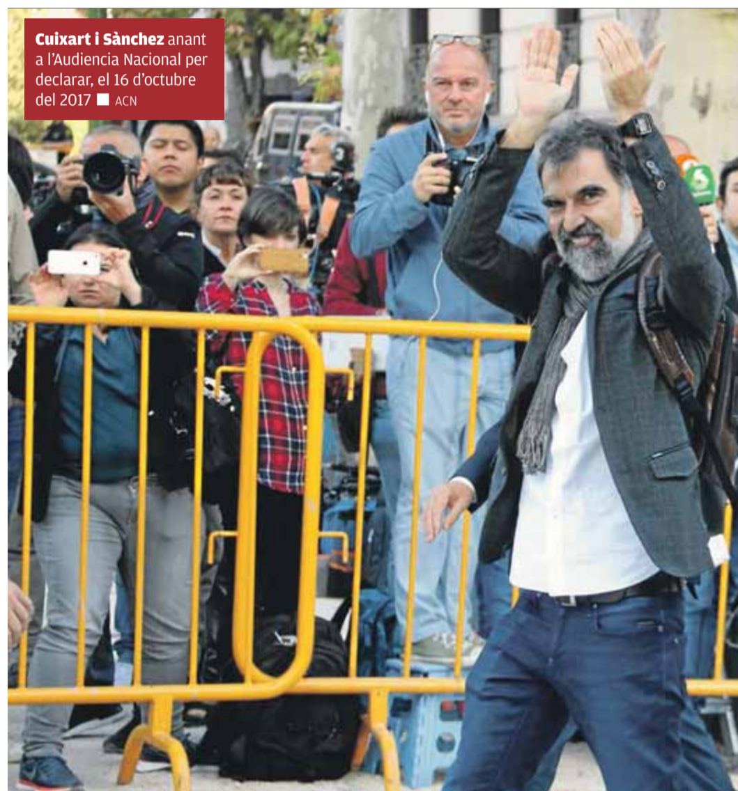
Cuixart i Sànchez anant a l'Audiència Nacional per declarar, el 16 d'octubre del 2017

Per la seva banda, el Grup de Treball de Detencions Arbitràries de l'ONU demanava l'alliberament immediat de Cuixart, Sànchez i el vicepresident Junqueras el maig de l'any passat també mentre estaven en presó preventiva. El grup considerava que se'ls va vulnerar la presumpció d'innocència quan la vicepresidenta o el ministre de l'Interior espanyols els van titllar sense judici de “perillous i rebels”. Veia “arbitrària” la