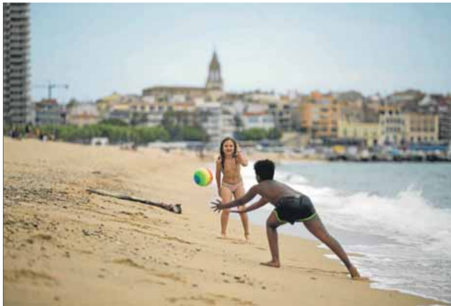
Una imatge de principis de juny de la platja de Palamós