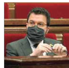
El vicepresident del govern, Pere Aragonès, ahir

El vicepresident, Pere Aragonès, va explicar que estan treballant en els "escenaris" del 2021, però que els cal saber quins recursos arribaran del model de finançament, quins fons extra i el límit de dèficit.