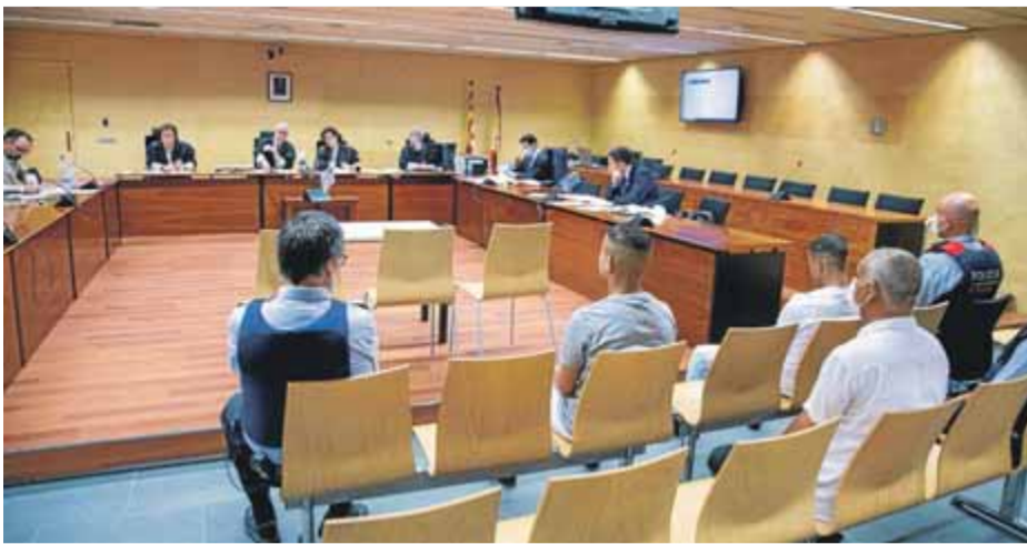
Un moment del judici als dos joves gironins