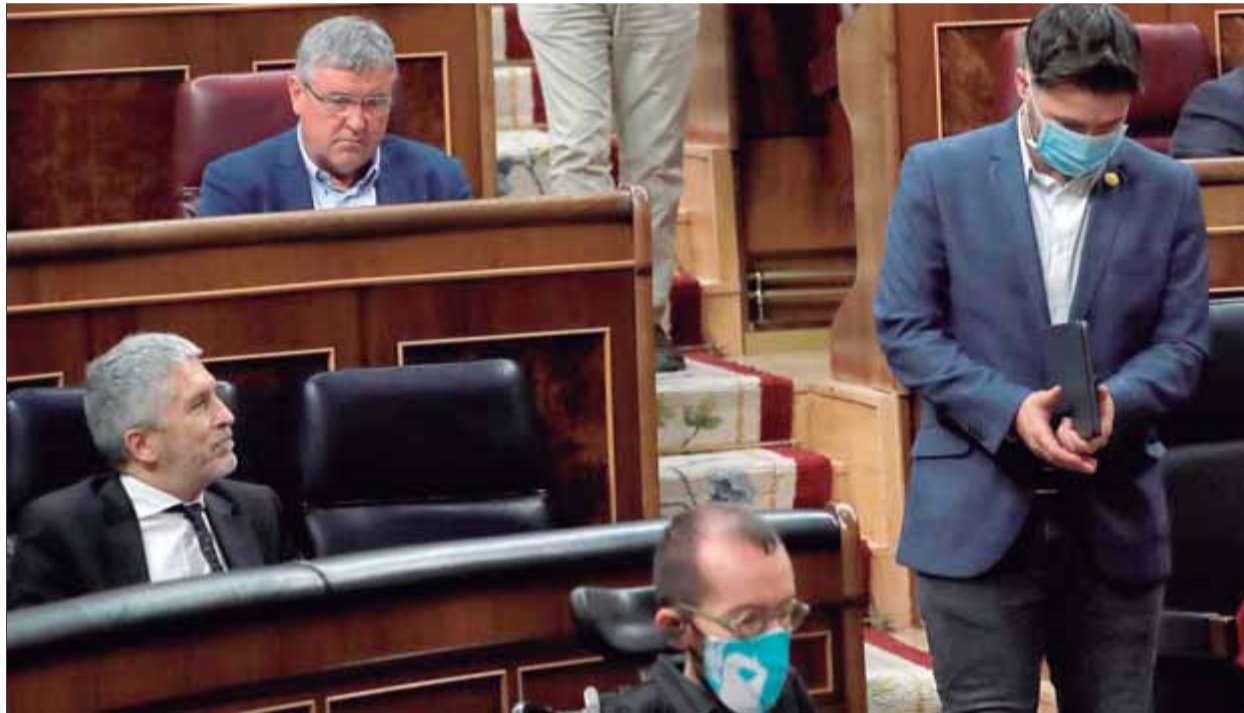
El ministre de l'Interior, Fernando Grande-Marlaska, va mantenir ahir un debat amb Gabriel Rufián (ERC) al Congrés

El Catalangate , el cas d'espionatge destapat la setmana passada a líders independentistes com ara el president del Parlament, Roger Torrent, va arribar ahir a les cambres catalana i espanyola, on el ministre de l'Interior, Fernando Grande-Marlaska, va tornar a negar que el seu govern hi tingui res a veure. "En un estat de dret com l'espanyol ni la Guàrdia Civil, ni la policia ni el CNI investiguen ni espïen opinions polítiques, tampoc les que no comparteixen la Constitució", etzibava al portaveu d'ERC, Gabriel Rufián, durant la sessió de control al Congrés al matí. Marlaska va lamentar que el republicà donés per fet que el CNI és al darrere de l'afer, i va insistir que només s'investiguen fets delictius seguint el "principi de legalitat", sempre amb "l'impuls" del ministeri fiscal i sota control judicial. Rufián, que va advertir que "segurament" també s'han espïat polítcs espanyols d'esquerres, fins i tot del mateix govern, va exigir que s'obri una comissió d'investigació "per veure com de profund és el cau del conill". "Cada vegada que el govern més progressista i plurinacional de la història diu que és greu però no fa res, encara és més greu. Han de fer alguna cosa", etzibava. Marlaska se'n va desentendre, però