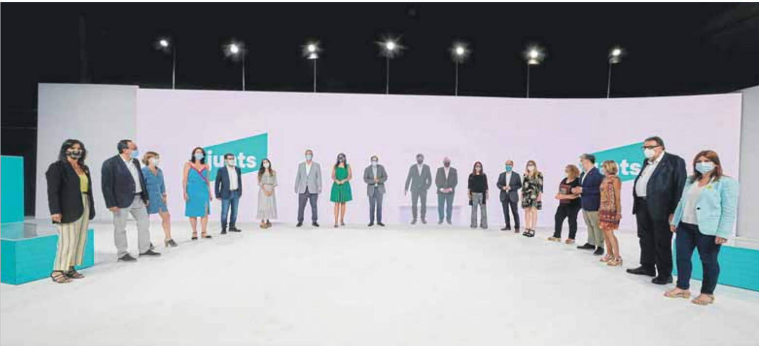
Puigdemont i Puig, al centre, en connexió telemàtica i, al voltant, els presos, consellers i electes d'altres administracions