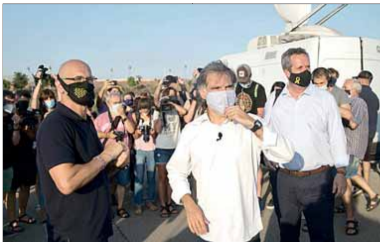
Romeva, Cuixart i Forn, dimarts entrant a la presó de Lledoners

Si no fos perquè estan jugant amb els drets i les llibertats dels nostres presos polítics i, per exten-