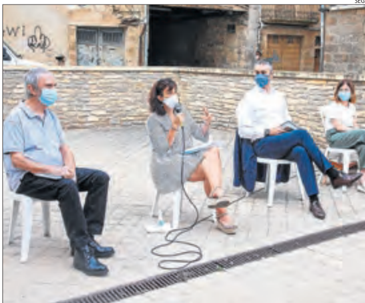
Presentació de l'últim llibre d'Oriol Junqueras a Tàrrrega.