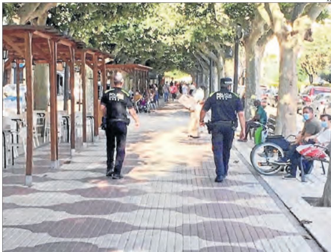
La policia de Balaguer, on s'han començat a aplicar multes per incomplir normes de seguretat.

Els setze municipis del Pla d'Urgell sumen 282 contagis des de l'inici de la pandèmia, 130 dels quals a Mollerussa. Del