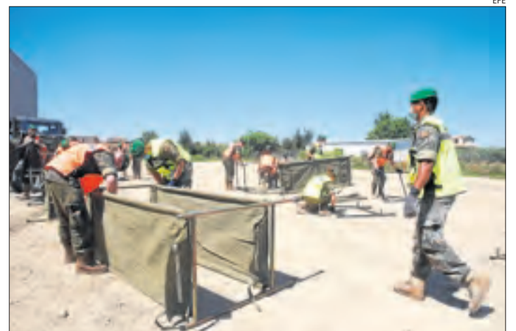
Lliteres de l'Exèrcit a Albalat ■ L'Exèrcit va instal·lar ahir 50 lliteres i tres tendes al poliesportiu d'Albalat de Cinca (Osca) per als temporers que estan aïllats per un brot.

Així mateix, Cases va assegurar que aquestes persones que estan aïllades se sotmetran avui a la prova del Covid-19, encara que si donen negatiu es mantindran aïllades per prevenció i treballaran des de casa, a l'espera del segon test de l'empleada. En aquest sentit, Cases va explicar que tant la treballadora que ha donat positiu com ella i les altres cinc persones es troben "bé".