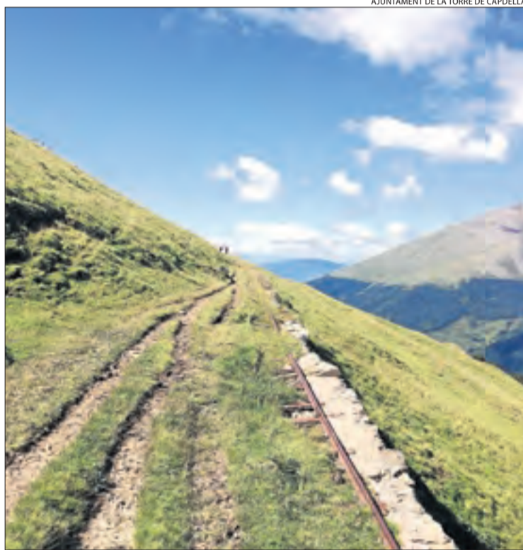
Imatge de l'estat actual d'un tram de vies de l'antic carrilet.

Per a la seua redacció, Ferrocarrils fixa com un dels referents el tren turístic d'Artouste, al Pirineu francès. Aquesta infraestructura es va inaugurar el 1922 per transportar personal i material per a la construcció d'una presa, unes condicions similars al carrilet de la vall Fosca (vegeu el desglossament), encara que la instal·lació