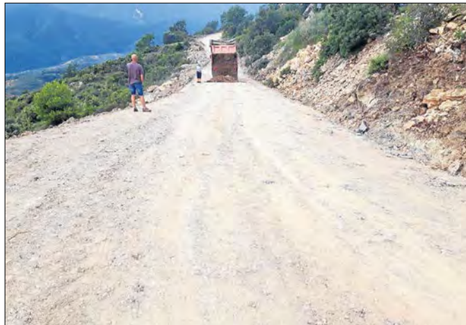
Últims treballs a la variant abans d'obrir-la avui.