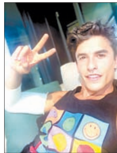
El piloto de Cervera ha sido operado del brazo

“Caer está permitido, levantarse es una obligación. Gracias a todos por los mensajes de apoyo”. Con estas palabras agradeció el piloto las muestras de ánimo. | PÁG. 26