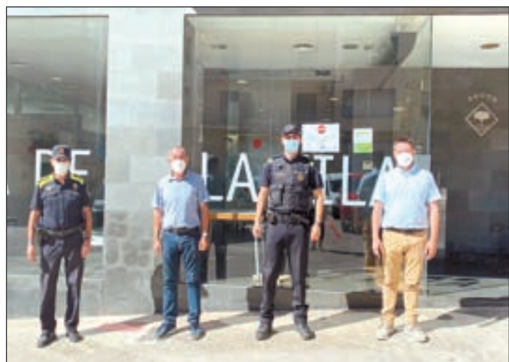
Imatge de la benvinguda al nou agent del cos

L'Agència Catalana de l'Aigua (ACA) ha resolt la convocatòria de la línia d'ajuts adreçada als ens locals per a la realització d'actuacions de millora del subministrament d'aigua. Es destinaran 20 milions d'euros per actuacions destinades a incrementar la disponibilitat d'aigua en municipis que tenen mancances en el subministrament, tant per captacions vulnerables com per problemes de qualitat. S'han rebut 324 peticions, 213 de les quals han complert amb els requisits de la convocatòria. S'ha resolt atorgar 165 de les propostes presentades, després que els municipis hagin decidit la seva acceptació. Les restants es podran tornar a presentar en futures línies d'ajuts. Destaca l'ajut al Consell Comarcal de l'Urgell, per valor de 338.000 euros, per la construcció de la potabilitzadora de la Vall del Corb.