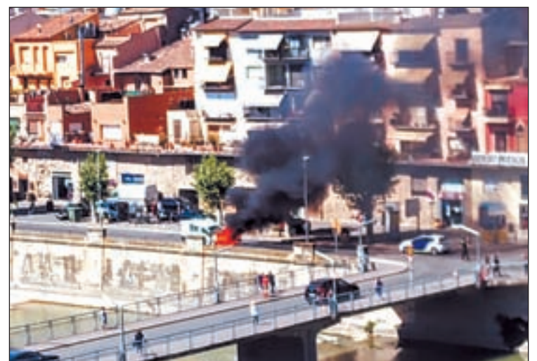
Moment en què cremava la furgoneta

Part d'una furgoneta va quedar ahir calcinada quan aquesta es trobava el carrer Portalet de Balaguer. Els serveis d'emergències van ser alertats del foc a les 11.45 hores i fins al lloc dels fets es va desplaçar una dotació dels Bombers i la Policia Local. No va haver-hi ferits i l'intens fum va crear expectació entre els veïns.