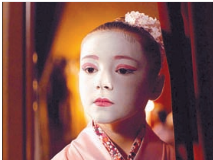
FOTO: / 'Stiker' és un dels curts que competirà a la secció oficial

L'espai central del festival serà, un any més, l'Espai Cultural la Lira de Tremp, però no hi faltaran, com en les darreres edicions, la participació d'altres poblacions en el marc del Mostremp sobre rodes , l'aposta itinerant del fes-