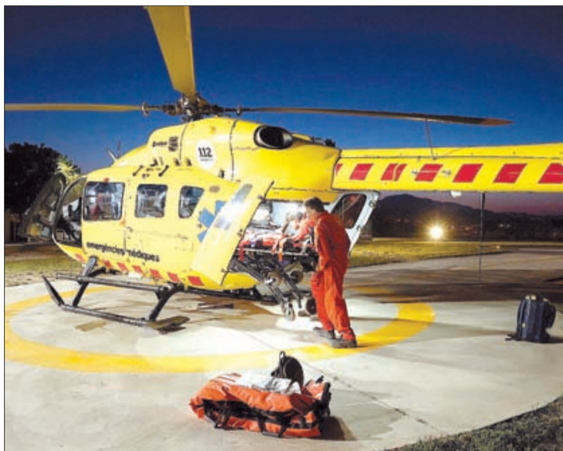
El SEM va començar a fer vols amb l'helicòpter medicalitzat nocturn ara fa dos anys

Durant el confinament per la crisi de la Covid-19 es van reduir