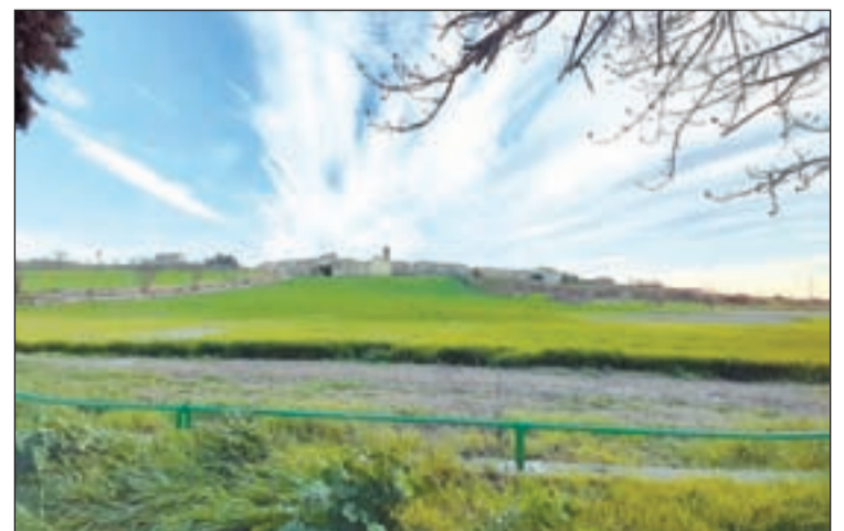
Fotografia que va quedar en segon lloc, 'Torrefeta'