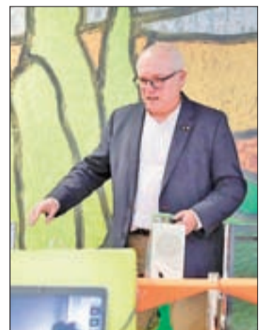
El 'exconseller' en el exilio Lluís Puig