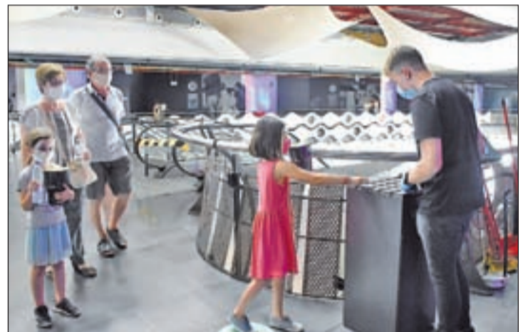
Las medidas sanitarias, fundamentales para reabrir