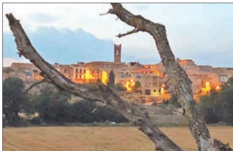
Imatge guanyadora titulada 'Capvespre'