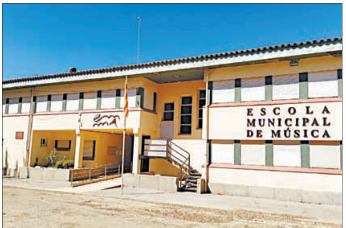
L'edifici de l'Escola Municipal de Música és un del que tindrà una caldera de biomassa

A més amb la instal·lació de la nova caldera també es crearà una nova sala de calderes que es construirà al pati exterior de l'edifici i una sitja per l'emmagatzematge de la biomassa. Les obres ja s'han iniciat i està previst que durin fins a finals del mes de setembre. El projecte d'instal·lació té un pressupost total de 108.145,79€ i compta amb una subvenció de l'IDAE.