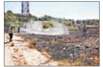
Incendi de camps erms prop de Trep

Incendis de matolls a Trep, Sanahuja i els Omellons