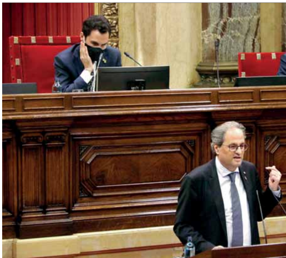
Els presidents del Parlament i de la Generalitat, en un moment del ple de divendres

A JxCat, però, treuen foc pels queixals per la possibilitat que els textos no