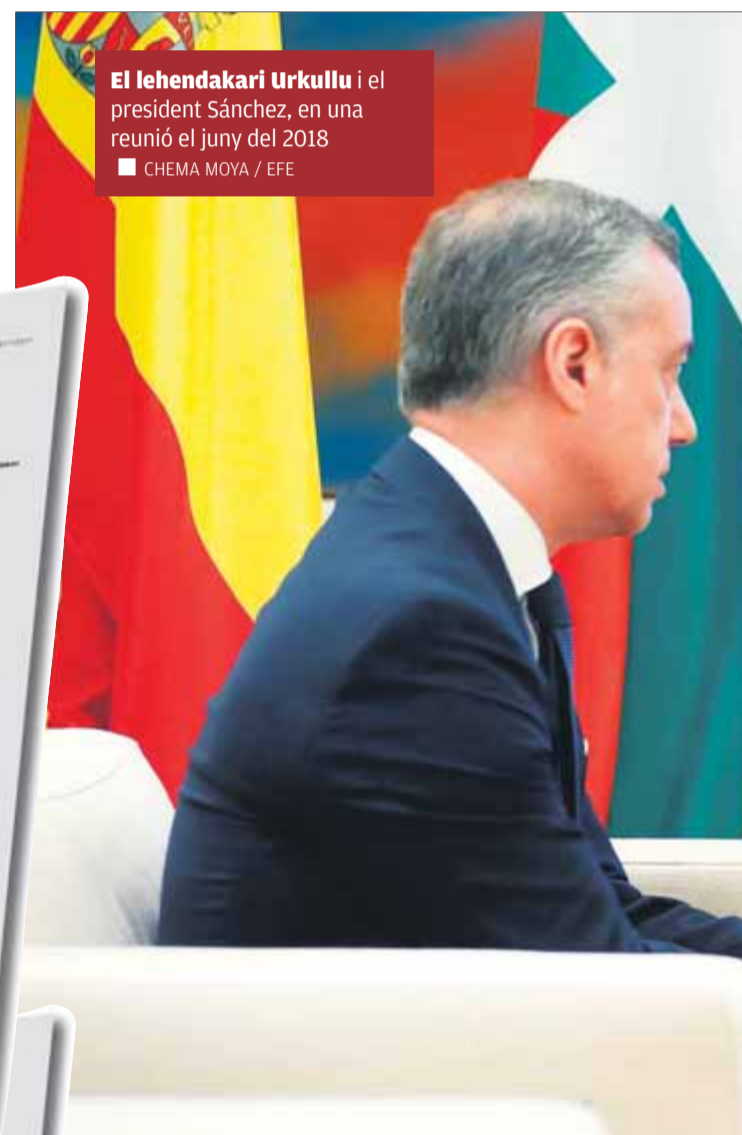
El lehendakari Urkullu i el president Sánchez, en una reunió el juny del 2018