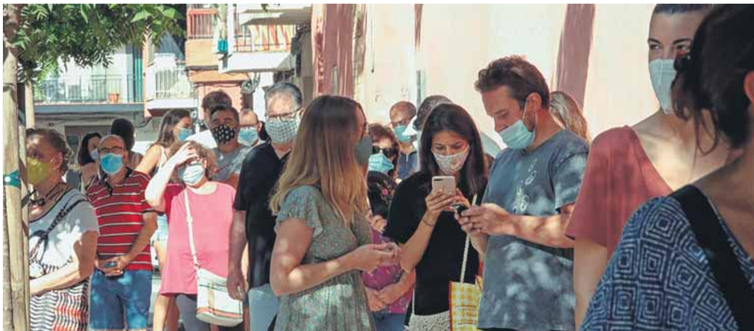
Joves i grans fent cua ahir, a Vilafranca, per fer-se voluntàriament el test de la Covid-19. També se'n van fer a Santa Coloma de Gramenet