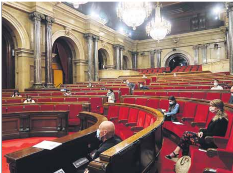
Ple de divendres en què es va reprovar la figura del Joan Carles I

D'aquesta manera han quedat fora la reprova al rei Felip VI el fragrant en què es denuncia la “monarquia delinqüent” i les referències a la “voluntat expressada pel poble de Catalunya” i per la cambra catalana els dies 1, 10 i 27 d'octubre del 2017 –dates del