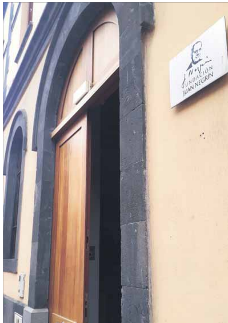
La Fundació Negrín és al barri de La Vegueta de Las Palmas

Negrín patiria, el març del 1939, el cop d'estat de Segismundo Casado amb la col·laboració de Julián Besteiro. Revisar avui els textos del 1939 d'aquest home poliglòt —parlava anglès, francès i alemany— mostra un cervell lúcid sobre el futur d'Europa. “La bogeria de les nacions invasores va induint a l'opinió pública mundial que potser és a prop el dia que poderosos pobles siguin reclosos en un nou gueto”, alerta l'1 de gener del 1939 al poble nord-americà, i el pas del temps ho confirmarà. “El resultat