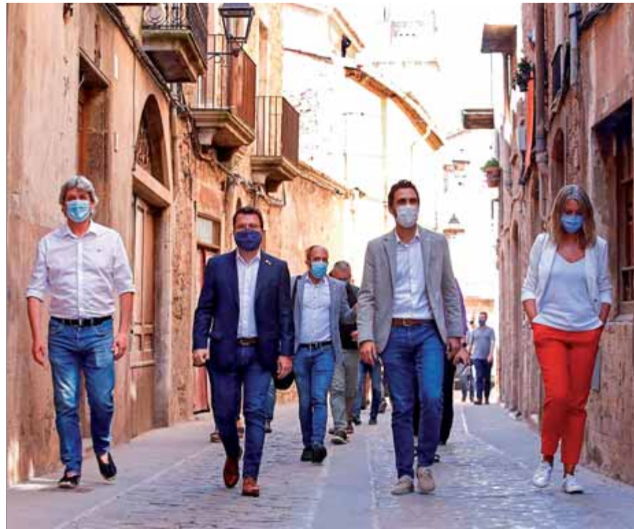
El vicepresident, Pere Aragonès; el president del Parlament, Roger Torrent, i els alcaldes de Mojà, Manresa i Sant Cugat del Vallès, ahir a la capital del Moianès

El president del legislatiu ho va dir al costat del vicepresident del govern, Pere Aragonès, a Mojà, on es van reunir amb una nodrida representació d'alcaldes d'ERC —entre els quals hi havia els de Manresa,