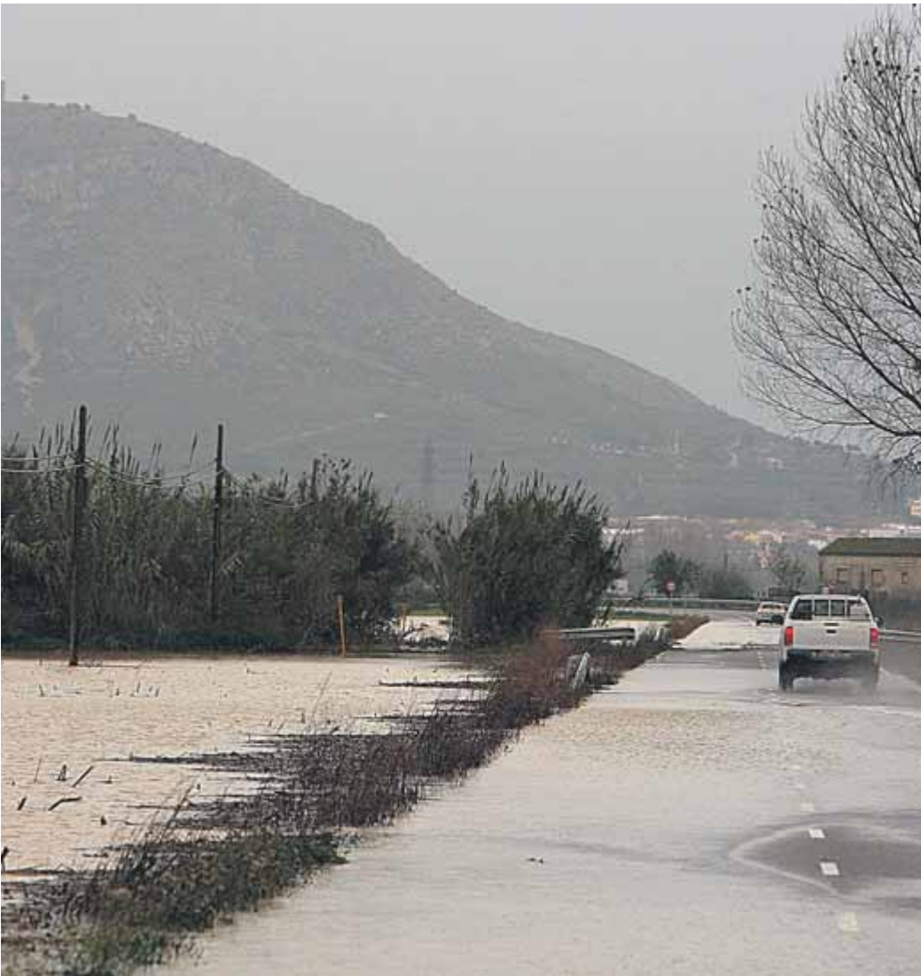
La carretera tallada a Serra de Daró, amb el Montgrí al fons, un dia de temporal