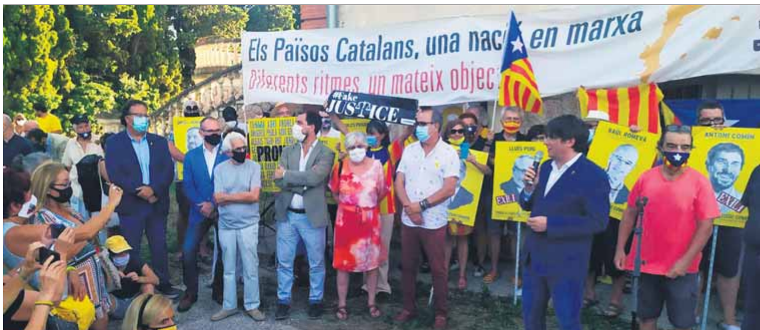
El president Puigdemont es dirigeix als assistents en l'acte ahir a Elna. Al seu costat, els exconsellers i eurodiputats Toni Comín i Clara Ponsatí