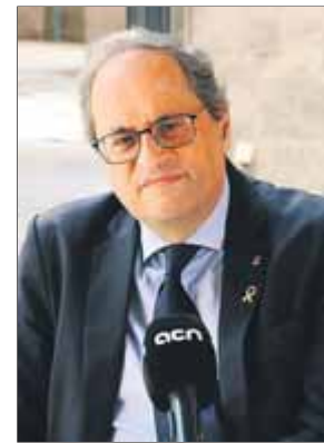
El president Quim Torra, durant l'entrevista concedida a l'ACN

El president de la Generalitat, Quim Torra, té previst anar el 17-S a la vista del recurs del Tribunal Suprem (TS) contra la sentència del Tribunal Superior de Justícia (TSJC) que l'inhabilita per desobediència, amb l'objectiu de "mirar a la cara" els magistrats que "jutgen un president per haver posat una pancarta que demanava la llibertat dels presos i exiliats d'acord amb la comissió de treball de l'ONU" mentre el rei emèrit espanyol, Joan Carles I, "corre fugat". Així es va expressar Torra en la ter-