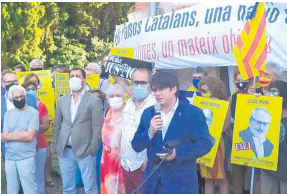
Carles Puigdemont, ahir a la Maternitat d'Elna, secundat per Toni Comín i Clara Ponsatí