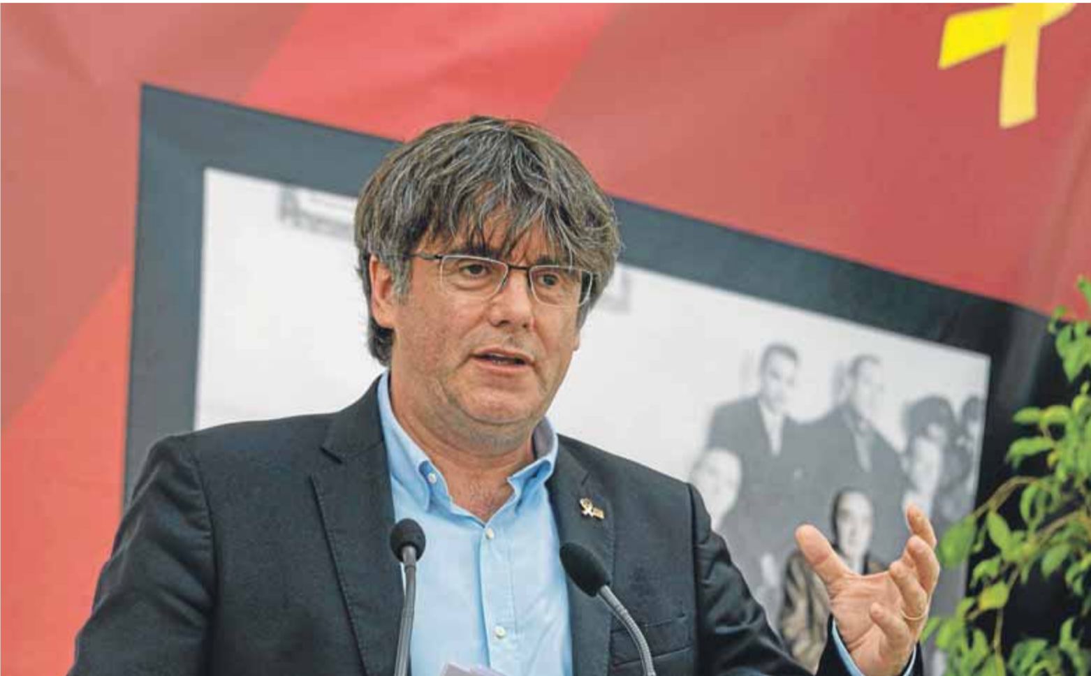
Carles Puigdemont, durant la conferència que va pronunciar ahir en el marc de la Universitat Catalana d'Estiu a Prada