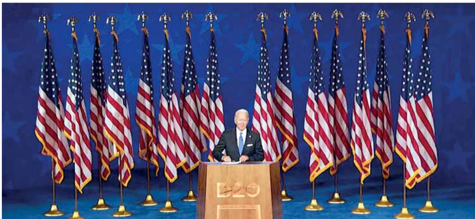
Joe Biden, flanquejat de banderes nord-americanes, durant el seu discurs d'acceptació de la nominació demòcrata a la presidència

Un jutge anul·la la prohibició de fumar a Madrid