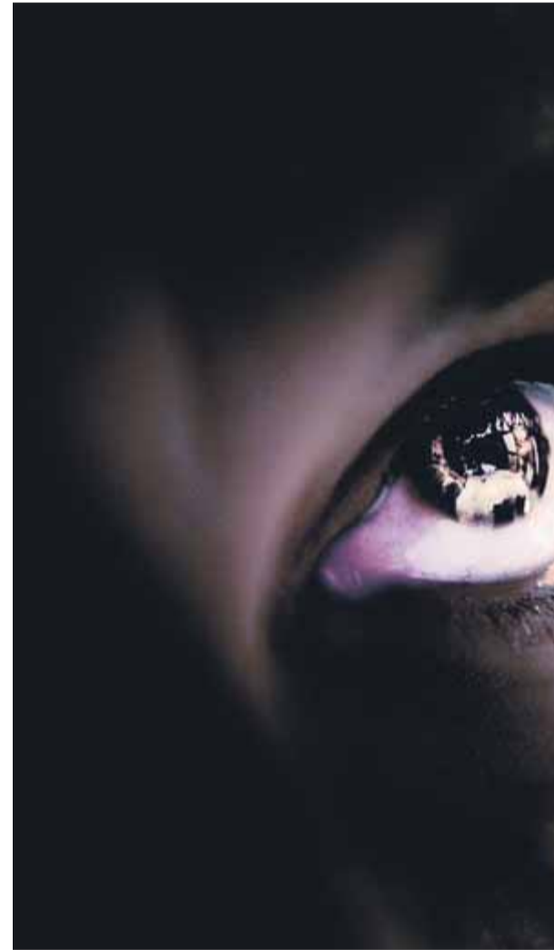
Ser jove i afroamericà no facilita la vida al protagonista de la novel·la

La premsa nacional va recollir la notícia i la gent va poder veure com era realment el reformatori. Feia tres anys que La Nickel era tancada, cosa que explicava l'estat salvatge del terreny i el típic vandalisme adolescent. Fins i tot l'escenari més innocent —un menjador o el camp de futbol— resultava sinistre, sense que calgués retocar les imatges.